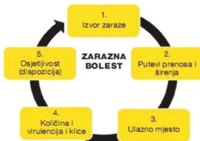
Slika 3.1.1. Vogralikov lanac infekcije