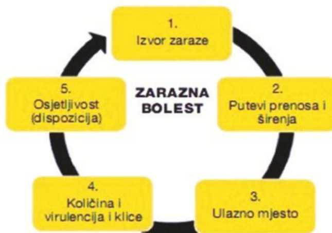
Slika 3.1.1. Vogralikov lanac infekcije