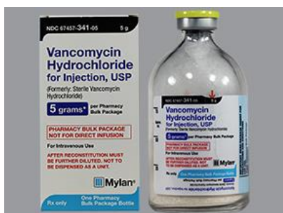
Slika 5.2.1. Vankomicin

https://www.americanpharmawholesale.com/store.php/AmericanPharmaWholesale/pd9063002/vancomycin_5_g_vial_by_mylan_institutional Pregledano 26.03.2019.