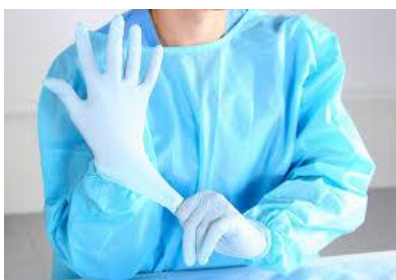
Slika 7.1.1. Mantil i rukavice potrebne kod kontaktne izolacije