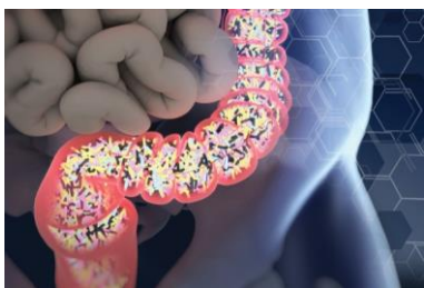
Slika 1. Bakterija uzrokovana C. difficile

https://www.idse.net/Review-Articles/Article/10-17/Clostridium-difficile-Infection-Management-Today-and-Tomorrow/44634 Pregledano 26.03.2019.