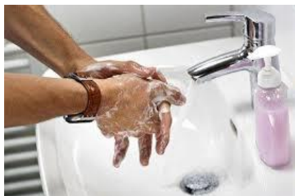
Slika 7.3.1. Pravilna higijena ruku

R. P., i sur. 2008). Treba naglasiti da rukavice ne zamjenjuju higijenu ruku. Kada se brinu za bolesnike s C. difficile skrbnici i članovi obitelji trebaju higijenu ruku vršiti sapunom i vodom, a ne s sredstvima za čišćenje koja se temelje na alkoholu (Gerding, D. N., i sur. 2008).