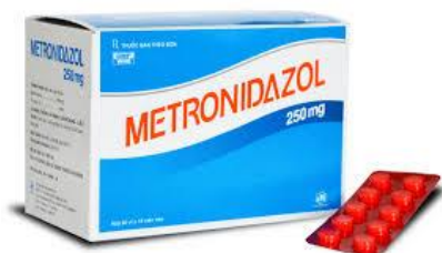
Slika 5.1.1. Metronidazol

te se izlučuje u upalno promijenjenom kolonu (Beus, A. 2011). Doze oralno primijenjenog metronidazola su 250-500 mg, tri do četiri puta na dan, kroz sedam do petnaest dana. U literaturi se navodi kako je to propisano prema preporukama Američkog gastroenterološkog društva. Metronidazol se smatra prvim izborom u liječenju C. difficile . Starije kliničke studije pokazale su vrlo dobar inicijalni odgovor kod oko 95% bolesnika liječenih metronidazolom. Novije studije navode porast broja bolesnika kod kojih klinički odgovor na liječenje metronidazolom nije zadovoljavajući ( Kovačević, N., Čanak G., i Preveden, T. 1998).