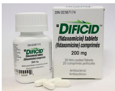
Slika 5.3.1. Fidaksomicin

Za liječenje druge i sljedeće faze bolesti preporučuje se osim vankomicina i fidaksomicin. Fidaksomicin je makrociklični baktericidni antibiotik indiciran kod odraslih za liječenje infekcija uzrokovanih C. difficile , prethodno liječenog peroralnim metronidazolom i/ili vankomicinom, a dozira se peroralno 2 x 200 mg kroz deset dana (Petković, D., i Vuković, B. 2017). U literaturi se navodi istraživanje koji ima cilj prikazati efikasnost i sigurnost primjene antibiotika fidaksomicina u liječenju infekcije uzrokovane C. difficile kod 83-godišnje bolesnice. Lijek se pokazao kao efikasan i superioran u liječenju srednje teškog rekurirajućeg C. difficile (Petković, D., i Vuković, B. 2017).