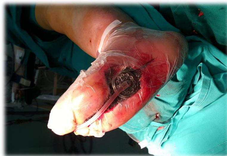
Slika 6.3.1.2. Primjena V.A.C. terapije na stopalu