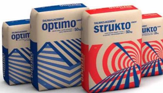
Slika 2.1 Primjer primarne ambalaže, vreća za pakiranje cementa