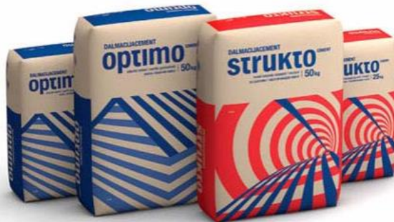
Slika 2.1 Primjer primarne ambalaže, vreća za pakiranje cementa