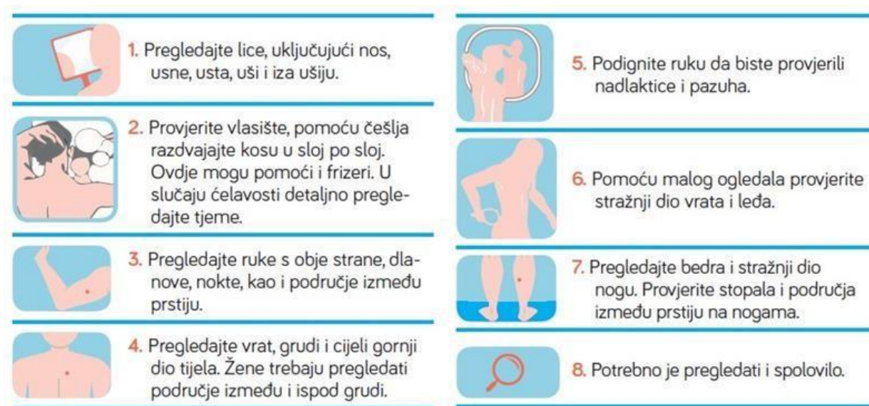
Slika 4. 6. Samopregled kože

Sekundarna prevencija podrazumijeva određivanje i otkrivanje karcinoma kože u najranijem stadiju. U tome pomaže poznavanje faktora rizika, samopregled kože, kao što je prikazano na slici 4.6 te redoviti pregled dermatologa. Ako se osoba prepozna u bilo kojem čimbeniku rizika trebalo bi provoditi samopregled jedanput mjesečno. Kod samopregleda je potrebno obratiti pozornost na mrlje i izrasline koje: mijenjaju veličinu, boju i oblik, izgledaju drugačije od svih ostalih ili su asimetrične i/ili nepravilnog ruba. Ukoliko su veće su od šest mm u promjeru, grube su ili se ljušte, imaju raznolike boje, svrbe. A posebno ako krvare te imaju iscjedak, sjajne su površine te izgledaju poput ranica koje ne zacjeljuju [28].