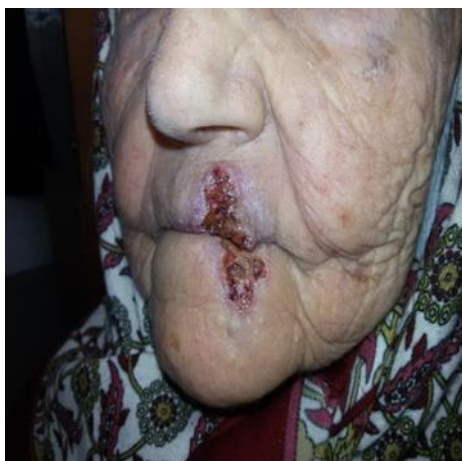
Slika 4.4. Planocelularni karcinom na usni