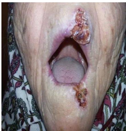
Slika 4.5. Planocelularni karcinom na usni

Promjene pigmentiranih lezija u smislu promjene u boji, obliku, rubovima i veličini pigmentiranih lezija kao i moguće krvarenje, mogu upućivati na melanom. Važno je obratiti pozornost na svaku asimetriju promjene, neoštru ograničenost okolne kože, nejednolikost u pigmentaciji, promjer veći od 5 mm, promjenu koja se izdiže iznad razine kože ili nestaje, koja izaziva svrbež, peckanje ili bol te koja raste. Klinička slika melanoma različita je na različitim anatomskim lokalizacijama te ovisi o tipu rasta tumora [31].