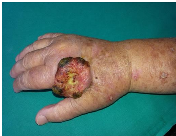
Slika 4.1. Bazocelularni karcinom na šaci