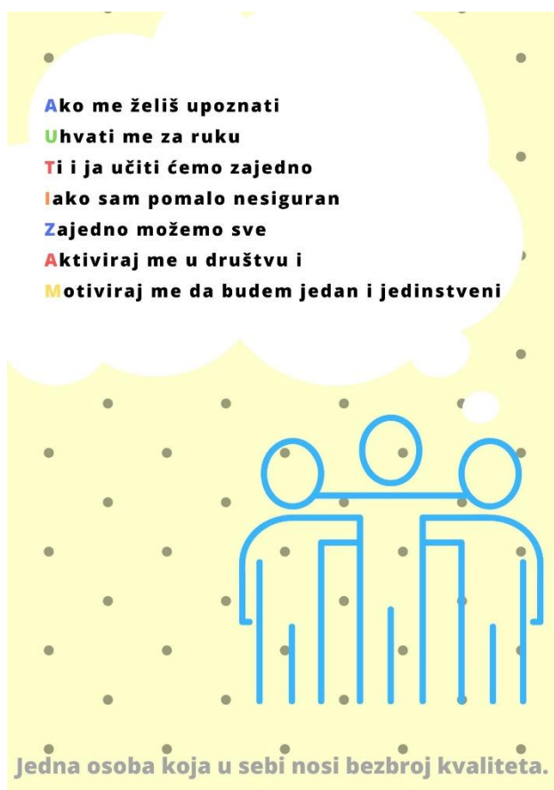
Slika 13. 1. Posebnost autizma

Kao budući kadar zdravstva, voljela bih prenjeti na Vas svoje riječi i dati Vam do znanja ako ste u nedoumici, da autizam ne biraju ljudi, već on bira ljude. Nevjerojatno je koliko ta djeca imaju volje i želje za ponovnim učenjem i usvajanjem znanja. Oni će svojom nesebičnošću pokazati da se ne boje vlastitih želja. Oni su isto samo djeca koja vole igru i jednostavno žele biti “samo dijete” na što se nadovezuje letak kojeg sam izradila: upoznaj me, uhvati me za ruku, aktiviraj me i motiviraj da budem jedan i jedinstveni.