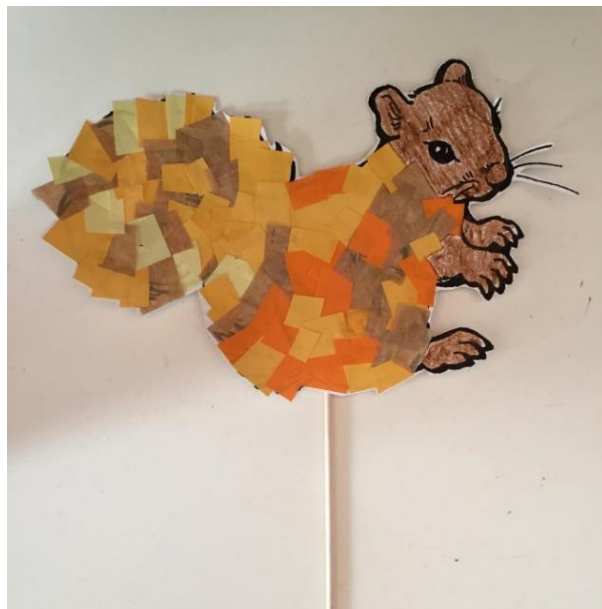
Slika 6. 5. 2. Dijete s poremećajem iz spektra autizma koje je samo uz pomoć kolaža i ljepila napravilo vjevericu Autor: Stella Kocijan, 2019.