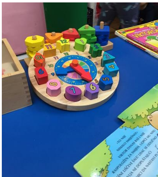
Slika 6. 6. 1. Sat pomoću kojeg dijete razvija svoje motoričke sposobnosti i vještine Autor: Stella Kocijan, 2019.