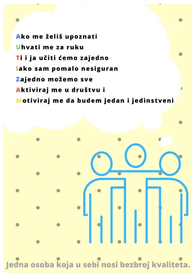
Slika 13. 1. Posebnost autizma

Kao budući kadar zdravstva, voljela bih prenjeti na Vas svoje riječi i dati Vam do znanja ako ste u nedoumici, da autizam ne biraju ljudi, već on bira ljude. Nevjerojatno je koliko ta djeca imaju volje i želje za ponovnim učenjem i usvajanjem znanja. Oni će svojom nesebičnošću pokazati da se ne boje vlastitih želja. Oni su isto samo djeca koja vole igru i jednostavno žele biti “samo dijete” na što se nadovezuje letak kojeg sam izradila: upoznaj me, uhvati me za ruku, aktiviraj me i motiviraj da budem jedan i jedinstveni.