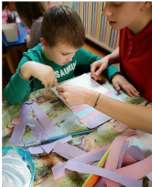
Slika 6. 5. 1. Dijete s poremećajem iz spektra autizma koje radi uz pomoć likovne terapije

Likovna terapija primjenjuje se u gotovo svim vrstama poremećaja u djece i odraslih, pa tako i ovdje. Mnoga djeca s poremećajem iz spektra autizma zbog izostanka govora putem crteža mogu izreći svoje želje i misli. Cilj likovne terapije je poticanje i podizanje razine kreativne izražajnosti osobe sa svrhom korištenja ovog modela kao komunikacijski kanal za izražavanje, upoznavanjem svijeta i sebe, rasterećivanje napetosti i sprječavanje pojedinih nepoželjnih oblika ponašanja.