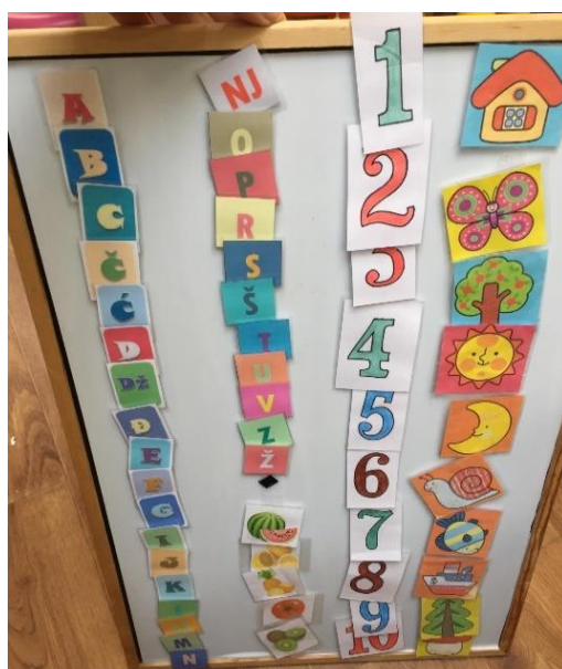
Slika 6. 6. 2. Ploča pomoću koje dijete razvija svoje motoričke sposobnosti i vještine Autor: Stella Kocijan, 2019.