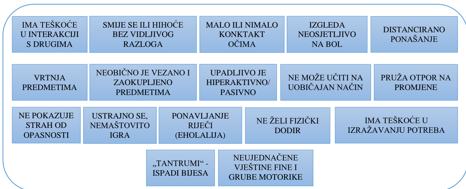
Slika 4. 4. 1. Najčešći simptomi prepoznavanja osoba s poremećajem iz spektra autizma

„Ako možete, pronađite grupu podrške za roditelje kako bih vas podržali da se ne osjećate toliko usamljeno“ Roditelj (Penko, 2017. – 2020. Autizam: Vodič za roditelje i njegovatelje nakon postavljanje dijagnoze)