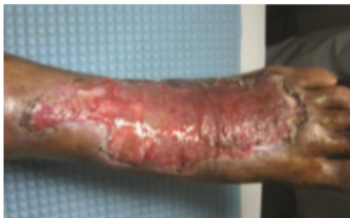
Slika 7.4. Dijabetičko stopalo nakon 2.5 mjeseca HBOT