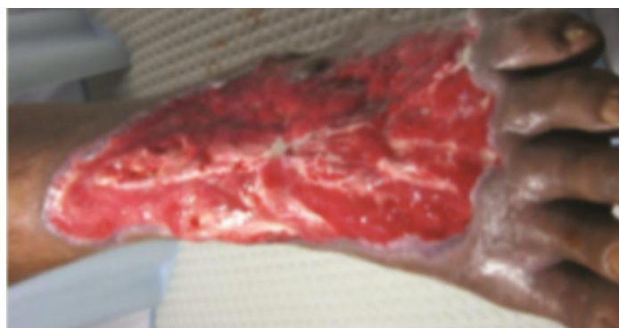
Slika 7.3 Dijabetičko stopalo nakon 2 tjedna i 10 serija HBOT