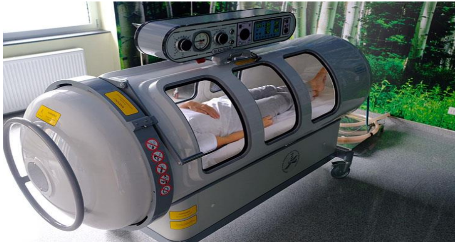
Slika 3.1.1. Jednomjesna hiperbarična komora