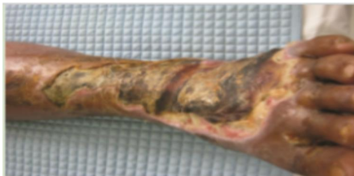
Slika 7.1. Dijabetičko stopalo koje ne cijeli 2.5 mjeseca

uočeni. Na slici 7.4. je dijabetičko stopalo nakon 2.5 mjeseca HBOT, kožnog grafta i standardne terapije [12].