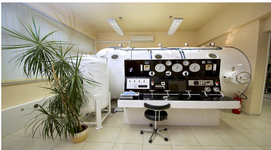
Slika 3.2.1. Višemjesna HB komore s kontrolnom pločom