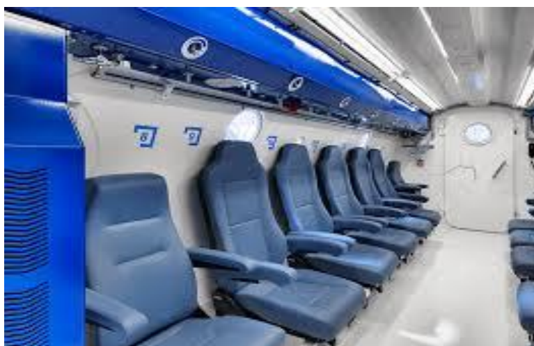
Slika 3.2.2. Prikaz unutrašnjosti višemjesne komore