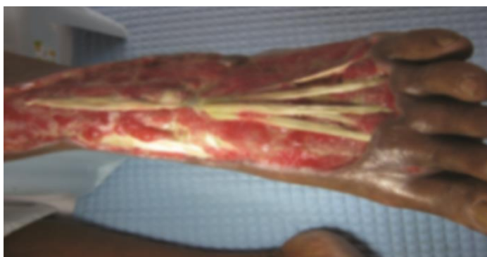
Slika 7.2. Dijabetičko stopalo nakon 5 serija HBO

Izvor: L. Tongson, D. L. Habawel, R. Evangelista, J. Lerry Tan: Hyperbaric oxygen therapy as adjunctive treatment for diabetic foot ulcers, Wound International, December 1. 2013, Vol 4. Issue 4