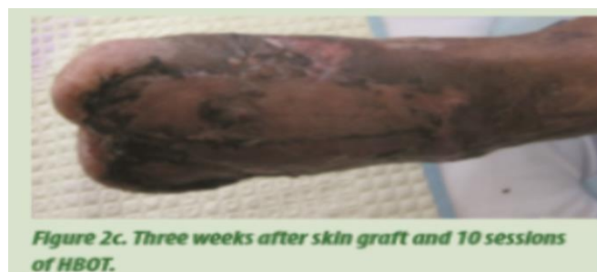
Slika 4.7.3. graft i 3 mjeseca HBO