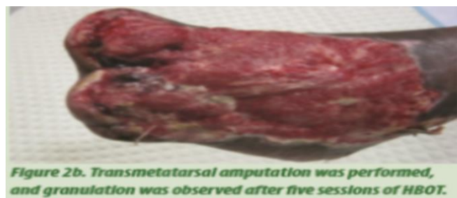
Slika 4.7.2. Nakon 5 terapija HBO