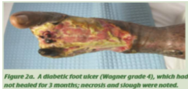
Slika 4.7.1. Dijabetičko stopalo

kožnog grafta, te 10 serija terapije hiperbaričnim kisikom. Naposljetku slika 4.7.4. prikazuje potpuno zacijeljeno stopalo nakon 3 mjeseca terapije hiperbaričnim kisikom. [12].