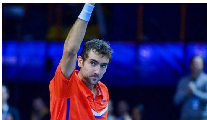
Slika 5.1.6.1. Hrvatski tenisač, Marin Čilić

detaljne provjere smije li ga koristiti. Ipak, na kraju se saznalo da Čilić uopće nije bio pozitivan na doping testu, to jest bio je pozitivan, ali na tvar koja je dozvoljena. „Morning Herald iz Sydneya objavio je zanimljivu priču po kojoj Marin Čilić uopće nije niti bio pozitivan na doping testu, Naime prema onome što je i sam Čilić izjavio na turniru u Parizu suspenzije su ga stajali 'loša znanost i (tuđe) greške dovele do suspenzije', te da se na kraju ispostavilo da uopće nije bio pozitivan na niketamid, već na njegov marker, koji nije zabranjena supstanca.“ ( https://www.slobodnadalmacija.hr/sport/tenis/clanak/id/216407/marin-cilic-uopce-nije-niti-bio-pozitivan-na-doping-testu ). Čilić je na kraju bio suspendiran četiri mjeseca i oslobođen je optužbi. Nakon suspenzije Marin je osvojio šest turnira i ostvario svoj najbolji rezultat osvajanjem US Open turnira. 2017. godine bio je četvrti tenisač svijeta, a igrao je i još dva velika finala, na turnirima Australian Opena i Wimbledona na kojima ga je pobjeđivao Roger Federer. Danas je dvadeset osmi igrač svijeta.