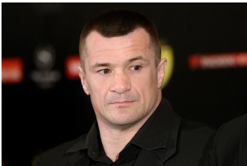
Slika 5.1.4.1. Hrvatski borac, Mirko Filipović

Kada je proglašen krivim i dobio suspenziju, Mirko je otišao u mirovinu te se nije imao namjeru više boriti. Nakon par mjeseci zaslužene mirovine, dobio je priliku za novu borbu. Organizacija RIZIN nije pod utjecajem UFC-a i Mirko se može boriti u njihovoj organizaciji bez obzira na kaznu. Uslijedilo je šest borbi u RIZIN-u u kojima je ostvario šest pobjeda te posljednja borba u organizaciji Bellator i pobjeda protiv velikog Roya Nelsona nakon koje je imao ozbiljnih zdravstvenih problema te je sada u definitivnoj mirovini