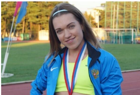
Slika 5.2.2.1. Ruska atletičarka, Kseniya Savina

Ruska atletičarka, Kseniya Savina, vlasnica je jedne od najrigoroznijih kazni u svijetu sporta. Zbog dopinga je kažnjena na čak dvanaest godina! „Njen trener i suprug Alexei Savin suspendiran je na četiri godine zbog kršenja antidopinških pravila, dodaje Savez. Jedinica za integritet atletike (AIU), koji nadzire anti-dopinška pitanja u atletici, prošli je mjesec odlučila da su njih dvoje optuženi za "urotu i suučestvo" u kršenju antidopinških pravila.“ ( https://www.vecernji.hr/sport/nova-doping-afera-poznata-sportasica-suspendirana-na-cak-12-godina-1317922 ).