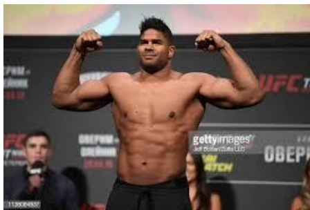
Slika 5.2.3.1. Nizozemski borac Alistair Overeem

Svakako jedno od najpoznatijih imena kada se govori o dopingu je ono UFC borca teške kategorije Alistaira Overeema. „Testiranje napravljeno 27. ožujka 2012. godine je kod Overeema pokazalo povećani T/E omjer, odnosno omjer testosterona i epitestosterona. Njegov A uzorak je imao omjer veći od 10:1, dok je dozvoljen maksimalni od 6:1. Sve to ukazivalo je na uporabu steroida, bez kojih se njegov izgled ne bi drastično promijenio u posljednjih nekoliko godina.“ ( https://arhiva.fightsite.hr/rubrike/ufc/crna-lista-ovo-su-najpoznatija-imena-uhvacena-s-prstima-u-pekmezu/ ). Nakon afere sa steroidima do danas je imao petnaest borbi od kojih je devet pobijedio.