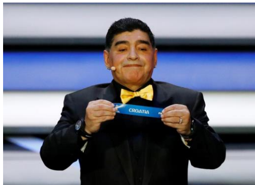
Slika 5.2.4.1. Argentinski nogometaš Diego Armando Maradona

Nakon nogometne karijere navodno se više puta liječio od ovisnosti o kokainu. Tri puta je bio hospitaliziran, međutim opovrgnuti su natpisi da se predozirao kokainom. U talijanskim medijima 2017. godine izjavio je da je već trinaest godina čist.