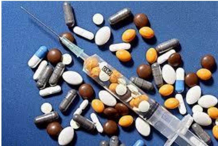
Slika 3.3.1. Ilustracija dopinga

Sve ovo pokazuje da doping nije štetan samo za sportaše, odnosno negativno djelovanje se ne ograničava na sferu individue, već se proširuje i na društvo, sudjelujući u izgradnji sistema negativnih vrijednosti. (...) Ovo predstavlja ključni razlog zašto bi se trebali provoditi brojni preventivni programi u području sporta te se shodno tome trebaju vršiti i brojne analize i kontrole.“ 5 ( https://www.seminarski-diplomski.co.rs/SPORT I MENADZMENT U SPORTU/DopingAntidoping.html ).