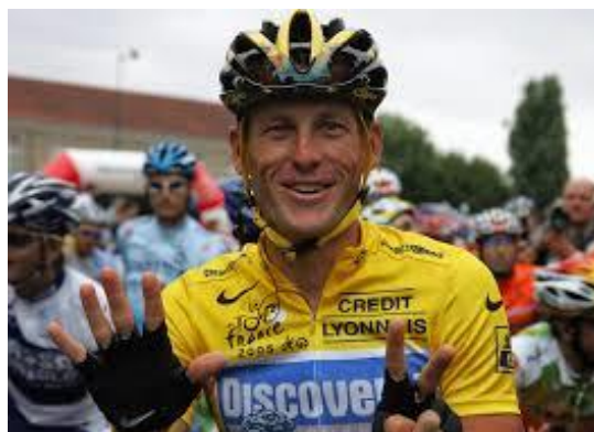
Slika 5.2.1.1. Američki biciklist Lance Armstrong

Nakon afere Armstrong je postao sinonim za izdajicu i prevaranta. Gdje god bi se pojavio u javnosti ljudi su ga napadali, a navodno ga je netko i gađao mandarinama na tržnici. Da stvar bude gora, gostovao je u emisiji i rekao kako ne žali ni za čime te da bi ponovio sve što je napravio što je naravno samo povećalo mržnju cijeloga svijeta na nekadašnjeg vrhunskog sportaša i prvaka