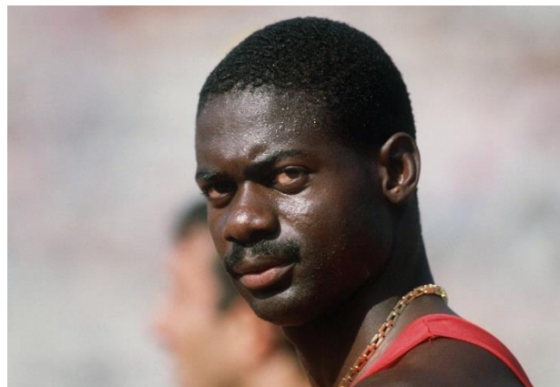
Slika 5.2.5.1. Kanadski atletičar Ben Johnson

Do danas, Ben Johnson je ostao jedan od najvećih varalica u povijesti atletike ali zahvaljujući njemu doping kontrole su počele biti sve češće i kvalitetnije.