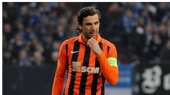
Slika 5.1.7.1. Hrvatski nogometaš, Darijo Srna

Darijo Srna bio je kapetan Hrvatske nogometne reprezentacije 13 godina, kao kapetan Šahtara stekao je status ikone kluba, no onda je uslijedio šok. Srna je bio pozitivan na doping testu. „Nacionalni antidoping centar Ukrajine naveo je u svom priopćenju da je Srna suspendiran od 22. ožujka 2017. godine te da se na teren može vratiti 22. kolovoza ove godine, dakle 17 mjeseci, što ni nije toliko loša vijest s obzirom da je bivšem hrvatskom kapetanu prijetila i maksimalna kazna od četiri godine što bi značilo i kraj karijere.“ ( https://www.tportal.hr/sport/clanak/darijo-srna-saznao-kaznu-zbog-dopinga-bez-milosti-za-bivseg-hrvatskog-kapetana-foto-20180222 ). Darijo Srna slovio je za jednog od najustrajnijih sportaša u Hrvatskoj i usprkos suspenziji, nije odustao od nogometa. Vratio se i to igranjem u talijanskoj ligi. Bivši kapetan hrvatske nogometne reprezentacije vratio se nogometu nakon točno jedanaest i pol mjeseci izbjivanja te progovorio o svemu što se događalo tijekom afere s dopingom. Nogometu se vratio u dresu Cagliarija. ( https://gol.dnevnik.hr/clanak/rubrika/nogomet/darijo-srna-progovorio-o-slucaju-doping-i-reprezentaciji-bilo-mi-je-strasno-a-ovo-s-nacionalnim-stadionom-su-nebuloze---528786.html ). Darijo Srna se umirovio 20.6.2019. te postao pomoćni trener u Šahtaru.