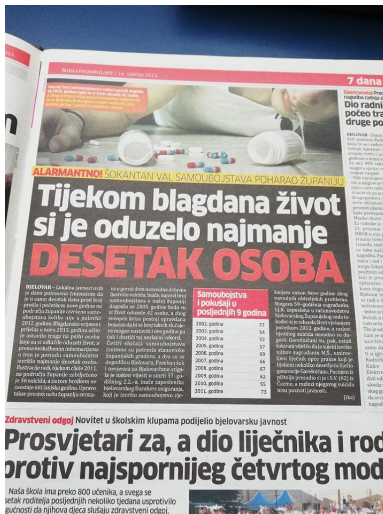
Slika 8: Bjelovarski list, objavljen dana 14. siječnja 2013. godine

U Bjelovarskom se listu tijekom 2013. godine šest puta pisalo na temu samoubojstava. Prva vijest, od njih šest, nosi naslov: „ Tijekom blagdana život si je oduzelo najmanje desetak osoba “, a objavljena je 14. siječnja. Vijest se nalazi u rubrici 7 DANA, na petoj stranici tjednika. Uz vijest o tome kako si je na kraju 2012. godine život oduzelo više osoba, negoli je to bilo kroz čitavu spomenutu godinu, donosi i uznemirujuću fotografiju, vidljivu ispod teksta. Uz fotografiju, tjednik nudi i popis samoubojstava i pokušaja istog u razdoblju od 2002. do 2011. godine.