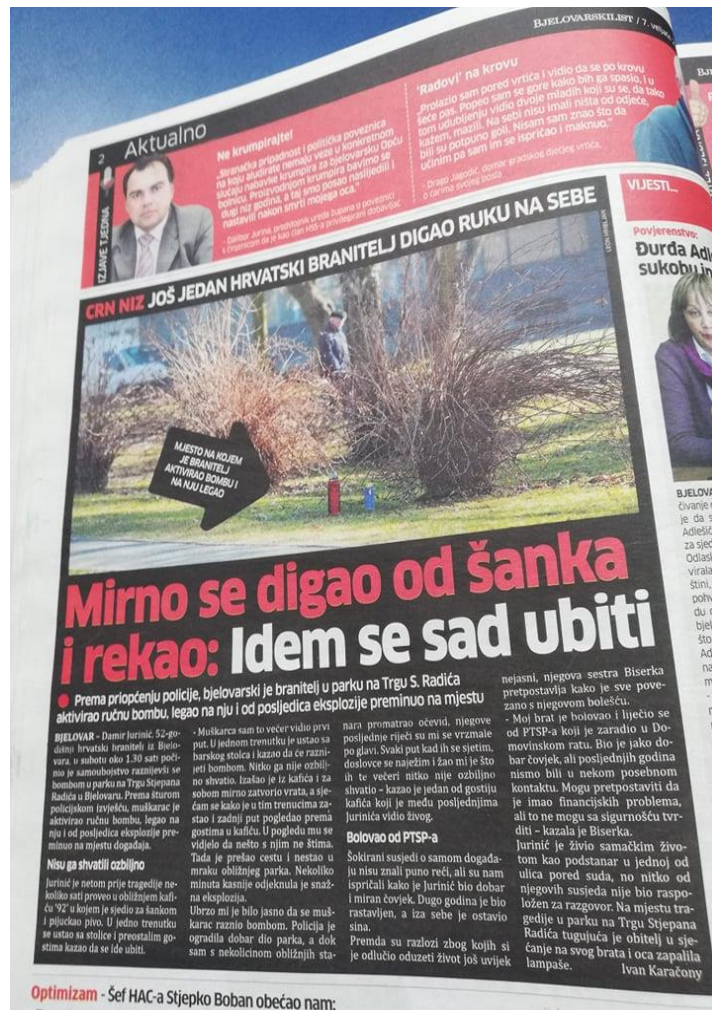
Slika 3: Bjelovarski list, objavljen dana 07. veljače 2011. godine

Bjelovarski je list, tjedan dana kasnije, točnije 14. veljače, objavio upozorenje na velik broj samoubojstava kod branitelja. Tako vijest u rubrici CRNA KRONIKA nosi naslov: „Ubila se 53 branitelja.“ Vijest je vezana uz prošlotjedno samoubojstvo branitelja koji se raznio bombom. Ovom vijeću je, kako navodi tjednik, htjelo ukazati na važnost liječenja branitelja od PTSP-a, kako se više ne bi događali tragični događaji.