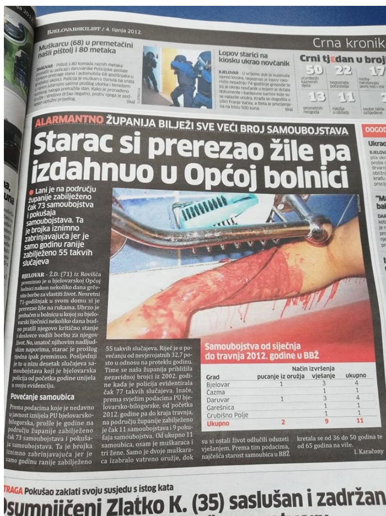
Slika 5: Bjelovarski list, objavljen dana 04. lipnja 2012. godine

ispod, neprimjerenost objavljivanja načina samoubojstva može izuzetno loše utjecati na čitatelje. Uz to, kao što je vidljivo, list nudi i uznemirujuću tablicu s ukupnim brojem samoubojstava u razdoblju od četiri mjeseca. Naslovom je vijesti rečeno sve o izvršenju i ishodu samoubojstva.