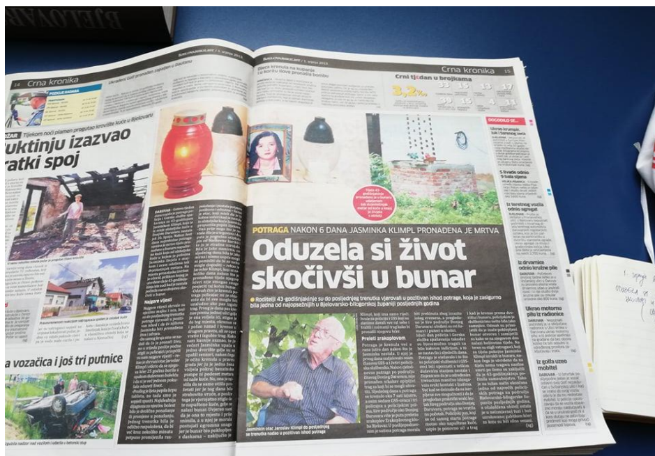
Slika 9: Bjelovarski list, objavljen dana 18. ožujka 2013. godine

U rubrici Crna kronika, Bjelovarski je list na obje stranice, kao najvažniju, smjestio vijest koja nosi naslov: „ Oduzela si život skočivši u bunar. “