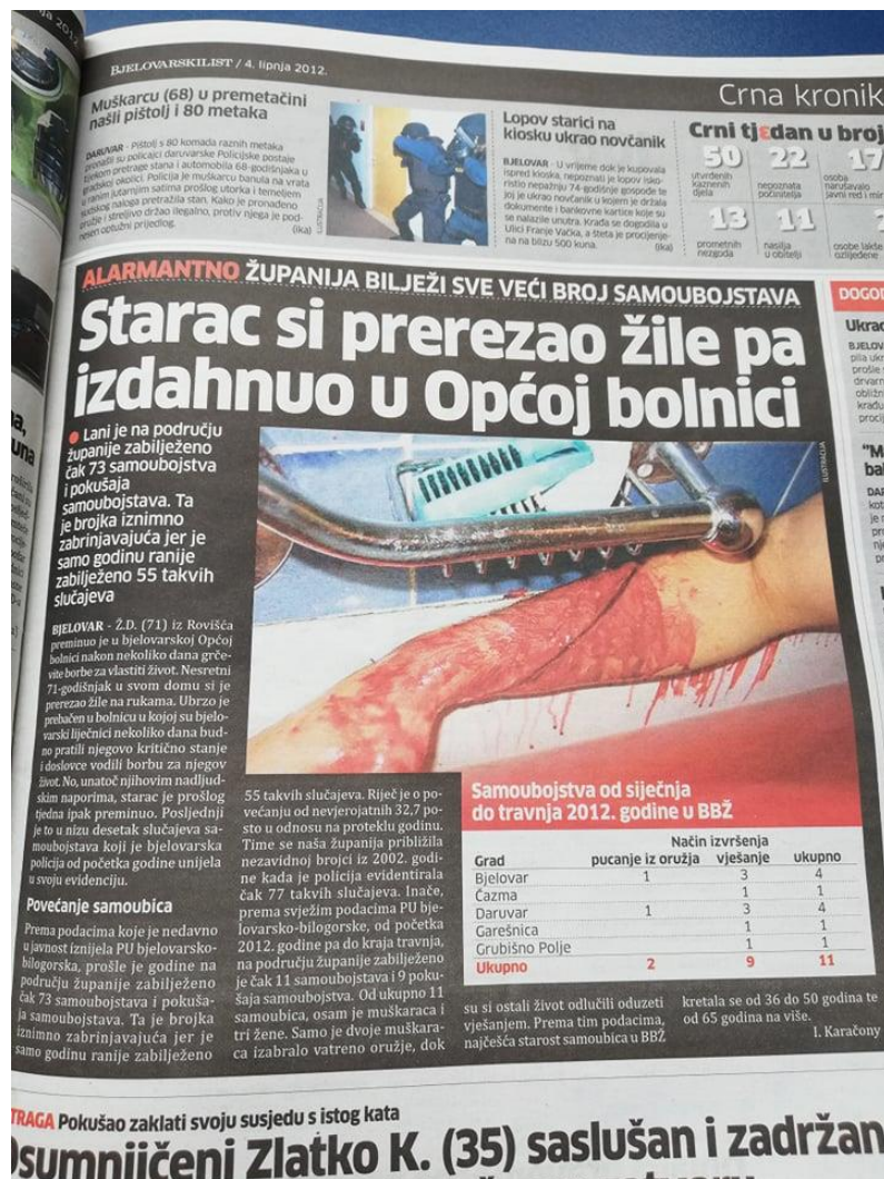
Slika 5: Bjelovarski list, objavljen dana 04. lipnja 2012. godine

ispod, neprimjerenost objavljivanja načina samoubojstva može izuzetno loše utjecati na čitatelje. Uz to, kao što je vidljivo, list nudi i uznemirujuću tablicu s ukupnim brojem samoubojstava u razdoblju od četiri mjeseca. Naslovom je vijesti rečeno sve o izvršenju i ishodu samoubojstva.