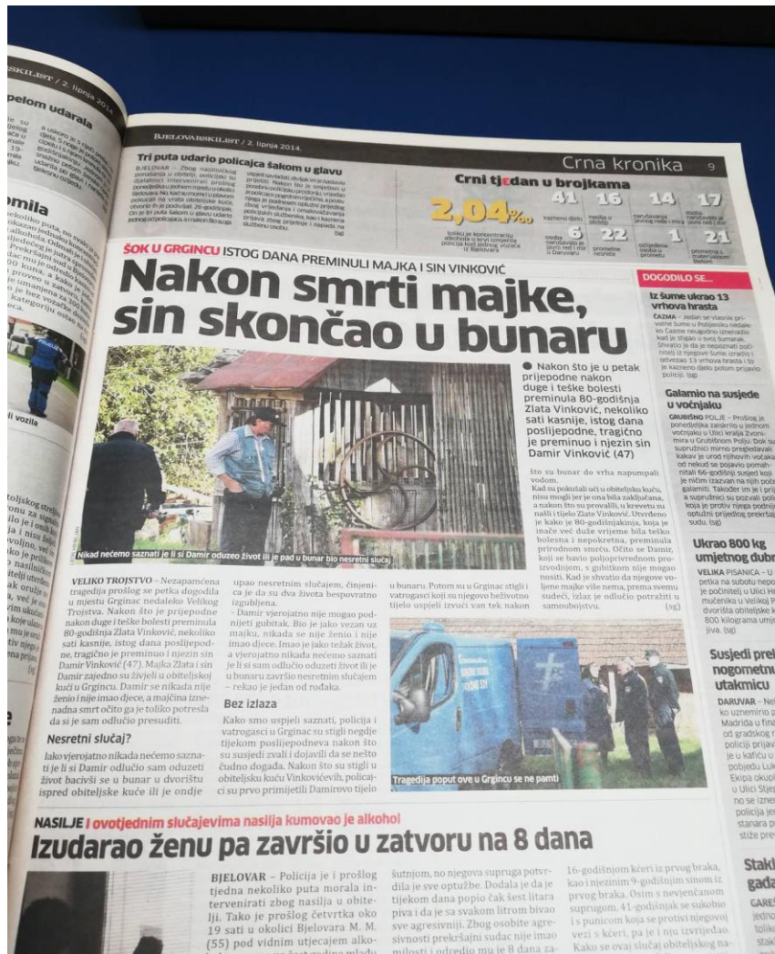
Slika 10: Bjelovarski list, objavljen dana 02. lipnja 2014. godine

2. lipnja naslovnica donosi naslov: „ Damir nije mogao živjeti bez majke, skočio u bunar “.