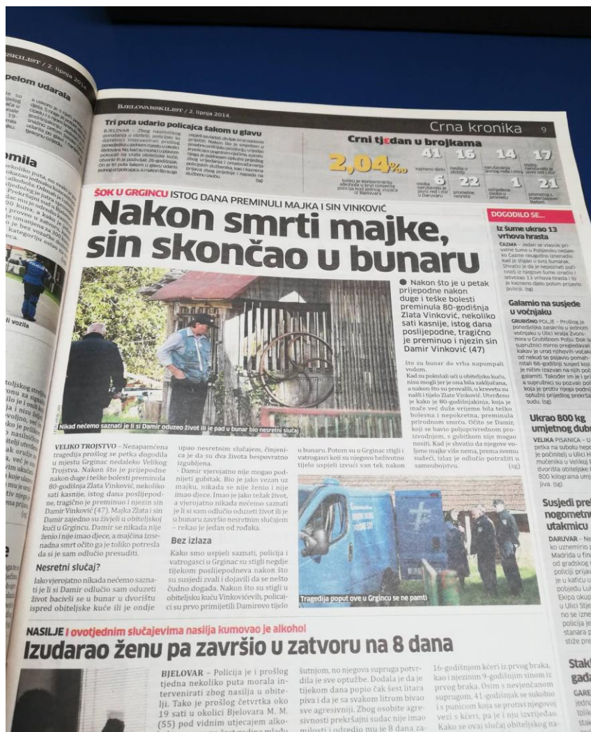
Slika 10: Bjelovarski list, objavljen dana 02. lipnja 2014. godine

2. lipnja naslovnica donosi naslov: „ Damir nije mogao živjeti bez majke, skočio u bunar “.