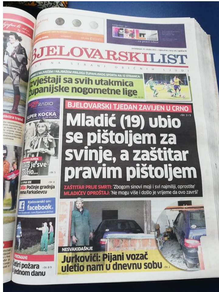
Slika 4: Bjelovarski list, objavljen dana 21. ožujka 2011. godine

Naslovnica od dana 21. ožujka 2011. godine iznenađuje svojim senzacionalističkim naslovom, kao što je vidljivo na fotografiji.