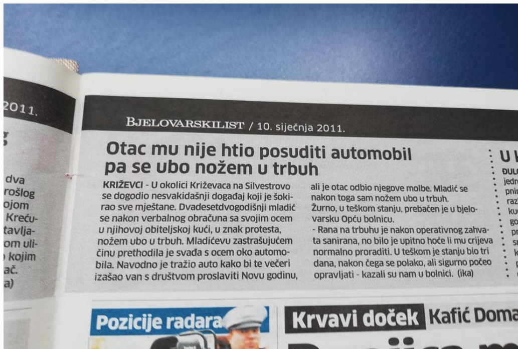
Slika 2: Bjelovarski list, objavljen dana 10. siječnja 2011. godine

Sljedeća vijest potječe od dana, 7. veljače 2011. godine. U 135. broju tjednika na naslovnoj stranici, u desnom donjem kutu, možemo uočiti naslov: „ RAZNIO SE BOMBOM: Popio pivo i mirno rekao: Idem se sad ubiti. “ Ovoj je vijesti posvećena gotovo čitava druga stranica tjednika, rubrike Aktualno. Kao što je uočljivo na fotografiji ispod teksta, tjednik je prenio i kazaljkom ukazao gdje se točno nalazi mjesto na kojem je, kako glasi i nadnaslov još jedan hrvatski branitelj digao ruku na sebe. Vijest nudi i detaljan opis izvršenja samoubojstva, godine samoubojice, vrijeme izvršenja samoubojstva, kao i njegovo ime i prezime. Pozitivno je što je u ovoj vijesti naglašeno kako je preminuli bolovao od PTSP-a, kao što naputci i predlažu: „ valja spomenuti bilo koji mentalni problem koji je imala osoba. “