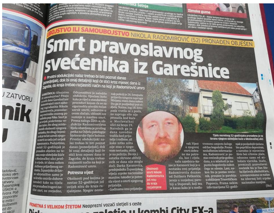
Slika 6: Bjelovarski list, objavljen dana 05. studenog 2012. godine

U studenom, na sreću, možemo pronaći samo jednu vijest koja donosi vijest o samoubojstvu. Naslovnica donosi pogrdan i iznenađujući naslov: „Garešnički pravoslavni pop pronađen obješen na tavanu.“ U pravilu, riječ pop pogrdna je, pravilno bi bilo napisati svećenik ili paroh . Ispravak se uviđa već na trećoj stranici tjednika. Detalji vidljivi na fotografiji.