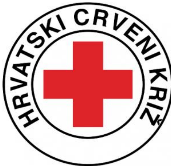
Slika 6.1 Kružni logo Hrvatskog Crvenog križa