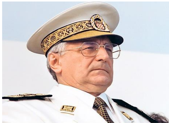
Fotografija 3: Prvi Hrvatski predsjednik Dr. Franjo Tuđman

Iako se smatra da je HDZ najstarija hrvatska stranka, povjesničari navode da to nije istina budući je početkom raspada Socijalističke Federativne Republike Jugoslavije, prva stranka koja je osnovana bila Hrvatska socijalno-liberalna stranka (HSLŠ). Dunatov (2010:388) navodi da je tek nakon toga dana 17. lipnja 1989. godine, utemeljena Hrvatska Demokratska Zajednica. Njezin utemeljitelj je Franjo Tuđman, ujedno i prvi predsjednik Republike Hrvatske. Na prvim višestranačkim izborima u Republici Hrvatskoj održanim 22. travnja 1990. godine, odnosno u drugom krugu održanom 6. svibnja 1990. godine, na koje je izašlo 80 posto birača, navedena stranka je osvojila 42 posto glasova. Navedena stranka je inicirala i prvi referendum u Republici Hrvatskoj održan 19. svibnja 1991. godine u kojemu je većinskom odlukom glasača Hrvatska raskinula sve do tadašnje veze sa takozvanom SFRJ.