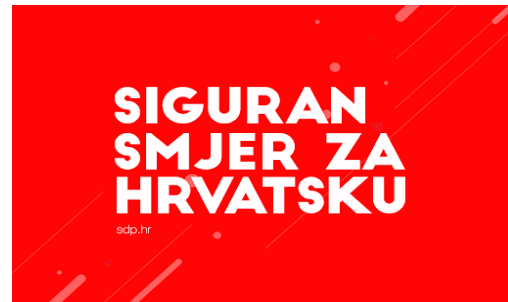
Slike broj 1 i 2: Izborni slogani HDZ i SDP za parlamentarne izbore 2016. godine slika 1 preuzeto sa: (3.3.2020.).

Od ostalih stranaka koje su igrale određenu, značajniju ulogu i u izbore su izlazili samostalno značajni su bili još i politička platforma MOST, sastavljena od niza lokalnih političara, te anarhijski politički pokret pod nazivom Živi Zid, a određeni broj glasova je osvajala izborna lista Milana Bandića. Ostale političke stranke i pojedinci su u istraživanjima javnog mijenja i popularnosti stranaka najčešće nisu prelazile izborni prag ili su osvajale minimalan broj mandata te im je jedina šansa za ulazak u Hrvatski Sabor bilo koaliranje sa nekom od većih političkih stranaka. Što se tiče političkih vođa kao što smo ranije rekli najznačajniji su bili Andrej Plenković na čelu HDZ i Zoran Milanović na čelu SDP. Od ostalih značajnih predstavnika političkih stranki ispred MOSTA je bio Božo Petrov, ispred Živog Zida je bio Ivan Vilibor Sinčić dok je listu Milana Bandića predvodio Milan Bandić, gradonačelnik Zagreba. Stranke su svoju kampanju bazirale najčešće na privlačnosti i prednostima svojih vođa. Tako je HDZ u prvi plan stavljao uspješnu diplomatsku karijeru Andreja Plenkovića, njegova poznanstva i ugled unutar Europske Unije, poznavanje jezika i uglađenost i odmjerenost u nastupu.