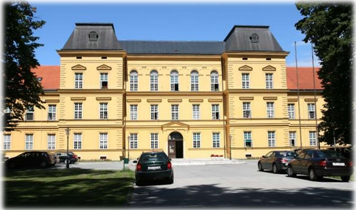
Slika 2.1.1. Klinika za psihijatriju Vrapče

Klinika za psihijatriju Vrapče (slika 2.1.1.) ima iza sebe bogatu povijest te znanje i iskustvo sa forenzičkom psihijatrijom, od samog osnutka bolnice 1879. godine (tada poznate kao „Kraljevski zemaljski zavod za umobolne Stenjevac“).