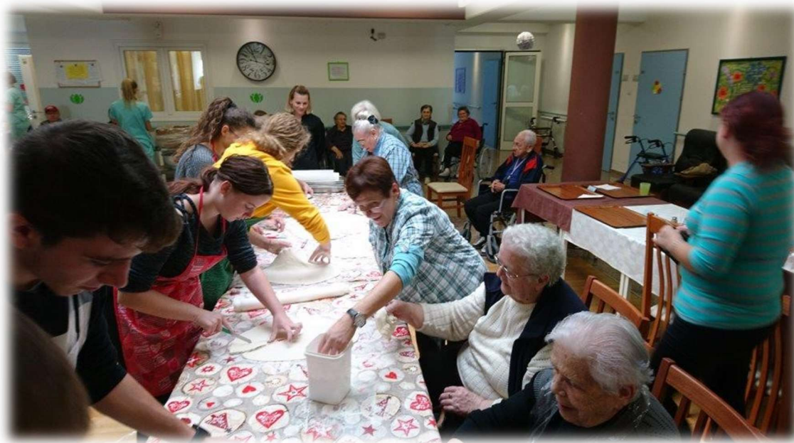
Slika 6.3.3.1. Primjer radne terapije

podići stupanj samostalnosti te tako osobu reintegrirati u društvo te joj pronaći ulogu u kojoj bi se osjećala korisno i produktivno. Radna terapija dogovara se individualno sa bolesnikom prema njegovim željama i potrebama te zdravstvenom stanju [11].