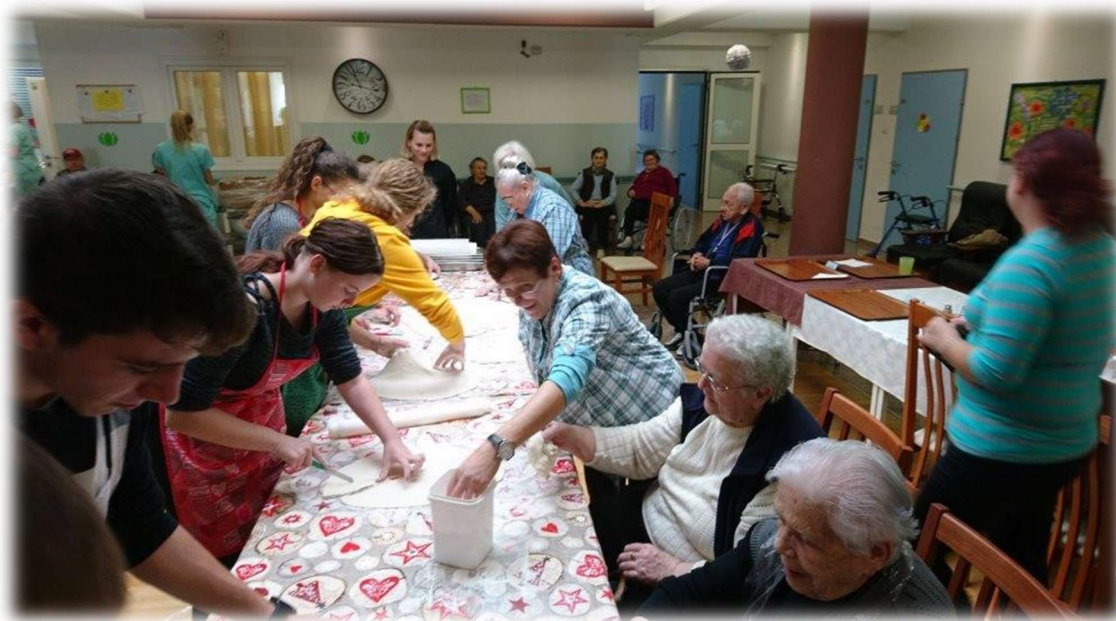
Slika 6.3.3.1. Primjer radne terapije

podići stupanj samostalnosti te tako osobu reintegrirati u društvo te joj pronaći ulogu u kojoj bi se osjećala korisno i produktivno. Radna terapija dogovara se individualno sa bolesnikom prema njegovim željama i potrebama te zdravstvenom stanju [11].