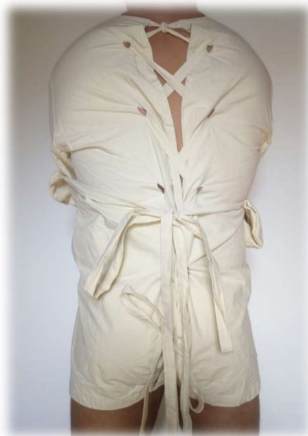
Slika 6.1. Psihijatrijska stezulja