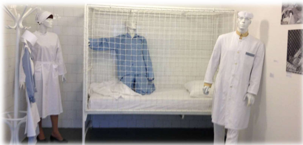
Slika 6.2. Krevet-mreža, nekad se upotrebljavao za izolaciju pacijenata, Muzej psihijatrije Zagreb

Sam postupak sputavanja provodi se po određenim pravilima kod kojih mora biti osiguran dovoljan broj medicinskih djelatnika, poželjno je petero medicinskih tehničara za sputavanje. Postupak treba biti izveden brzo i bez oklijevanja kako bi se izbjegle moguće ozljede samog bolesnika, ali i osoblja. Nakon sputavanja medicinske sestre i tehničari i dalje moraju kontinuirano pratiti bolesnika, njegove vitalne funkcije, održavati higijenu. Također je potrebno sve promjene i vlastita zapažanja bilježiti u određene protokole i sestrinsku dokumentaciju, po potrebi obavijestiti i liječnika [3].