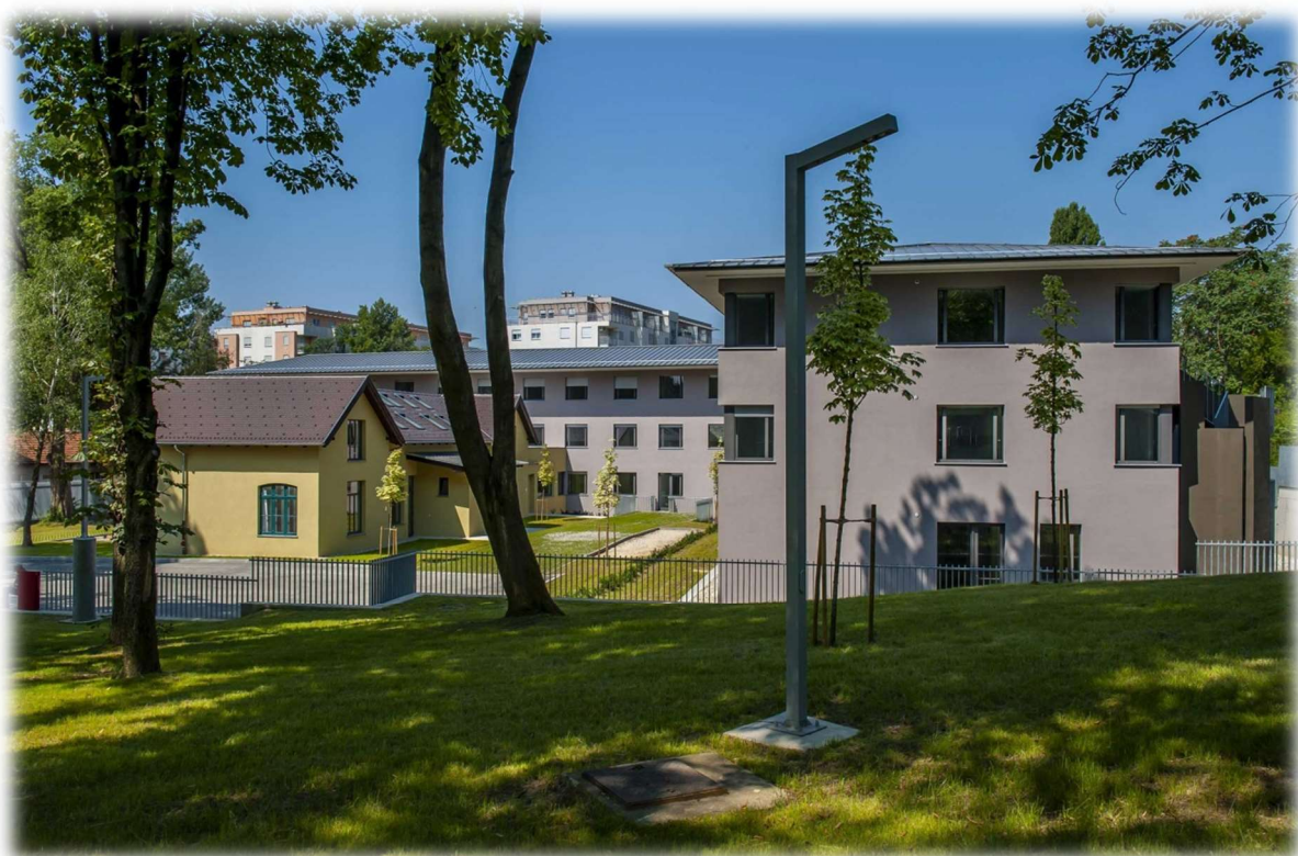
Slika 2.1.2. Zavod za forenzičku psihijatriju, Zagreb

Današnji Zavod za forenzičku psihijatriju izgrađen je 2019. godine i dobio je naziv po dugogodišnjem ravnatelju Klinike za psihijatriju Vrapče, koji je uvelike zaslužan za realizaciju projekta izgradnje stoga zavod nosi upravo i njegovo ime („Zavod za forenzičku psihijatriju Dr. Vlado Jukić“). Zavod broji sedamdeset kreveta koji su podijeljeni na četiri odjeljenja (prijemno-dijagnostički odjel, rehabilitacijski odjel, odjel socioterapije I te odjel socioterapije II). Na bolničkom odjelu osobito na prijemno-dijagnostičkom odjelu pacijente se u prvih mjesec dana prati i liječi te se procjenjuje i postavlja plan za daljnje liječenje [3].