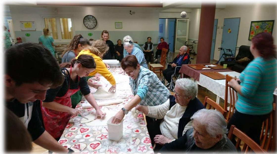
Slika 6.3.3.1. Primjer radne terapije

podići stupanj samostalnosti te tako osobu reintegrirati u društvo te joj pronaći ulogu u kojoj bi se osjećala korisno i produktivno. Radna terapija dogovara se individualno sa bolesnikom prema njegovim željama i potrebama te zdravstvenom stanju [11].