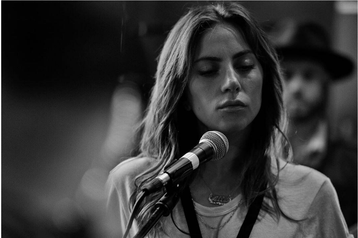
Slika 3.2.6.: Peter Lindbergh, Lady Gaga, Los Angeles, 2017. godina