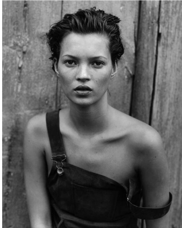
Slika 3.1.2.: Peter Lindbergh, Kate Moss, „Harper’s Bazaar“, New York, 1994. godine

Lindbergh u svoje fotografije unosi dušu i osobnost žene što ga izdvaja od ostalih fotografa. Drastično mijenja standard modne fotografije u kojoj je običaj pretjerano retuširanje i pomlađivanje, stvaranje ideala koji ne postoje. Njegova jedinstvena vizija predstavljala je žene u njihovom čistom stanju, izbjegavajući sve stereotipe jer privilegira lice s gotovo nikakvom šminkom, u ogoljenom obliku koji povećava autentičnost i prirodnu ljepotu njegovih žena. „Tijekom godina stvorio je slike koje su obilježile povijest fotografije, koju karakterizira minimalistički pristup post-modernističke fotografije.“ [7]