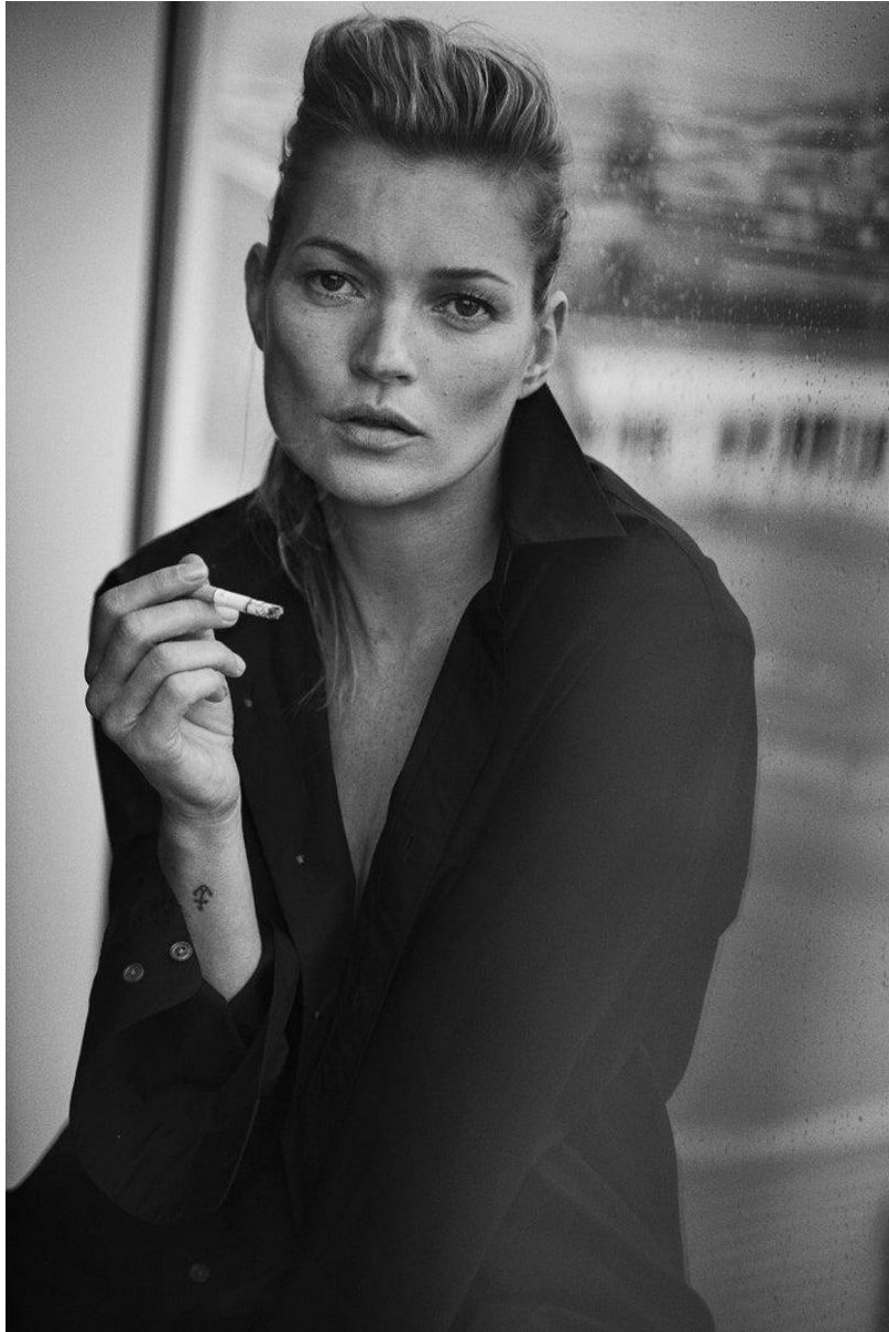
Slika 3.2.5.: Peter Lindbergh, Kate Moss, Pariz, Franciska, 2014. godina