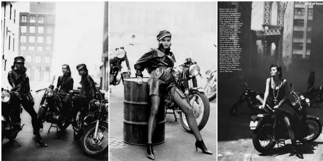
Slika 2.3.1.: Peter Lindbergh, „Wild at Heart“, 1991. godine

Modno-dokumentarna fotografija stil je unutar modne fotografije koji možemo opisati kao fotografija mode koja priča priču. Kod modno-dokumentarne fotografije uvijek govorimo o seriji fotografija. O ovakvom pristupu modnoj fotografiji možemo govoriti još od 40.-ih godina 20.stoljeća kad je Richard Avedon u modnu fotografiju donio trend fotografiranja izvan studija te joj je donio dinamičnost. Takav utjecaj je uvelike doprinio razvoju i imao je veliki utjecaj na fotografe koji su tek dolazili. Avedon je fotografirajući modele u svakodnevnim situacijama u modnu fotografiju uveo dašak dokumentarne fotografije. Jedan od najvećih predstavnika modno-dokumentarne fotografije je Peter Lindbergh. Lindbergh svoje fotografije uvijek fotografira u serijama koje pričaju priču, što je karakteristika dokumentarne fotografije, dok ujedno prikazuje sve što je za modnu fotografiju bitno, od same odječe koja se predstavlja do modela. Ovakav pristup modnoj fotografiji, 90.-ih godina 20.stoljeća, usvojili su i David Sims i Jason Evans.