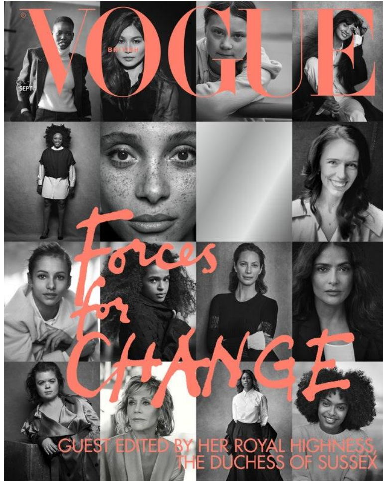
Slika 3.1.3.: Peter Lindbergh, "Forces for Change", Vogue, rujna 2019. godine

Peter Lindbergh preminuo je 3. rujna 2019. godine u Parizu. [6]