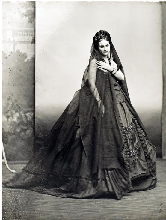
Slika 2.1.1.: Adolphe Braun, grofica Virginija Oldoni, 1856. godine

O razvoju modne fotografije možemo govoriti već sredinom 19. stoljeća kad je 1856. godine Adolphe Braun objavio knjigu od 288 fotografija službene dvorske odjeće koju je nosila grofica od Castiglione Virginija Oldoni što je čini prvim modelom u modi.[1]