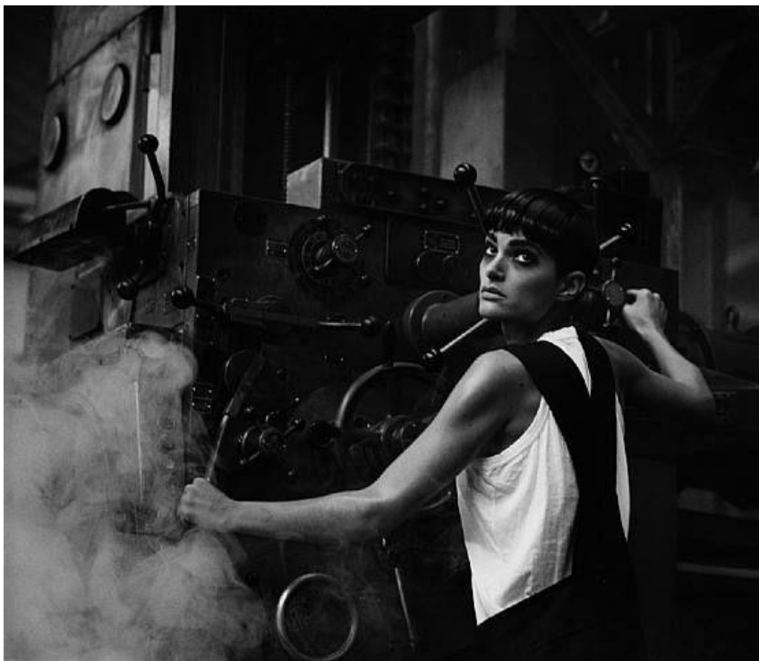
Slika 3.1.1.: Peter Lindbergh, Comme Des Garçons, 1984. godina

Peter Lindbergh svoj stil razvija kroz inspiraciju dokumentarnom fotografijom Dorothee Lange, Henrija Cartier-Bressona i Garryja Winogranda. Njegov stil odiše fotografskim realizmom koji modela stavlja u čista netaknuta stanja, uz minimalnu šminku i ležerno stilizirano izdanje. [8] Lindbergh također svoju inspiraciju crpi iz ranog narativa kina i ulične fotografije. Na oblikovanje njegovog stila uvelike je utjecalo i njegovo podrijetlo te okolina u kojoj je odrastao, industrijski grad sjeverne Njemačke. Njegovo podrijetlo može se vidjeti u oštrom i bezumnom realizmu koji uokviruje žensku ljepotu. [9] „Lindbergh je prvi fotograf koji je u svoju modnu seriju uključio narativ, a njegovo pripovijedanje donosi novu viziju umjetnosti i modne fotografije.“ [7] Stil kojim Lindbergh stvara svoje fotografije može se nazvati modno-dokumentarna fotografija.