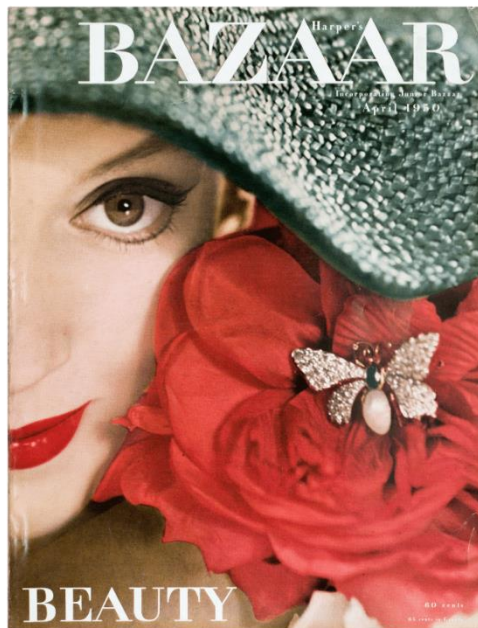
Slika 2.1.2.: Richard Avedon, naslovnica Harper's Bazaar, travanj 1950. godine

Richard Avedon svoju karijeru započinje 1944. godine kao reklamni fotograf. Avedon je također bio i učenik Alexeya Brodovitcha koji je u njemu prepoznao veliki talent te ga je poslao 1946. godine u Pariz da pokrije najnovije kolekcije vodećih modnih dizajnera. Avedon je u modnu fotografiju uveo novi stil. Statične poze koje je kao standard postavio Steichen zamijenio je dinamičnima, također izbjegava studio te preferira raditi na otvorenom. „Snimajući živahne ulične scene i užurbane zabave, njegovi su modeli fotografirani u ovom trenutku, pokazujući svoju prirodnu ženstvenost; lepršava odjeća činila se nekako elegantnim produžetkom vlastitog tijela.“ [2]