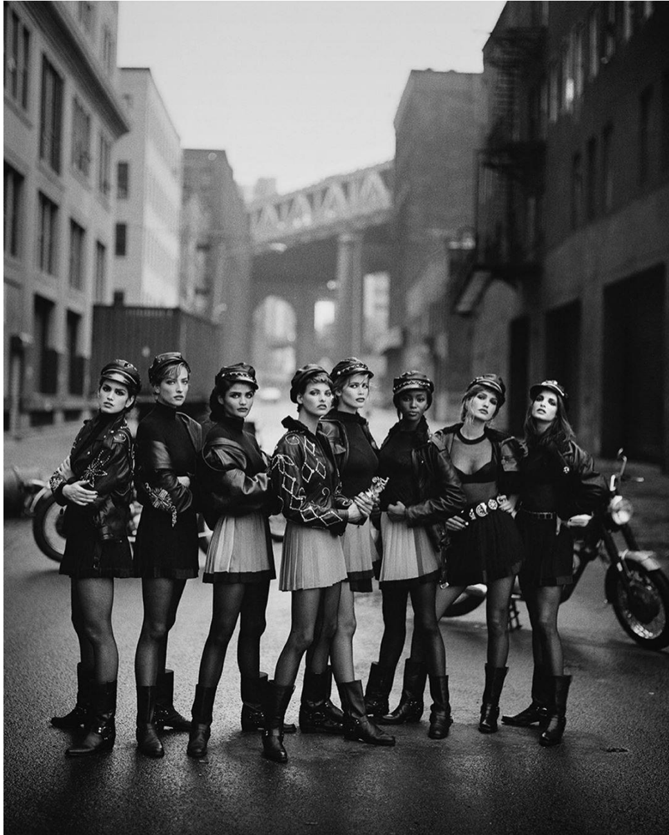
Slika 3.2.4.: Peter Lindbergh, Cindy Crawford, Tatjana Patitz, Helena Christensen, Linda Evangelista, Claudia Schiffer, Naomi Campbell, Karen Mulder, Stephanie Seymour, American Vogue, Brooklyn, New York, 1991. godine