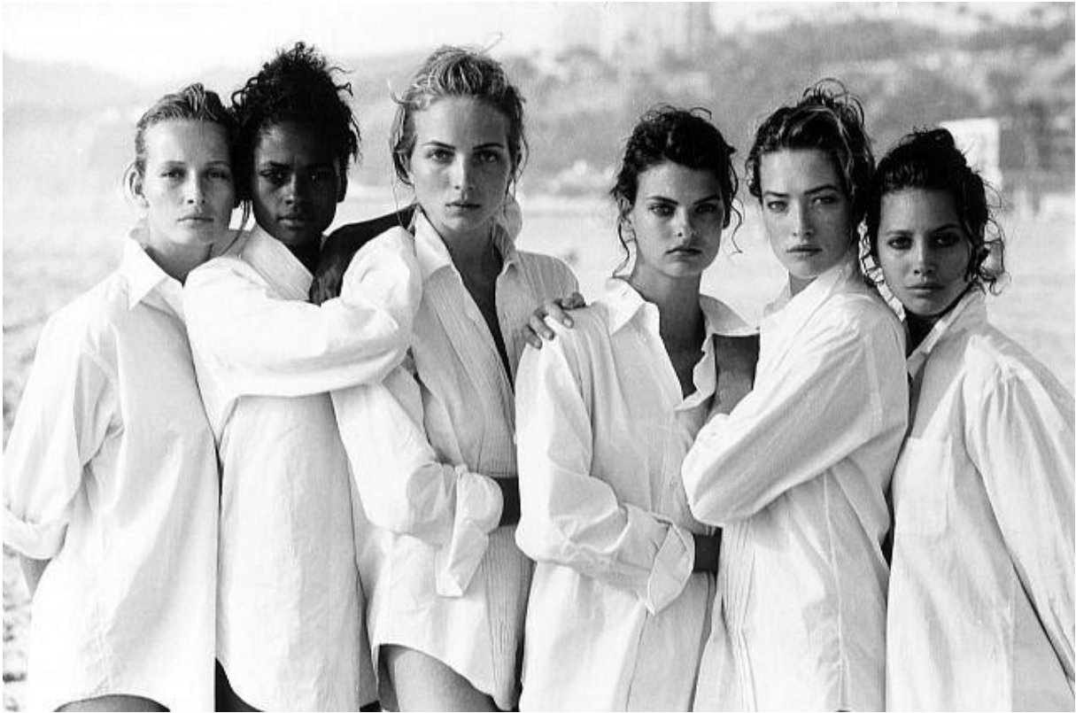
Slika 3.2.1.: Peter Lindbergh, Estelle Lefébure, Karen Alexander, Rachel Williams, Linda Evangelista, Tatjana Patitz, Christy Turlington, Santa Monica, California, SAD, 1988. godine