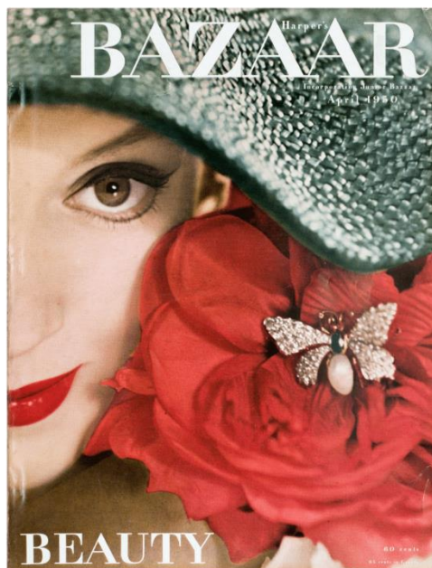
Slika 2.1.2.: Richard Avedon, naslovnica Harper's Bazaar, travanj 1950. godine

Richard Avedon svoju karijeru započinje 1944. godine kao reklamni fotograf. Avedon je također bio i učenik Alexeya Brodovitcha koji je u njemu prepoznao veliki talent te ga je poslao 1946. godine u Pariz da pokrije najnovije kolekcije vodećih modnih dizajnera. Avedon je u modnu fotografiju uveo novi stil. Statične poze koje je kao standard postavio Steichen zamijenio je dinamičnima, također izbjegava studio te preferira raditi na otvorenom. „Snimajući živahne ulične scene i užurbane zabave, njegovi su modeli fotografirani u ovom trenutku, pokazujući svoju prirodnu ženstvenost; lepršava odjeća činila se nekako elegantnim produžetkom vlastitog tijela.“ [2]