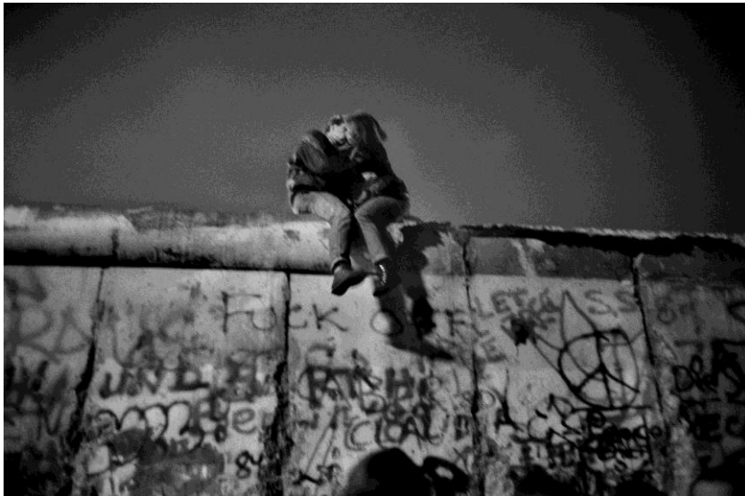
Slika 2.2.2.: Berlin, blizu Branderburških vrata, 1989. godine

dokumentiranja ratnih događanja. Nakon rata fotografi Henri Cartier-Bresson, Robert Capa, George Rodger i David 'Chim' Seymour osnovali su fotografsku agenciju „Magnum“. Agencija je bila osnovana kako bi dokumentirala stvarnost poslijeratnog života. [4]