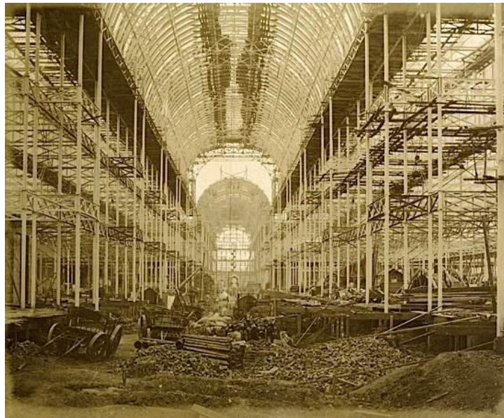
Slika 2.2.1.: Philip Delamotte, „The Nave from the South end“, London, listopad, 1853. godine

Prve primjere dokumentarne fotografije možemo vidjeti još 1853. u seriji fotografija Philipa Delamottea koja je prikazivala demontažu kristalne palače u Londonu. 1861. godine Matthew Brady dokumentirao je američki građanski rat. 1890. godine izašla je publikacija „How the Other Half Lives“ američkog novinara Jacoba Riisa koja je prikazivala siromaštvo u New Yorku. Početkom 20. stoljeća fotografi kao što su Dorotheu Lange i Walkera Evansa zabilježavaju fotografijom slike američkog društva. Takve fotografije sve češće nalazile su se u popularnim američkim časopisima kao što su „Time“, „Vanity Fair“ i „Life“. Pionrom takozvane „društvene dokumentarne fotografije“ smatra se Alfred Stieglitz. [4]