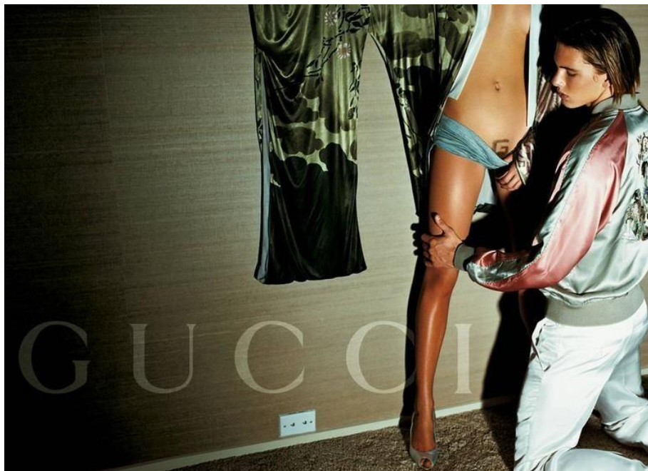
Slika 2.1.3.: Mario Testino, Gucci Kampanja, 2003. godine

Početkom 21.stoljeća u modnoj fotografiji do velikog izražaja dolazila je hiperseksualnost. Bez obzira na etička pitanja koje je 21.stoljeće donosilo, modna fotografija nikad nije izgubila seksualnost i kontroverzu prodaje. Tako je 2003. godine fotograf Mario Testino za „Gucci“ snimio kontroverznu reklamu koja se manje odnosila na odjeću, a više na promociju Guccievog G koji je bio oblikovan stidnim dlakama modela. [3]