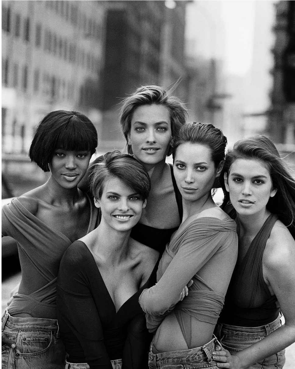
Slika 3.2.2.: Peter Lindbergh, Naomi Campbell, Linda Evangelista, Tatjana Patitz, Christy Turlington and Cindy Crawford, New York, 1989. godine