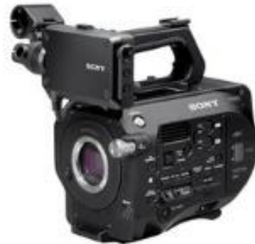
Slika 2.4. Kamera Sony FS7