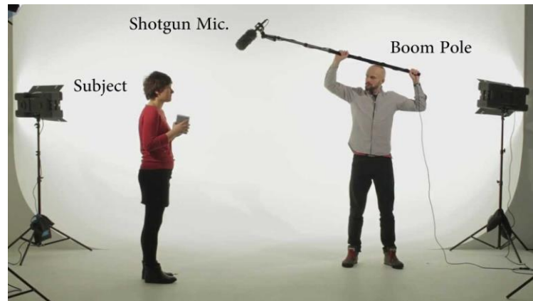
Slika 2.8. Primjer pravilnog snimanja zvuka