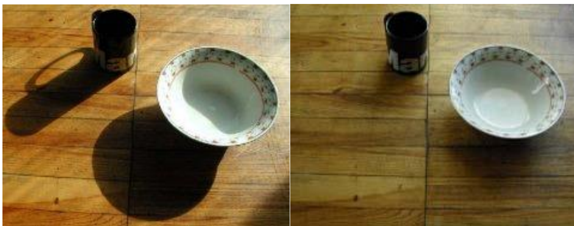
Slika 2.7. Razlika između sunčevog i mekog svjetla [3]

Kvaliteta svjetla zavisi o veličini izvora svjetla. Što je izvor svjetla manji, svjetlo je tvrđe. Što je izvor svjetla veći, svjetlo je mekše. [3]