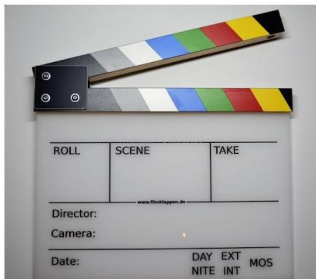
Slika 2.2. Filmska klapa

Klapa se koristi za usklađivanje slike i zvuka u montaži. Postoje digitalne i obične klapa. Na snimci se vidi trenutak kada je klapa lupljena, a na zvučnom zapisu čujemo kada se to dogodilo, obilježi se početak i sve ostalo će biti usklađeno.