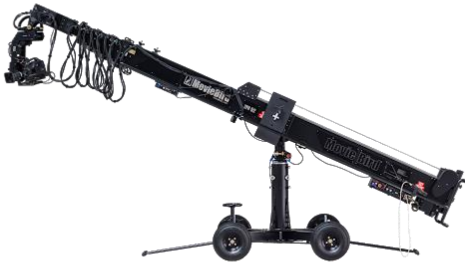
Slika 2.5. Kran (eng. crane)

Ista stvar vrijedi i s montažom i upravljanjem cranea .