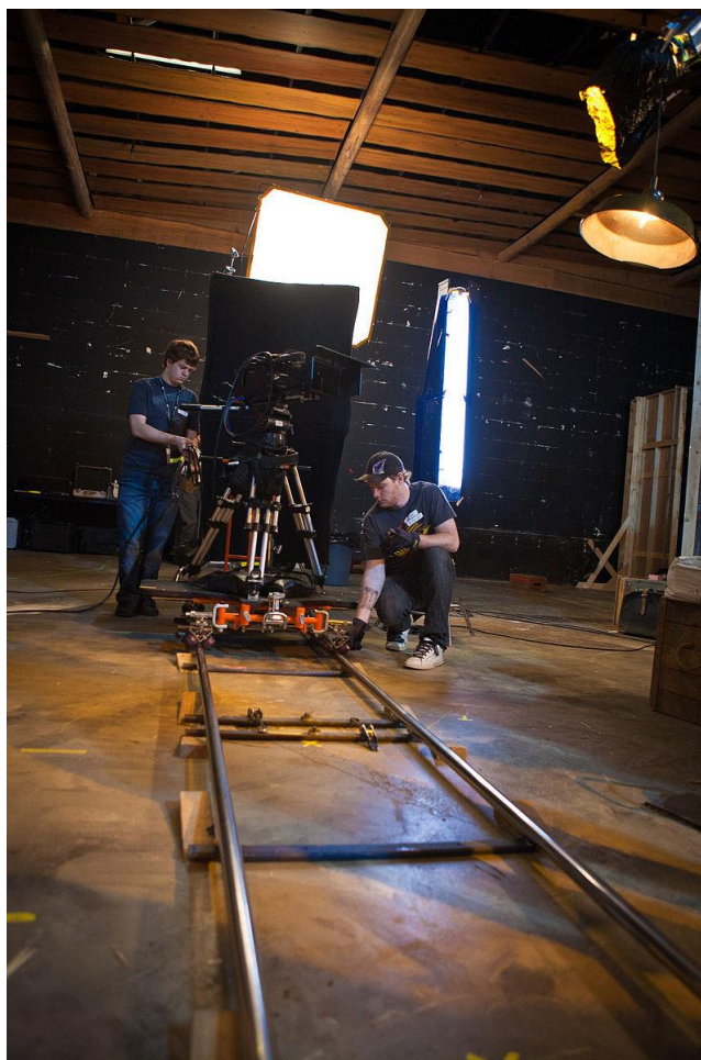
Slika 2.6. Postavljanje tračnica (eng. dollya)