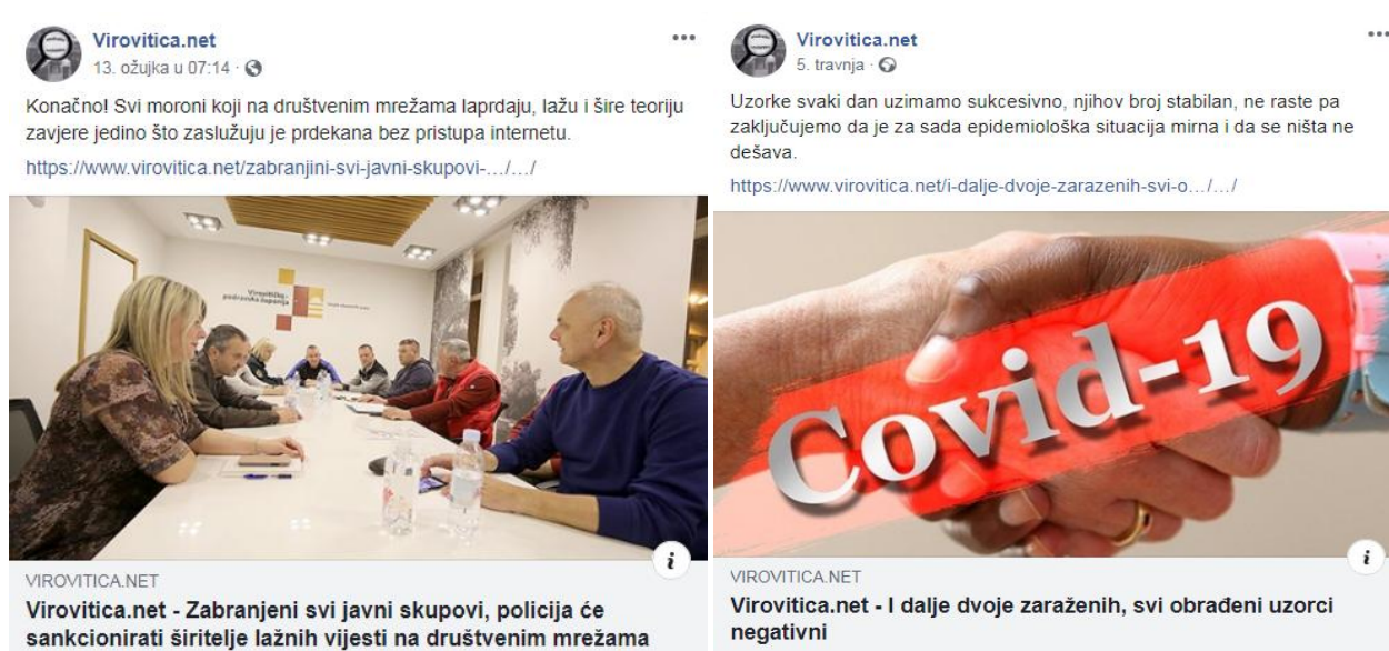
Slika 4.2.2. Izražavanje u najavi teksta na portalu Virovitica.net