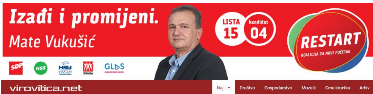
Slika 4.2. Zaglavlje portala Virovitica.net uoči parlamentarnih izbora u Hrvatskoj 5. 7. 2020.