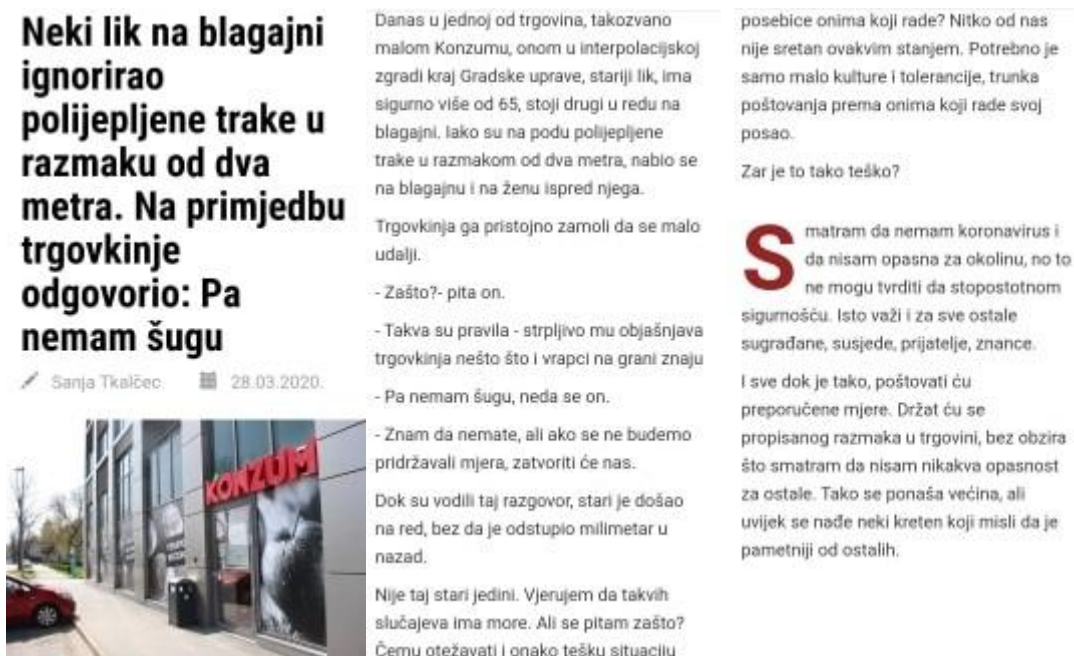
Slika 4.2.1. Tekst na portalu Virovitica.net