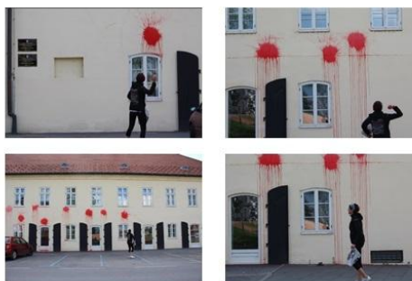
Slike 5.1. Icv.hr i Virovitica.net o uništavanju fasade Palače Pejačević

boja koju je koristila za ovo "oslikavanje" je obična tempera koju koriste učenici za potrebe nastave likovnog odgoja.