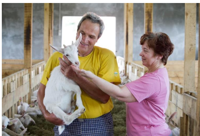
Slika 2. Obiteljsko poljoprivredno gospodarstvo „Moravec“