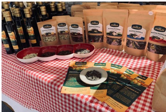
Slika 4. Proizvodi OPG-a „Harači“