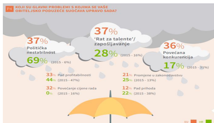
Slika 1. Najveći problemi europskih i hrvatskih obiteljskih poduzeća 2016. godine

Peto izdanje Europskog barometra obiteljskih poduzeća omogućilo je uvid u realno stanje obiteljskih poduzeća na području Europske unije i Republike Hrvatske u 2016. godini. Prema prethodno navedenom istraživanju, Zajednica europskih obiteljskih poduzeća i dalje ima pozitivan stav o budućnosti, čak 72 % europskih ispitanika kaže da se osjeća sigurno ili vrlo sigurno u svoje gospodarske izglede u narednih 12 mjeseci (kroz 2017. godinu). Najveći problemi s kojima se suočavaju europska i hrvatska poduzetništva prikazana su sljedećom slikom (EOP i KMPG, 2016).