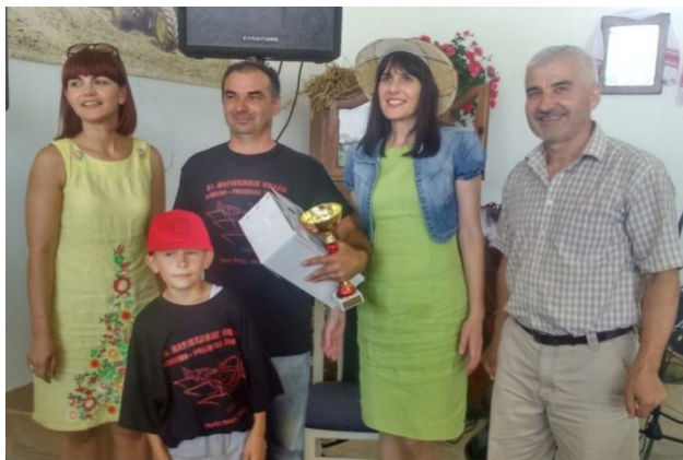
Slika 3. Obiteljsko poljoprivredno gospodarstvo „Brkanac“