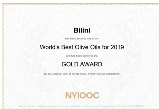
Slika 11. Priznanje OPG-u „Rakovac“