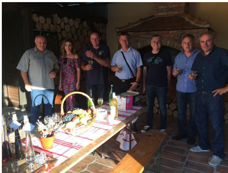
Slika 5. Obiteljsko poljoprivredno gospodarstvo „Gašpić“