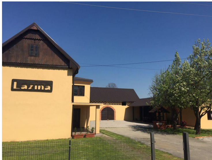
Slika 6. Kuća za odmor OPG-a „Gašpić“