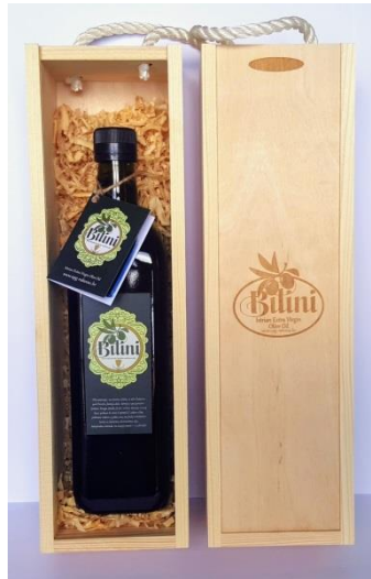
Slika 10. Maslinovo ulje OPG-a „Rakovac“