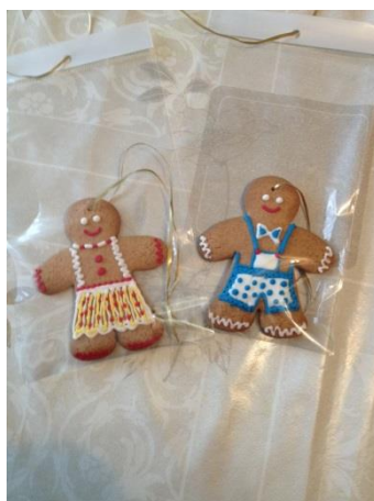
Slika 12. Medenjaci OPG-a „Marijan Hrženjak“

Obiteljsko poljoprivredno gospodarstvo „Marijan Hrženjak“ bavi se pčelarstvom od 2003. godine, a čine ga supružnici Nada i Marijan te kćeri Ana i Mirjana. Bave se proizvodnjom meda i različitih proizvoda od meda kao što su paprenjaci ili medenjaci, a dobitnici su certifikata „Med iz Lijepe Naše“. Ovaj OPG ulaže mnogo kreativne energije u stvaranje modernijih proizvoda od meda ( http://www.opg-hrzenjak.hr/ ).