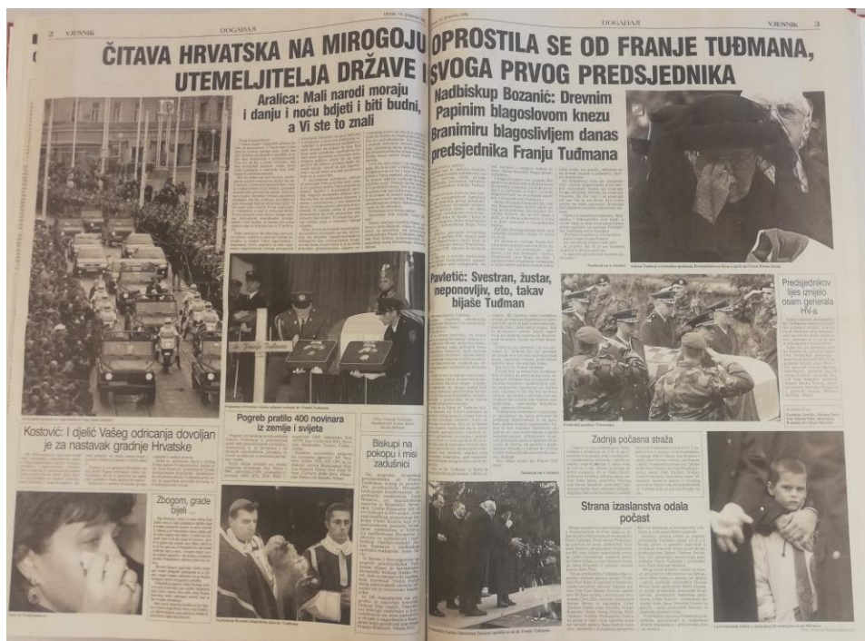
Slika 3.6. Druga i treća stranica Vjesnika 14. prosinca 1999.