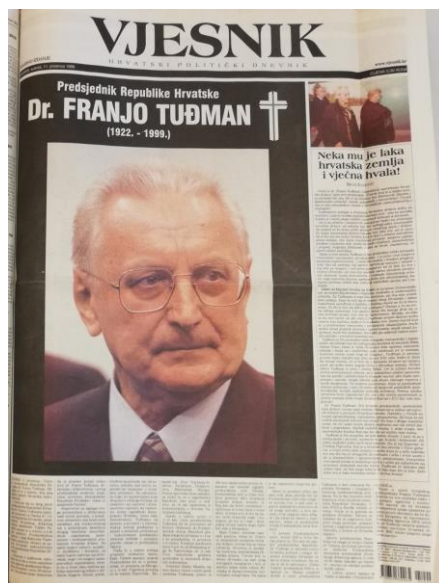
Slika 3.1. Naslovna strana posebnog izdanja Vjesnika 11. prosinca 1999.