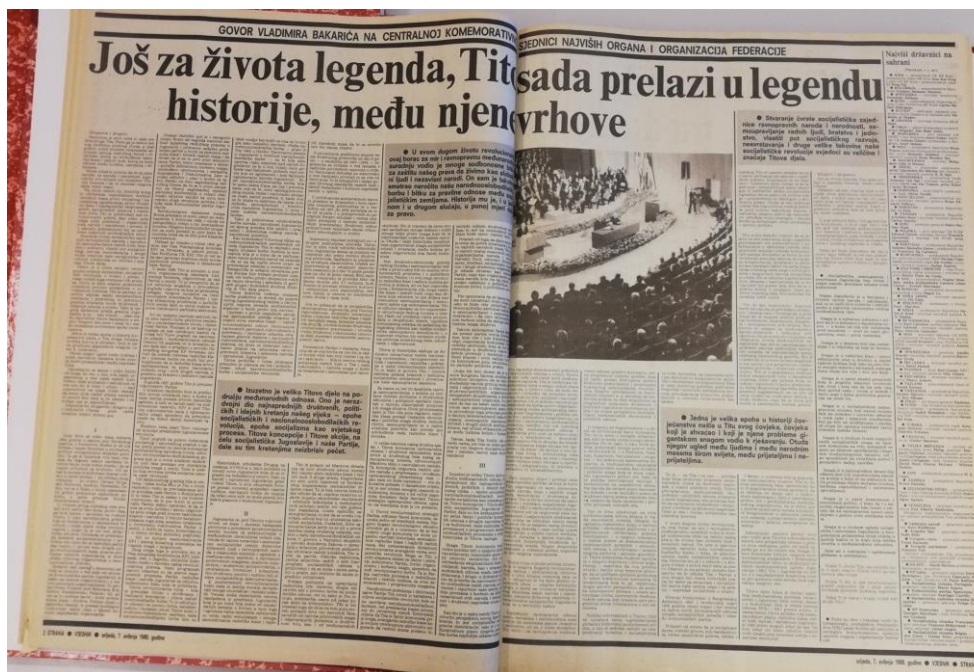
Slika 2.5. Druga i treća stranica Vjesnika 7. svibnja 1980.