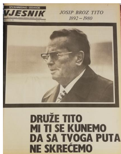
Slika 2.7. Naslovna strana izvanrednog izdanja Vjesnika 9. svibnja 1980.

U Vjesniku od 9. svibnja, koji i nadalje ima formu izvanrednog izdanja, na prvoj se stranici nalazi Titova crno bijela fotografija te naslov „Druže Tito mi ti se kunemo da sa tvoga puta ne skrećemo“.