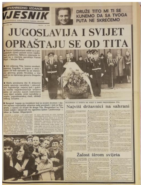
Slika 2.3. Naslovna strana Vjesnika 6. svibnja 1980.

Vjesnik 6. svibnja 1980. donosi veliki naslov „Jugoslavija i svijet opraštaju se od Tita“, a nepotpisani tekst govori kako su Zagrepčani primili vijest o smrti predsjednika. Pod naslovom „Žalosti širom svijeta“ objavljen je popis zemalja koje su proglasile dane žalosti, dok je pod naslovom „Najviši državnici na sahrani“ objavljen popis državnika koji će prisustvovati Titovom pogrebu, što je opet preuzeto iz Tanjuga . Na prvoj stranici, što je bio već viđeni motiv, nalazila se i fotografija Titovog lijesa i stražara.