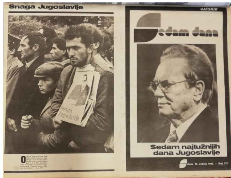
Slika 2.8. Izdanje Vjesnika „Sedam najtužnijih dana Jugoslavije“

nazvano „Sedam najtužnijih dana Jugoslavije“ u kojemu je napravljen presjek proteklih sedam dana u Jugoslaviji, uz mnoštvo fotografija.