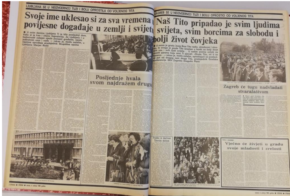
Slika 2.4. Treća i četvrta stranica Vjesnika 6. svibnja 1980.

nalaze se i naslovi „Zagreb će tugu nadvladati stvaralaštvom“ i, također vezan uz Titove zagrebačke godine, „Vječno će živjeti u gradu svoje mladosti i zrelosti“, kojima je opisana komemoracija u Zagrebu. Na trećoj stranici nalaze se i fotografije Zagrepčana na komemoraciji za predsjednika Tita.