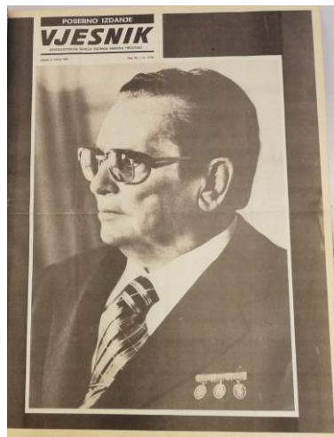
Slika 2.1. Naslovna strana Vjesnika 5. svibnja 1980.

Dan poslije Titove smrti, 5. svibnja 1980., što je bio broj 11.742 toga dnevnika, izašlo je Posebno izdanje Vjesnika . Na naslovnoj stranici nalazila se, u crnom okviru, velika crno-bijela fotografija Tita.