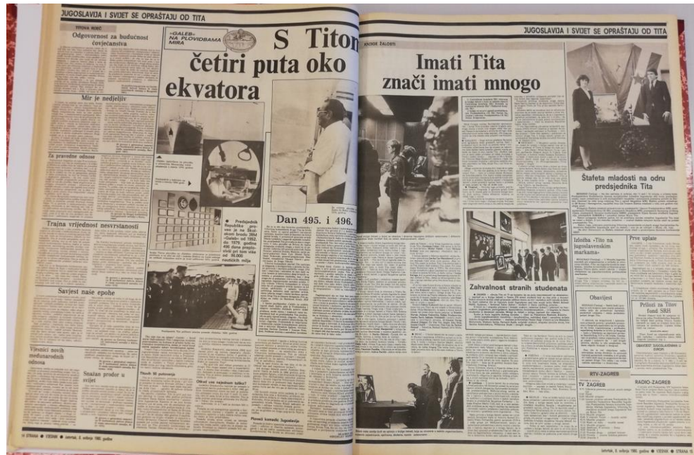
Slika 2.6. 14. i 15. strana Vjesnika 8. svibnja 1980.

u Beogradu, naslovljeno „Susreti s državicima“. Naslovom „Vijenci za velikana“ opisano je polaganje vijenaca svjetskih državnika. Obje vijesti prenesene su iz Tanjuga . Na 12. i 13. stranici stoje Titove izjave, nazvane „Titova riječ“. U tekstu na 14. stranici, naslovljenom „S Titom četiri puta oko ekvatora“, opisana su Titova putovanja vlastitim brodom. Na kraju se nalazi popis najviših državnika koji su pristigli u Beograd.