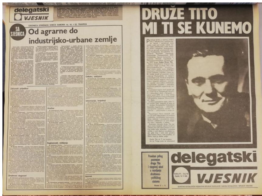
Slika 2.9. Poseban prilog Vjesnika 14. svibnja 1980.

Dana 14. svibnja 1980. Vjesnik objavljuje poseban prilog posvećen Titu na pet stranica „Druže Tito mi ti se kunemo“.