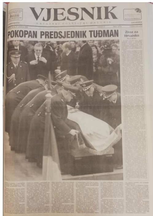
Slika 3.5. Naslovna strana Vjesnika 14. prosinca 1999.

Dana 14. prosinca 1999. u Vjesniku su objavljene vijesti s predsjednikova pogreba. Na prvoj stranici nalazila se fotografija u trenutku spuštanja lijesa u grob te tekst naslovljen „Pokopan predsjednik Tuđman“. Uslijedio je tekst Marka Barišića „Život za Hrvatsku“.