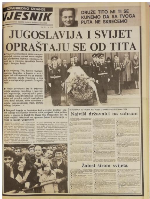
Slika 2.3. Naslovna strana Vjesnika 6. svibnja 1980.

Vjesnik 6. svibnja 1980. donosi veliki naslov „Jugoslavija i svijet opraštaju se od Tita“, a nepotpisani tekst govori kako su Zagrepčani primili vijest o smrti predsjednika. Pod naslovom „Žalosti širom svijeta“ objavljen je popis zemalja koje su proglasile dane žalosti, dok je pod naslovom „Najviši državnici na sahrani“ objavljen popis državnika koji će prisustvovati Titovom pogrebu, što je opet preuzeto iz Tanjuga . Na prvoj stranici, što je bio već viđeni motiv, nalazila se i fotografija Titovog lijesa i stražara.