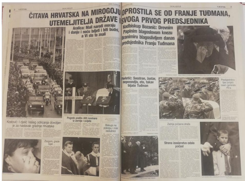
Slika 3.6. Druga i treća stranica Vjesnika 14. prosinca 1999.