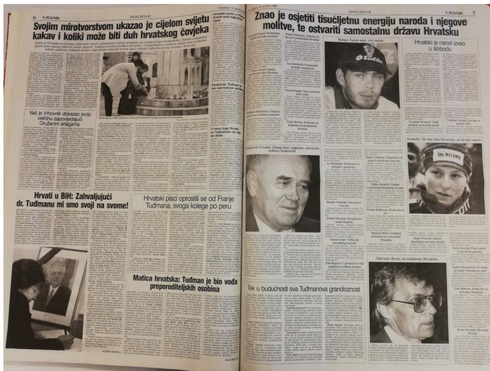
Slika 3.4. Šesta i sedma stranica Vjesnika 13. prosinca 1999.