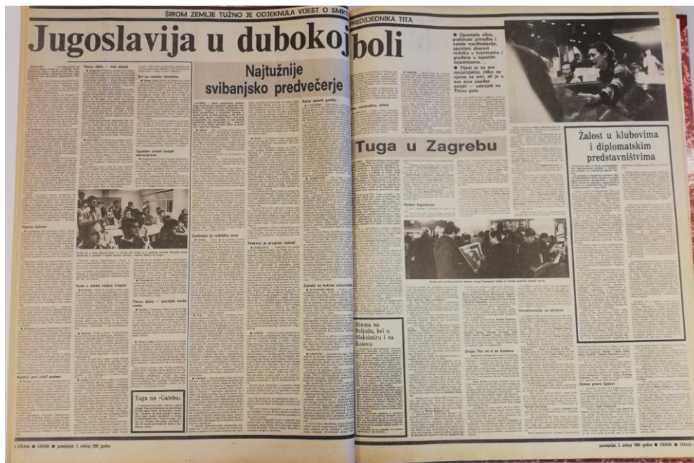
Slika 2.2. Osma i deveta stranica posebnog izdanja Vjesnika 5. svibnja 1980.

izdanja novina“. Na istoj je stranici pod naslovom „Žalost u klubovima i diplomatskim predstavništvima“, donesen pregled reakcija građana Jugoslavije u inozemstvu na Titovu smrt. Tekst naslovljen „Himna na Poljudu, bol u Maksimiru i na Koševu“ govori što se događalo na nogometnim igralištima neposredno nakon objave vijesti o Titovoj smrti.