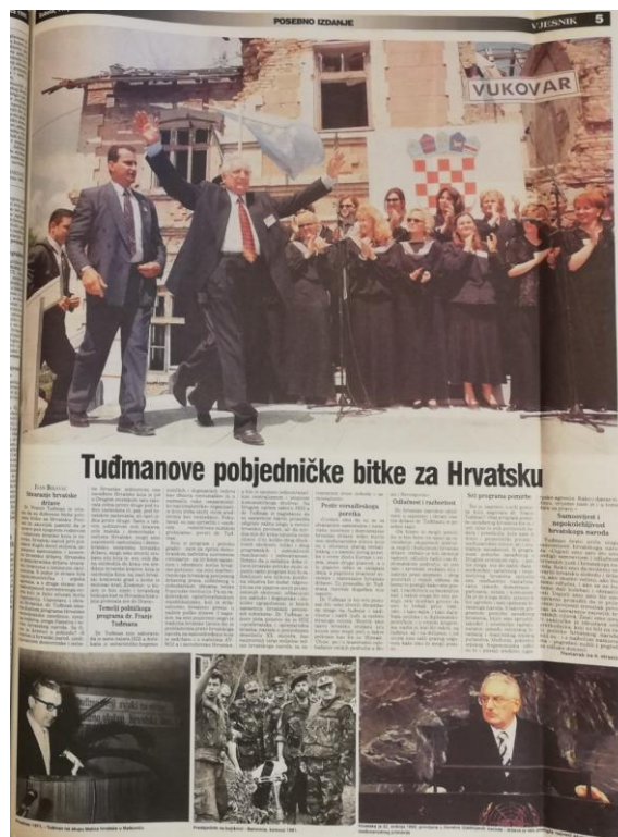
Slika 3.2. Peta stranica posebnog izdanja Vjesnika 11. prosinca 1999.