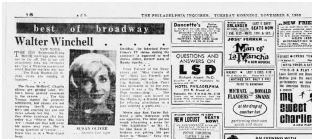
Slika 3.4.4. Kolumna Waltera Winchella

To je samo primjer javnog zanimanja za seksualni život slavnih koji se nije pojavio tada u tim okolnostima, već je postojao vjerojatno oduvijek: McNair spominje primjere novinskih članaka iz 18. stoljeća koji razotkrivaju skandalozne ljubavne veze aristokracije Europe, a iz samih početaka „žutog novinarstva“ iz 1920-ih godina spominje trač-kolumnu novinara Waltera Winchella u kojima se pozivao na „demokratizirajuću moć razotkrivanja elite“ (McNair 2004: 107).