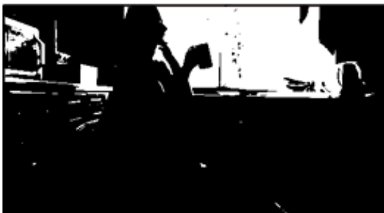
Nastavak kadra 1.3.1

Kadar se snima odjednom u pokretu gimbal prati nju od stavljanja džezve pa sve do sjedanja za stolac i ispijanja kave