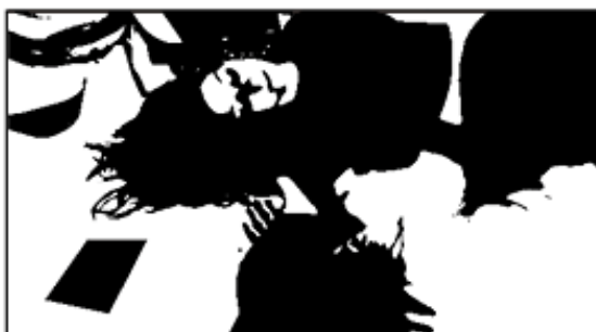
Nastavak kadra i njegov ulaz u kadar

Ona lezi na podu i ruka pada u lokvu krvi pored kuverte, on ulazi u kadar i klekne na pod pored nje