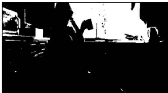
Nastavak kadra 1.3.1

Kadar se snima odjednom u pokretu gimbal prati nju od stavljanja džezve pa sve do sjedanja za stolac i ispijanja kave