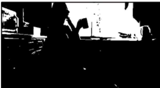
Nastavak kadra 1.3.1

Kadar se snima odjednom u pokretu gimbal prati nju od stavljanja džezve pa sve do sjedanja za stolac i ispijanja kave