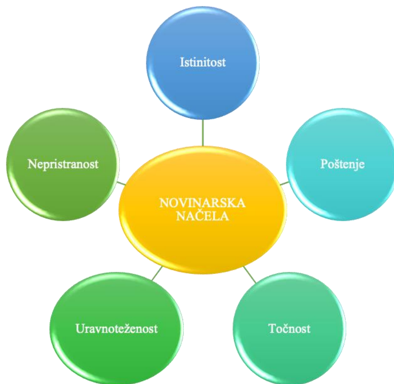
Slika 3.1. Novinarska načela 2

Svaka pojedina informacija koja će biti plasirana mora prije svega biti istinita. Ukoliko se informacija pokaže neistinitom, tada se ista ne može smatrati nikakvom viješću. Malović tumači kako se novinarstvo prije svega temelji na informiranju o različitim činjenicama koje su se dogodile. Ukoliko te iste činjenice nisu istinite, tada ne postoji pravo novinarstvo (Malović 2005:19).