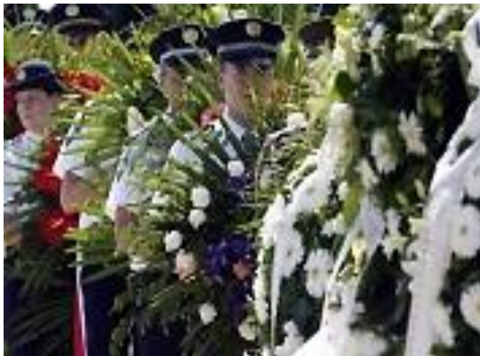
Slika 7: Nosači vijenaca