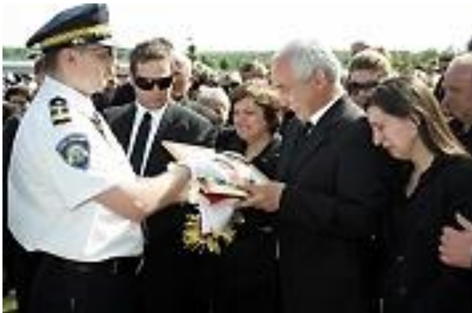
Slika 14: Predaja zastave i slike obitelji pokojnika