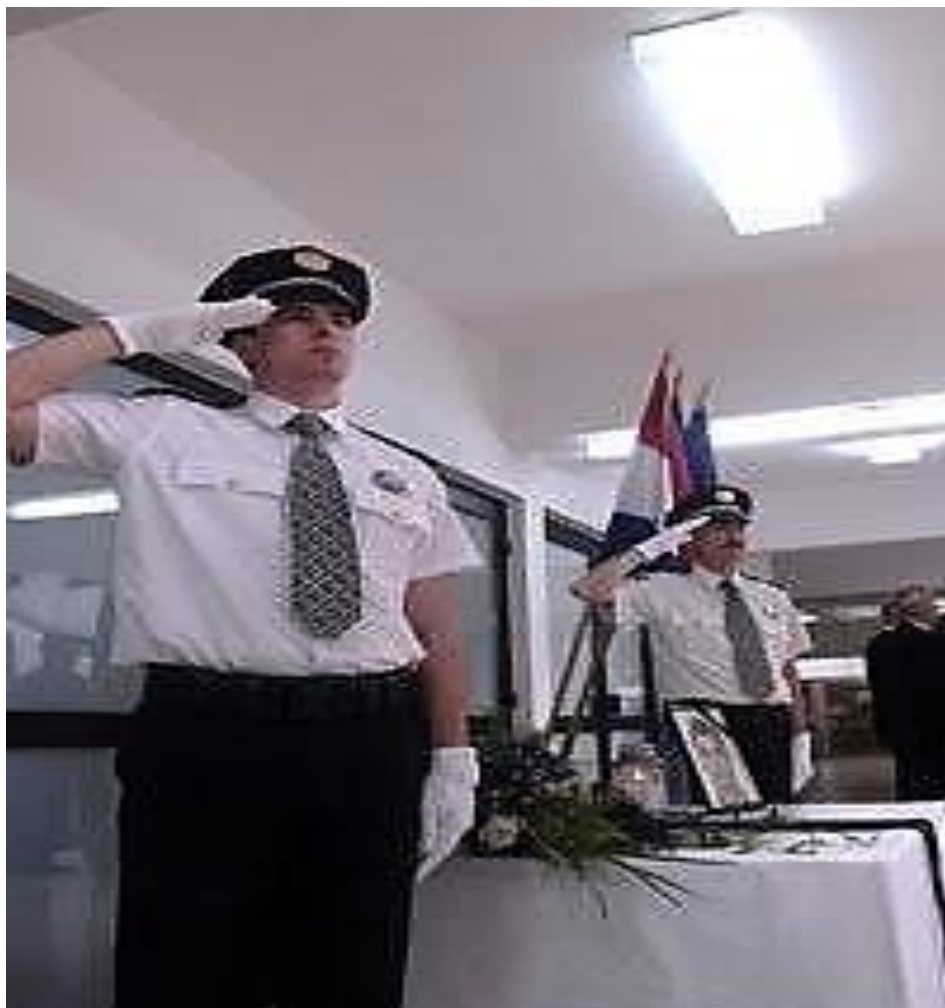
Slika 16: Prikaz centralnog mjesta komemoracije