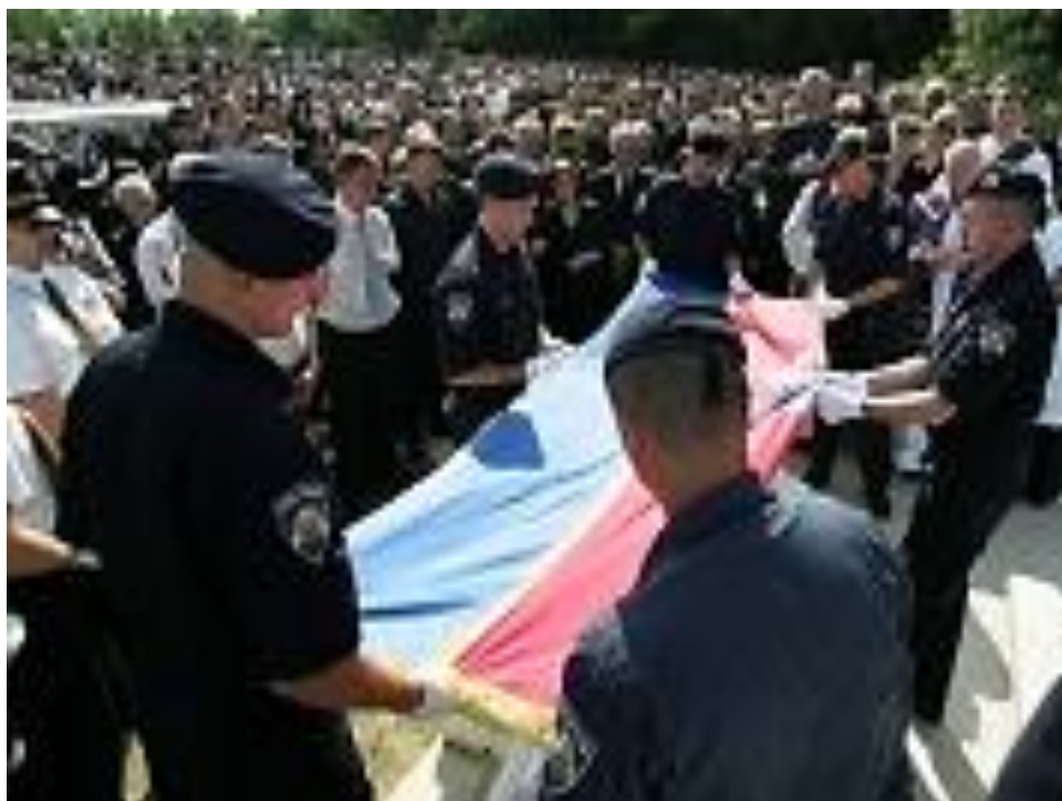
Slika 13: Skidanje zastave sa lijesa