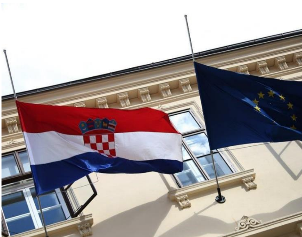
Slika 11: Primjer zastave na pola stijega

Poginuli policijski službenik ima pravo na odavanje posmrtno časti. Na službene prostorije Ministarstva diže se crna zastava, a ako je došlo do proglašenja dana žalosti, uz dignutu crnu zastavu, državna zastava spušta se na pola stijega. Prema Heimeru 2008 točno je definiran protokol podizanja zastave kod dana žalosti. Prvotno se zastava ističe na pola stijega da se prvo istakne do njegova vrha, potom slijede uobičajene počasti: ustajanje, pozdravljanje, izvođenje himne RH, a zatim se spušta za visinu najmanje jedne širine zastave, ali ne više od dvije.