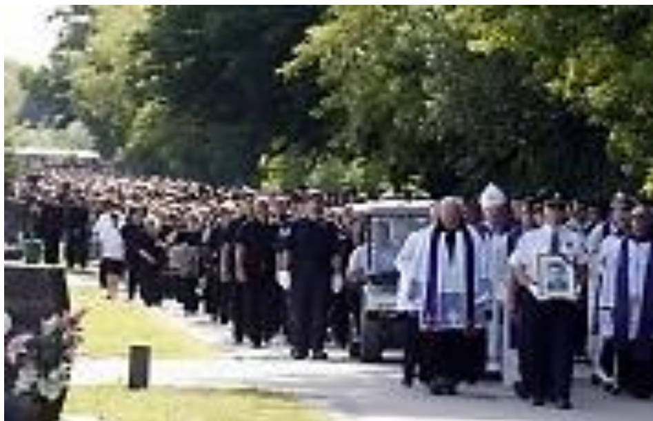
Slika 9: Lijes pokojnog Ivana Grbavca i počasna straža koja korača uz lijes