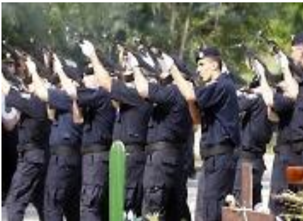
Slika 15: Počasno pucanje

Primjer počasnog pucanja vidljiv je na slici 15.