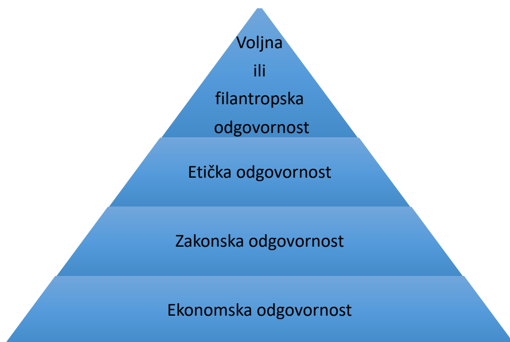
Slika 4. Carrollova piramida društvene odgovornosti

I zato je društvena odgovornost obaveza svih koji posluju da uz cilj povećavanja profita povećavaju i pozitivan utjecaj svog poslovanja na društvo.