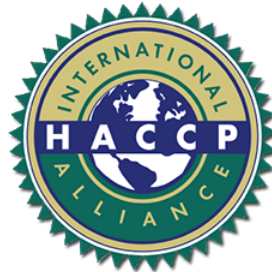
Slika 1: HACCP logo, međunarodni