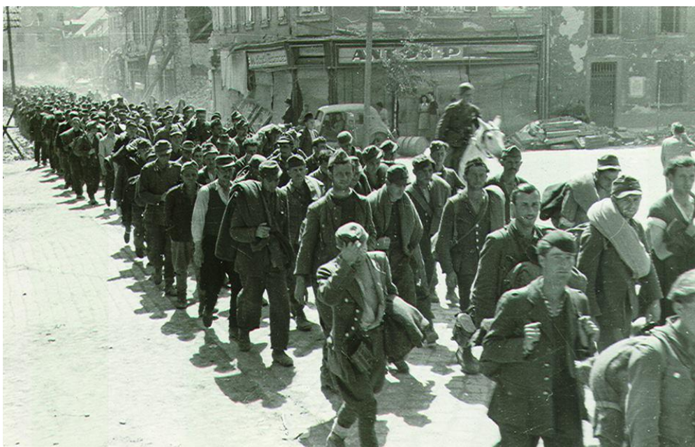
Slika 2.1. Križni put, http://kamenjar.com/wp-content/uploads/2015/04/bleiburg-kri%C5%BEni-put-kamenjar.jpg , pristupljeno 23. 09. 2015.

Prvih dana nakon dolaska partizanskih jedinica u Zagreb, preostale vlasti NDH zajedno s civilima krenuli su na dug i mukotrpan put prema Austriji gdje su se nadali predati Britancima od kojih su očekivali lakšu kaznu nego od partizana. Ostalim ustašama, domobranima i vojnicima put je bio naređen. Koloni se pridružio i velik broj njemačkih vojnika. Točan broj ljudi u koloni nije točno poznat (dijelom zbog tog što su komunističke vlasti šutjele o tom), a procjene idu do 130 000 ljudi. Oni koji su uspjeli doći do austrijskog Bleiburga nisu bili primljeni od strane britanske vojske zbog britanskog sporazuma s jugoslavenskim jedinicama o neprimanju izbjeglica. Jugoslavenske trupe su pomno isplanirale cijeli put i zarobljenici su bili samo u njihovim rukama. Partizani su zarobili i odveli u zatvore i logore na tisuće ljudi, a neki su pobijeni. Preživjeli su se raštrkali u svim smjerovima po čitavoj Jugoslaviji. Predviđa se da je ukupno tokom cijelog puta, te na njegovom završetku poginulo oko 30 i 40 tisuća domobrana i ustaša. 46