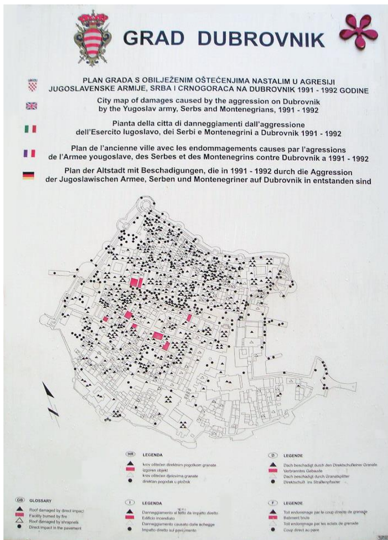
Slika 2: Oštećenja nastala tijekom opsade Dubrovnika (stari grad)