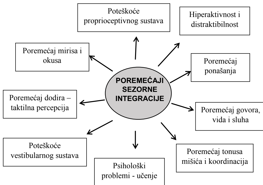
Slika 2. Poremećaji senzorne integracije

Poremećaj senzorne integracije možemo definirati kao disfunkciju mozga da obrađuje ili organizira tijek senzornih impulsa na onaj način koji je pojedincu potreban kako bi mogao imati dobru, preciznu informaciju o sebi i svojoj okolini. Također, navedena disfunkcija odražava se i na ponašanje, učenje [1]. Poremećaj, odnosno teškoće se javljaju kada je mozgu otežano primanje, obrada te integriranje različitih osjetila. Što znači, da je živčani sustav previše podražen i nema mogućnost povezivanja svih senzornih unosa. Teškoće se također mogu javiti ukoliko mozak djeteta prima premalo informacija ili ako ih prima nepravilnim redoslijedom. Oblici teškoća iz spektra senzorne integracije prikazani su na slici 2.