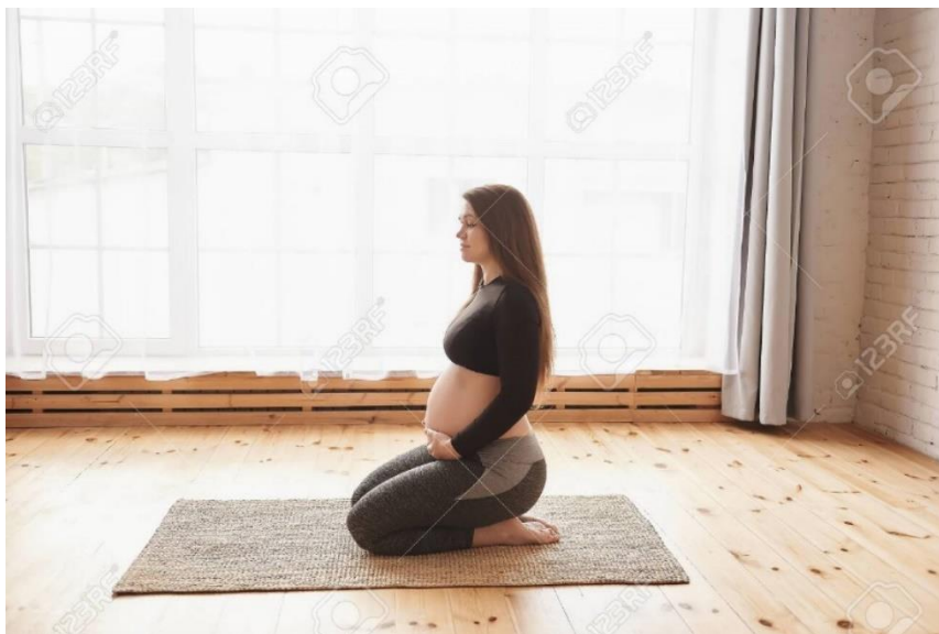
Slika 5.10 Početni položaj bočnog skleka u sjedećem položaju

Vježba kontrolira područje zdjelice uz jačanje mišića ramenog pojasa [9]. Trudnica sjedi s jednom nogom savinutom u koljenu, a drugom ispruženom (Slika 5.10). Izdišući trudnica se nagnje na desnu stranu prema naprijed prema podu. Udišući, vraća se u početni položaj. Vježbu je potrebno izvesti nekoliko puta na jednu stranu te nekoliko puta na drugu stranu. Trudnicama koje imaju velik razmak između trbušnih ne preporuča se izvođenje navedene vježbe.