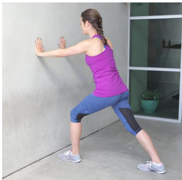
Slika 5.5 Vježba istezanja nogu unatrag