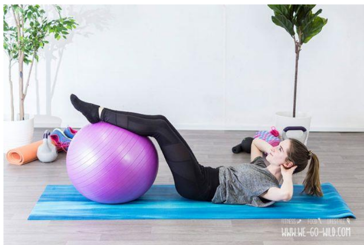
Slika 5.6 Trbušnjaci s loptom

Vježba se može izvoditi na tri različita načina od kojih će biti prikazan jedan primjer, svaki način jača drugo područje abdomena [9]. U sve tri varijante početni položaj je isti. Trudnica leži na leđima uz savijena koljena i potkoljenice položene na lopti ili stolici, a ispod glave nalazi se jastuk (slika 5.6). Ruke drži savinute na potiljku, glavu podiže prema trbuhu i prsnom košu. U isto vrijeme lijevim koljenom pokušava dotaknuti lijevi lakat. Nadlakticu i lakat desne ruke cijelo vrijeme drži na podu oslanjajući se na nju. Za vrijeme podizanja trudnica izvodi izdisaj, dok za vrijeme spuštanja izvodi udisaj. Navedenu vježbu trebaju izbjegavati sve trudnice kod kojih je razmak između trbušnih mišića veći od 2 cm [9]. Tijekom izvođenja vježbe donji dio leđa mora biti na podu te se vježba izvodi naizmjenice na jednu i drugu stranu.