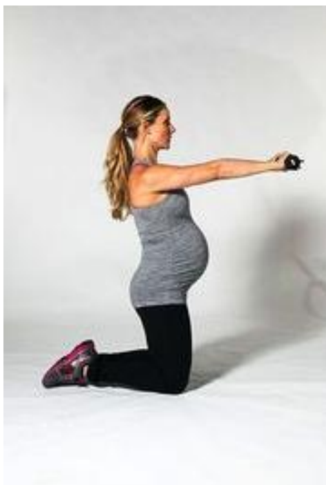
Slika 5.15 Dizanje iz klečećeg položaja