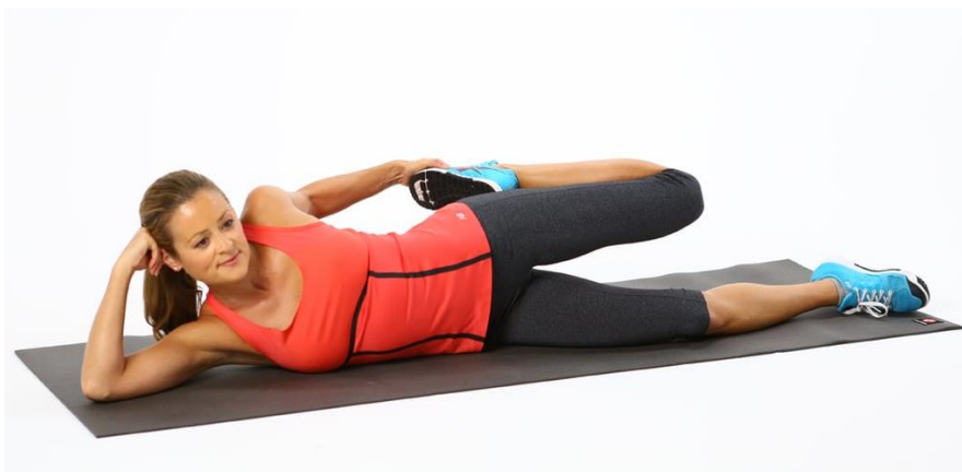
Slika 5.16 Istezanje natkoljениčnog mišića

Vježbom se podupire bolja kontrola zdjelice i isteže natkoljениčni mišić [13]. Trudnica zauzima ležeći položaj na boku gdje gornju nogu drži savijenu (Slika 5.16). Gornjom rukom obuhvaća područje iznad gležnja i udiše. Izdisajem vuče savijenu nogu u smjernu prema natrag i osjeća istezanje natkoljениčnog mišića. Položaj zadržava 8 sekundi nakon čega slijedi opuštanje. Vježbu je potrebno ponoviti nekoliko puta na drugom boku. Važno je obraćati pažnju na izbjegavanje promjene položaja bočnog dijela zdjelice i trupa.