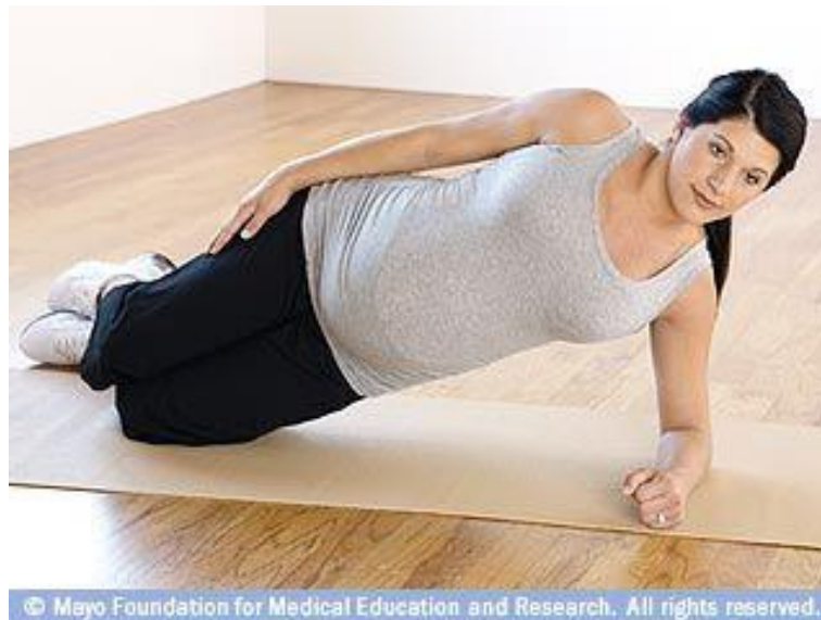
Slika 5.9 Početni položaj vježbe „Oslonac na podlaktice i nagib naprijed“

Vježba oslonca na podlaktice rasterećuje zdjelični pojas [9]. Za početni početni položaj uzima se sjedeći na potkoljenicama (Slika 5.9). Trudnica pokušava ispružiti ruke oslanjajući se podlakticama i šakama na pod. Pogled je usmjeren prema naprijed uz blago pomicanje zdjelice kružno i naprijed-natrag.