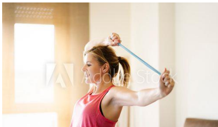
Slika 5.18 Vježba za ruke

Vježbe se mogu izvoditi u sjedećem ili stojećem položaju (Slika 5.18). Trudnicama se preporuča turski sjed koji se pogodan za pokretanje zdjelice te opuštanje i istezanje prepona. Važno je obratiti pažnju na pravilno držanje kojim se jačaju leđni mišići [13]. Početni položaj je sjedeći ili stojeći uz što pravilnije držanje. Koljena moraju biti blago savinuta ili opuštena na podlozi. Trudnica uzima elastičnu traku, ručnik ili najlonke koje čvrsto obuhvaća šakama. Podiže ruke na način da su postavljene u obliku slova „U“. Čvrsto rasteže elastičnu traku, pazeći na položaj nadlaktica.