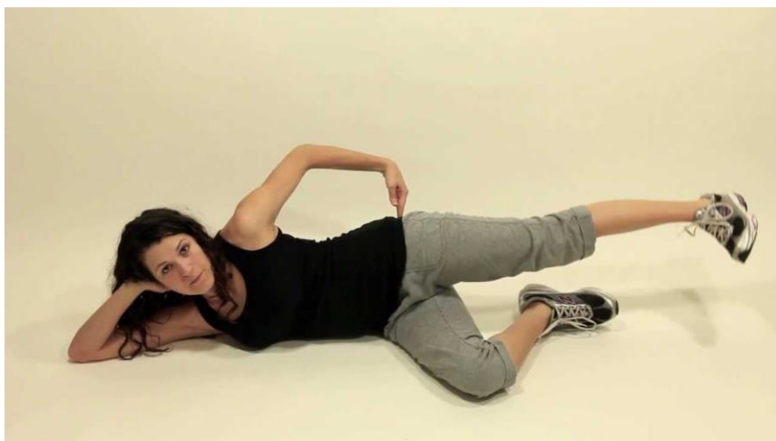
Slika 5.11 Početni položaj bočnog istezanja noge