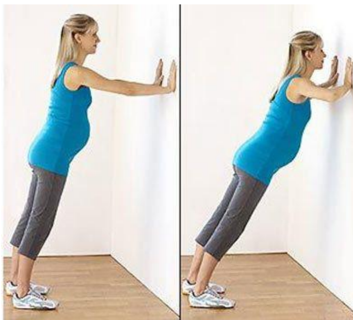
Slika 5.7 Sklek uz zid

Sklek je vježba kojom se jača rameni pojas, ruke, trbušni mišići i leđa [9]. Trudnica u početnom položaju zauzima poziciju istu ženskom skleku, no u stojećem položaju prislanjajući se uz zid (Slika 5.7). Udisanjem spušta čelo prema zidu, prsa gura prema zidu i izvija gornji dio leđa. Oslanja se na ruke kako bi pokret dosegnuo maksimalnu dubinu. Za vrijeme vježbe zdjelica se pomiče, a donji dio tijela je potpuno opušten. Izdisajem odiže se gornji dio tijela oslanjajući se na snagu mišića ramena i ruku.