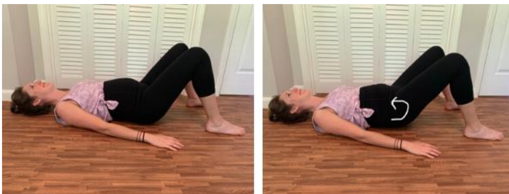
Slika 5.2 Pomicanje zdjelice u ležećem položaju

Vježba se može izvoditi i u ležećem položaju gdje trudnica leži na leđima uz savijen jastuk ispod glave i donjeg dijela leđa (slika 5.2). Noge mora savinuti u koljenima, a šake osloniti na bokove te u tom položaju zdjelicu pomicati naprijed-natrag. Trudnicama se savjetuje da se iz navedenog položaja oprezno ispravljaju izbjegavajući položaj u kojem je glava ispred prsnog koša. Usljed izvođenja navedene vježbe dolazi do otvaranja zdjelice naprijed-natrag i popravljanja tonusa nogu i trbuha. Vježbu je važno provoditi tijekom cijele trudnoće zbog promjene položaja zdjelice [9].