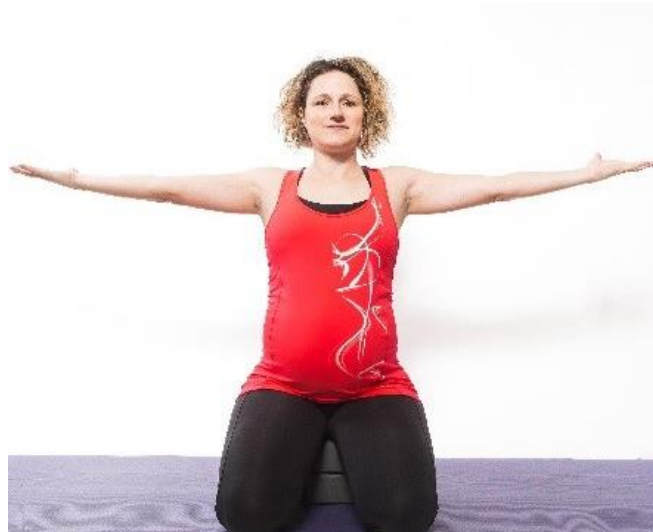
Slika 5.3 Vježba otvaranja ramena

Otvoranje ramena je vježba koja se može izvoditi u stojećem ili sjedećem položaju na lopti ili stolici [9]. Izvođenje vježbe doprinosi smanjenju napetosti bočnih dijelova prsnog koša, vrata i ramena. Dolazi do istezanja bočne strane trupa i otvaranje prostora za njegovo širenje [9]. Trudnica stoji uspravno uz položene dlanove na prsa (slika 5.3). Udiše kroz nos, a izdišući kruži pružajući lijevu ruku prema dolje i unatrag. Vježbu je potrebno ponoviti nekoliko puta lijevom i nekoliko puta desnom rukom. Također, vježba se izvodi i u drugom tromjesečju.