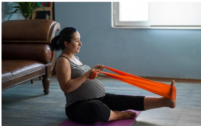
Slika 5.17 Istezanje stražnjeg natkoljениčnog mišića

Istezanjem stražnjeg natkoljениčnog mišića postiže se bolja stabilnost pokreta nogu i zdjelice. Trudnica sjedi na mekanoj podlozi naslonjena na loptu [13]. Udiše, podiže jednu nogu i rukama obuhvaća natkoljениcu. Izdisajem, privlači natkoljениcu iz kuka tako da zateže stopalo prema sebi. Potkoljениcu drži ispruženu, dok je stopalo zategnuto. Zadržava položaj 8 sekundi nakon čega slijedi kratka pauza uz opuštanje te ponavljanje vježbe drugom nogom. Vježba istezanja može se izvoditi na više načina, a jedan od njih je i uz pomoć elastične trake oslanjajući se na zid (slika 5.17).