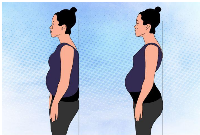
Slika 5.1 Pomicanje zdjelice u stojećem položaju

Trudnica stoji ravno i pomiče zdjelicu naprijed-natrag. U navedenom položaju mijenjat će se udubljenje u donjem dijelu leđa ovisno o tome ide li zdjelica unaprijed ili unatrag (slika 5.1) [9].