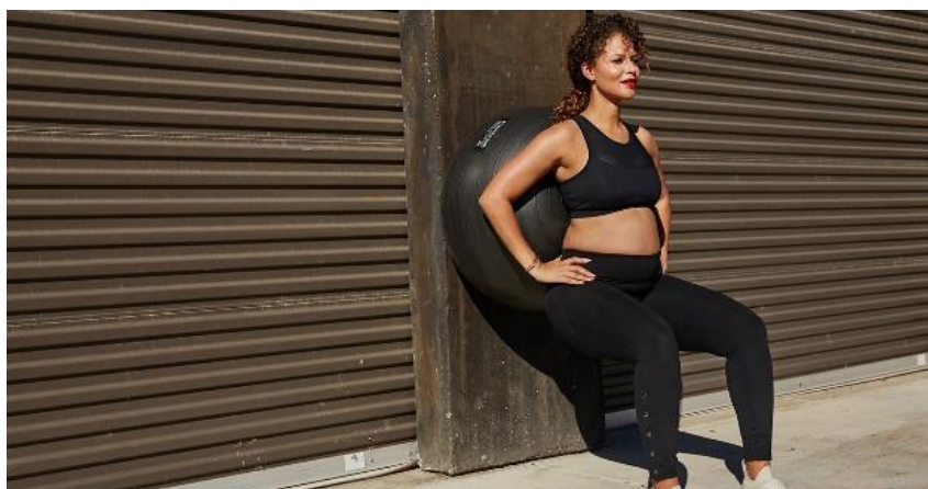
Slika 5.13 Čučanj s osloncem na loptu uz zid

Vježbom se jačaju mišići zdjeličnog dna i nogu te se kontrolira prijenos težine kroz stopala [9]. Trudnica se leđima okreće zidu, leđima se naslanja na loptu (Slika 5.13). Klizeći leđima loptom po zidu spušta se u čučanj koji ne izvodi do kraja obraćajući pažnju na prijenos težine. Spušta se u čučanj poštujući vlastiti prag boli i ugone. Klizeći leđima po lopti vraća se u početni položaj. Udisaj izvodi spuštajući se u čučanj, dok izdisaj izvodi kad se ispravlja.