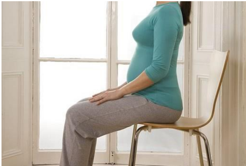
Slika 5.8 Pokretanje zdjelice na stolcu