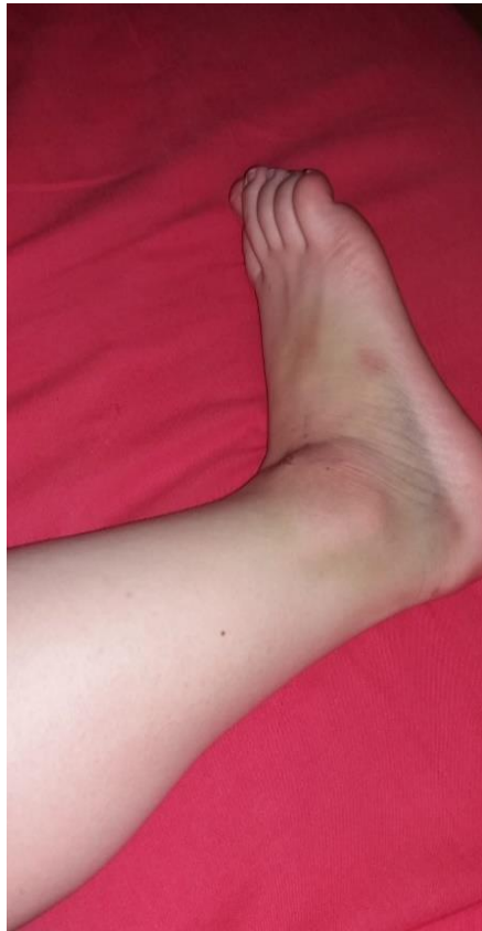
Slika 2.6.4.1.5 Hematom