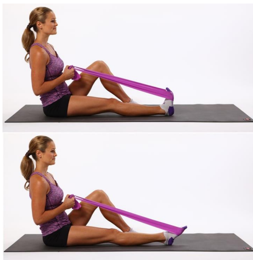
Slika 2.6.4.1.2 Prikaz vježbe dorzalne i plantarne fleksije uz otpor rastezljive trake

U razdoblju od 1. do 4. tjedna poslije operacije provode se individualne vježbe razgibavanja operiranog gležnja. Izvode se samo pokreti dorzalne i plantarne fleksije (Slika 2.6.4.1.2). Vježbe pacijentica izvodi aktivno do maksimalno izvedivog stupnja pokreta kojeg može, stupnjeve koji nedostaju fizioterapeut izvodi potpomognuto. Vježbe za pokret dorzalne i plantarne fleksije pacijent izvodi u ležećem, sjedećem te stojećem stavu. Kod vježbanja se koriste kineziterapijska sredstva i pomagala poput lopte, kose daske, balans daske, rastezljivih traka te utega.