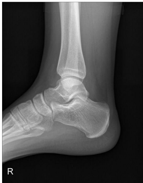
Slika 2.6.2.4 RTG snimka; postranični prikaz gležnja

Nakon tri mjeseca od posljednje kontrole liječnika i dalje je prisutna bolnost. Pacijentica se zbog toga ponovno javlja liječniku. Liječnik ponavlja RTG snimku na kojoj je vidljiva mineralna sjenka oko 8x3 mm (Slika 2.6.2.4, 2.6.2.5) uz vršak fibularnog maleola. Pacijentica navodi izrazitu bolnost kod palpacije vrška maleola te dorzalnu fleksiju izvodi uz prisutnost boli i u smanjenom opsegu pokreta. Liječnik obzirom na simptome te dob traži dodatnu dijagnostičku pretragu, snimku magnetne rezonance desnog gležnja. Također, nastavlja se i fizikalna terapija. Fizijatar propisuje 15 terapija. Na terapijama se provodi medicinska gimnastika, laser, magnetoterapija te izmjenične kupke.