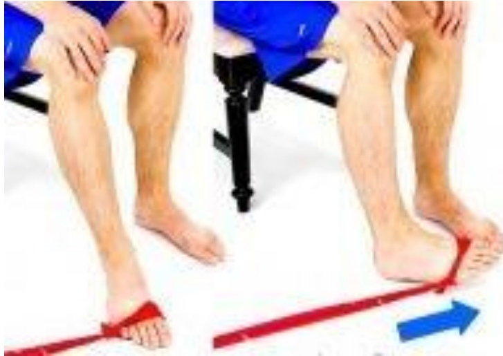
Slika 2.6.4.2.1 Vježbe everzije i inverzije stopala

Izvor: ( https://www.pinterest.co.uk/pin/382102349612720963/ )