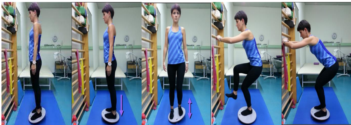
Slika 2.6.4.2.3 Vježbe na balans dasci

Pacijentica započinje provođenje vježbi za veću stabilnost i bolju koordinaciju gležnja. Za navedene vježbe možemo koristiti razna sredstva i pomagala iz kineziterapijske dvorane. Najčešće korištena je balansna daska (Slika 2.6.4.2.3). Na balansnoj dasci mogu se izvoditi razne vježbe poput: stajanje na obje noge, ljuljanje naprijed – natrag, lijevo – desno, plitki i duboki čučanj, stajanje na jednoj nozi sa i bez pridržavanja, čučanj na jednoj nozi itd. Osim na balansnoj dasci pacijentica provodi vježbe na trampolinu. To su vježbe stajanja na prstima, skokova na mjestu, naprijed – natrag te u stranu. Tijekom vježbanja na balansnoj dasci i trampolinu pacijentici je potreban nadzor fizioterapeuta.