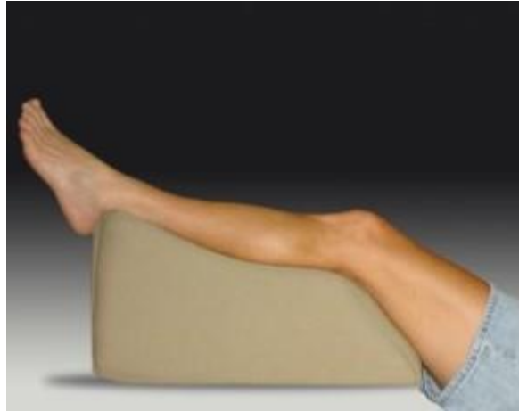
Slika 2.6.4.1.1 Noga na povišenom položaju

Izvor: ( https://soccerfitnessgols.com/2014/04/07/elevate-your-legs-and-your-game/ )