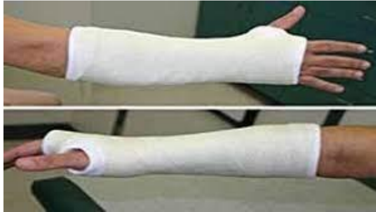
Slika 2.5.1.1.1 Imobilizacija sadrenim zavojem

Sadrenje se vrši na sobnoj temperaturi. Potrebna je dobra vještina postavljanja sadrenih zavoja jer se sadra vrlo brzo suši i stvrdnjava, već nakon 6 minuta sadreni povoj je tvrd i nije ga moguće modelirati. [1]