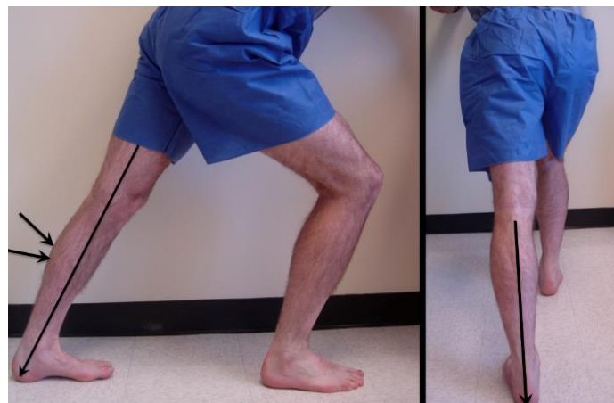
Slika 2.6.4.2.2 Istezanje stražnje strane mišića potkoljenice

Bitne su u ovom procesu svakako i vježbe istezanja iz razloga što se mišić skraćuje ako se samo rade vježbe jačanja. Pacijentica isteže mišiće stopala, potkoljenice (Slika 2.6.4.2.2) i natkoljenice koristeći kineziterapijska sredstva i pomagala.