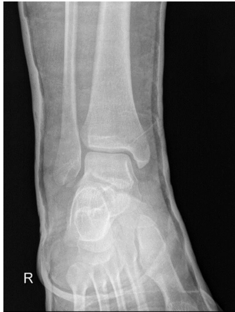
Slika 2.6.2.3 RTG snimka; antero-lateralni prikaz gležnja

Nakon četiri dana pacijentica dolazi na kontrolu. Liječnik ponavlja RTG nalaz koji pokazuje frakturu proksimalnog maleola fibule bez pomaka (Slika 2.6.2.3). Terapija se nastavlja cirkularnim sadrenim zavojem s petom idućih šest tjedana. Pacijenticu se poučava trotaknom hodu sa podlaktičnim štakama sa osloncem na petu koja je postavljena na sadreni povoj. Savjetuje se provođenje vježbi ispod imobilizacije kako bi se smanjilo atrofiranje mišića te držanje desne noge na povišenom.