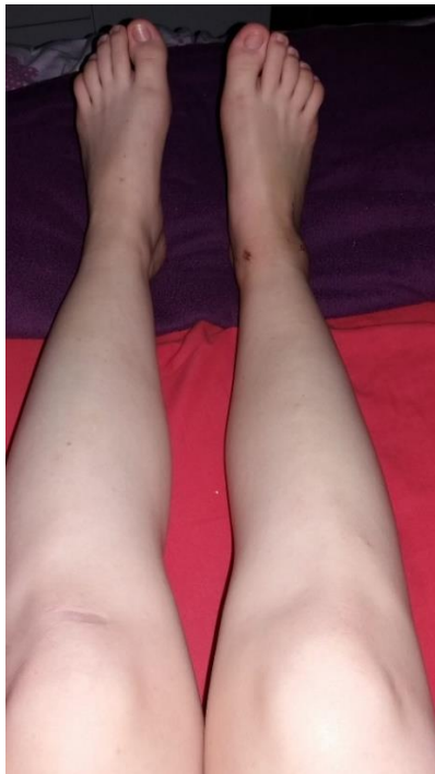
10 Slika 2.6.4.1.4 Edem

Ručna limfna drenaža indicirana je zbog prisutnosti edema (Slika 2.6.4.1.4) i znatnog hematoma (Slika 2.6.4.1.5). Primjenjuje se u svrhu uspostavljanja ravnoteže između tekućina u organizmu. Ručna limfna drenaža noge provodi se prema određenim pravilima. Provodi se od proksimalnog dijela natkoljenice odnosno prepona prema distalno odnosno prema koljenu i stopalu. Nakon obrade natkoljenice obrađuje se koljeno, potkoljenica i na kraju stopalo. Ručna limfna drenaža je ugodna i korisna za pacijenticu.