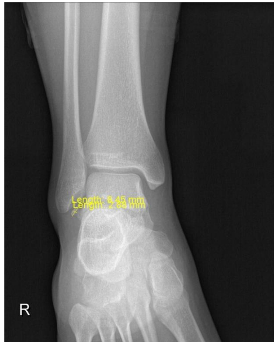
Slika 2.6.2.5 RTG snimka; antero-lateralni prikaz gležnja