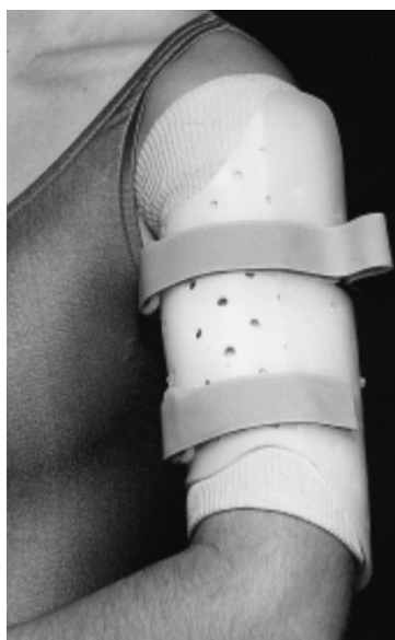
Slika 2.5.1.3.1. Izgled imobilizacije kod prijeloma dijefize humerusa