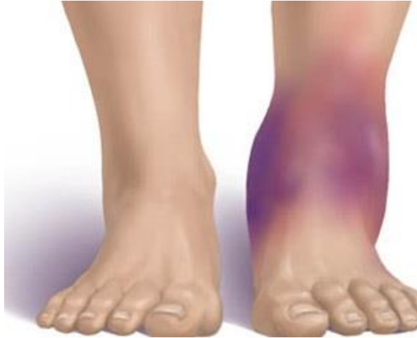
Slika 2.3.1 - Krvni podljev, edem