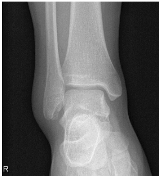
Slika 2.6.2.2 RTG snimka; antero-lateralni prikaz gležnja