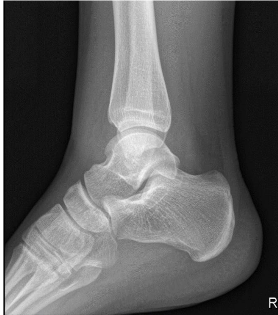
Slika 2.6.2.1 RTG snimka; latero-lateralni prikaz gležnja