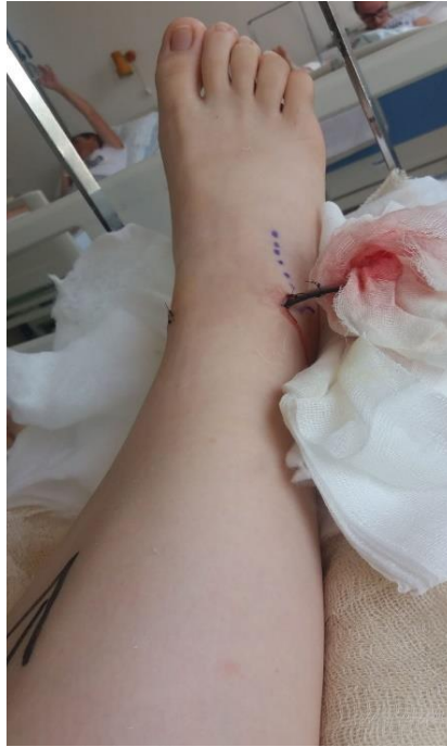
Slika 2.6.2.6 Noga dan nakon operacije