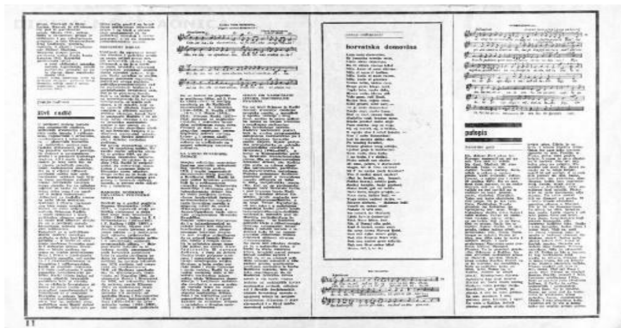
Slika 5.3.1. Tekst "Hrvatske domovine" te notni zapisi „Lijepe naše domovine“ i „Internacionale“, broj 3-4, rujan 1971.

Indikativno je da je uz Tuđmanov tekst tiskan notni zapis „Lijepe naše domovine“, koju je napisao Antun Mihanović, a uz njega i cijeli tekst te tada politički proskribirane hrvatske himne. Za Susretove je žestoke kritičare to bila još jedna potvrda da je redakcija „zagrezla“ u teme koje su bile protivne porukama o „bratstvu i jedinstvu“, na čemu se temeljio Titov posjet gradu. U socijalnom je kontekstu, vezano uz spomenuto naglašavanje socijalnih tema i forsiranje teza da su hrvatski i jugoslavenski komunisti stvarali nekad toliko kritizirane klasne razlike u društvu, provokacijom je ocjenjivana i redakcijska objava notnog zapisa „Internacionale“, koja počinje onih poznatim stihovima ogorčenih i na revoluciju spremnih radničkih slojeva: „Ustajte vi zemaljsko roblje, vi sužnji koje mori glad!“