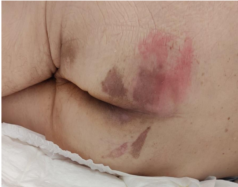
Slika 3.3.1.3.1. Prvi stupanj dekubitusa