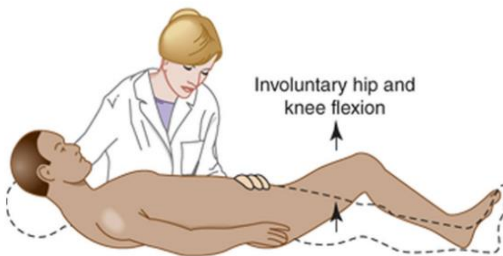
Slika 3.3.2. Brudzinskijev znak