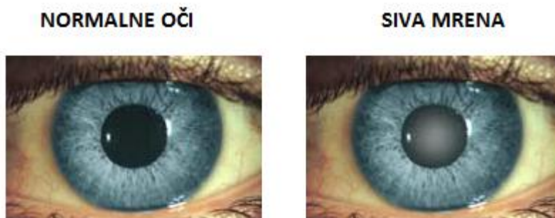
Slika 4.1 Prikaz zdravog oka i oka sa sivom mreñom.