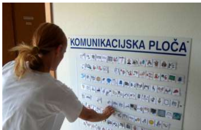
Slika. 4.5.3.1. PECS sustav razmjene slika

[ http://pogledkrozprozor.files.wordpress.com/2010/06/izbornikobjekata3.jpg ]