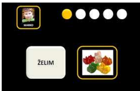
Slika 4.5.3.1. e - PECS sustav razmjene slika

[ http://pogledkrozprozor.files.wordpress.com/2010/06/izbornikobjekata3.jpg ]