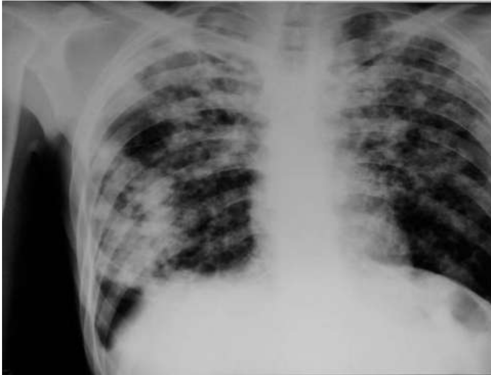
Slika 9.6.1. RTG pluća kod tuberkuloze pluća,

Izvor: http://www.deszkikorhaz.hu/kepek/rtg/html/370.html dostupno 25.09.2015