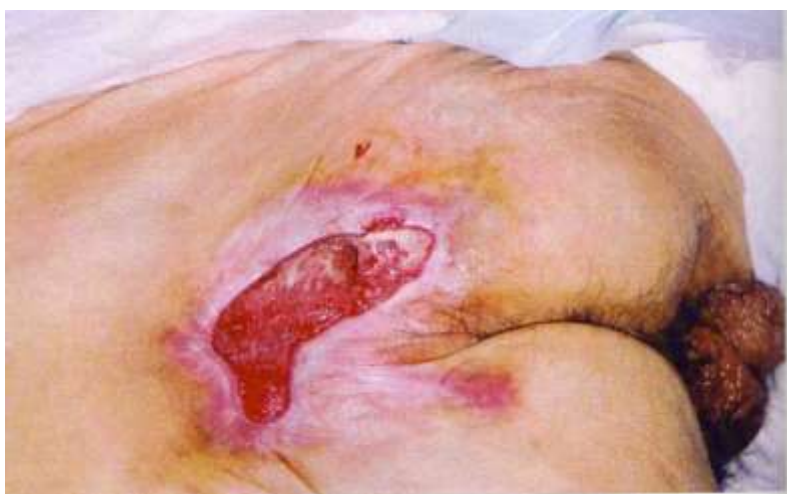
Slika 2.2. Stadij 2. Dekubitusa s torpidnim rubovima i granulacija

Djelomično stanjenje kože koje zahvaća epidermis, dermis ili oboje. Vrijed zahvaća površinske slojeve i klinički se očituje abrazijom, pojavom mjehura ili plitkim kraterom [3]. Dublji dijelovi kože često su zahvaćeni promjenama (slika 2.2.). Briga za nastajanje vrijeda sastoji se u primjeni odgovarajućih obloga, zaštiti i održavanju čistoće područja koje je promijenjeno. Briga o njezi kože mora biti vrlo intenzivna, a sastoji se, osim primjene uobičajenih mjera i u primjeni različitih sredstava kojima se nastoji spriječiti pogoršanje lokalnoga statusa. Tada se očekuje i brzo zacijeljivanje.