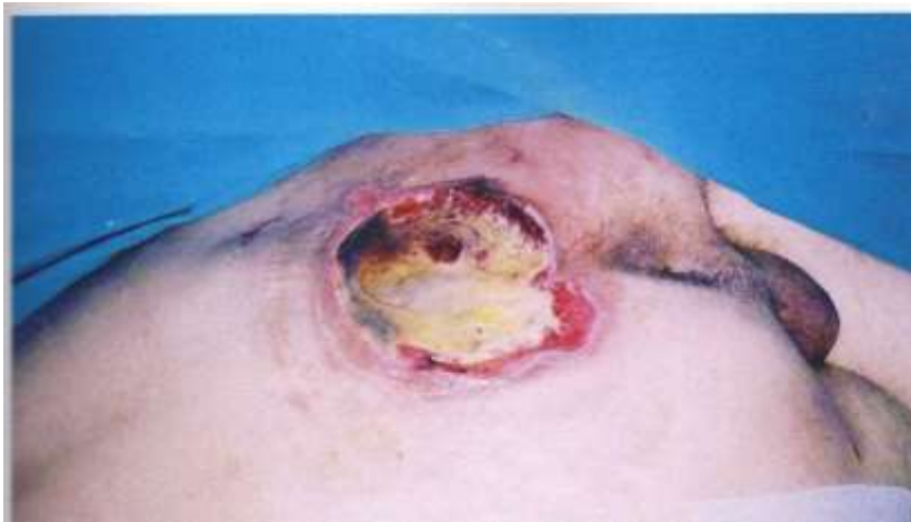
Slika 2.3. Stadij 3. Dekubitus na sakrumu prekriven nekrozama

Potpuni gubitak debljine tkiva. Potkožno masno tkivo može biti vidljivo, ali kost, tetiva ili mišić nisu izloženi/obuhvaćeni. Mrtvo tkivo može biti prisutno, ali ne zasjenjuje debljinu gubitka tkiva (slika 2.3.). Dubina dekubitusa varira prema anatomskom položaju. Most nosa, uho, zatiljak nemaju potkožno tkivo pa treći stadij može biti plitki. S druge strane, na područjima veće debljine mogu se razviti izuzetno duboki dekubitusi trećeg stadija. Kosti i tetive nisu vidljive ili izravno opipljive [4].