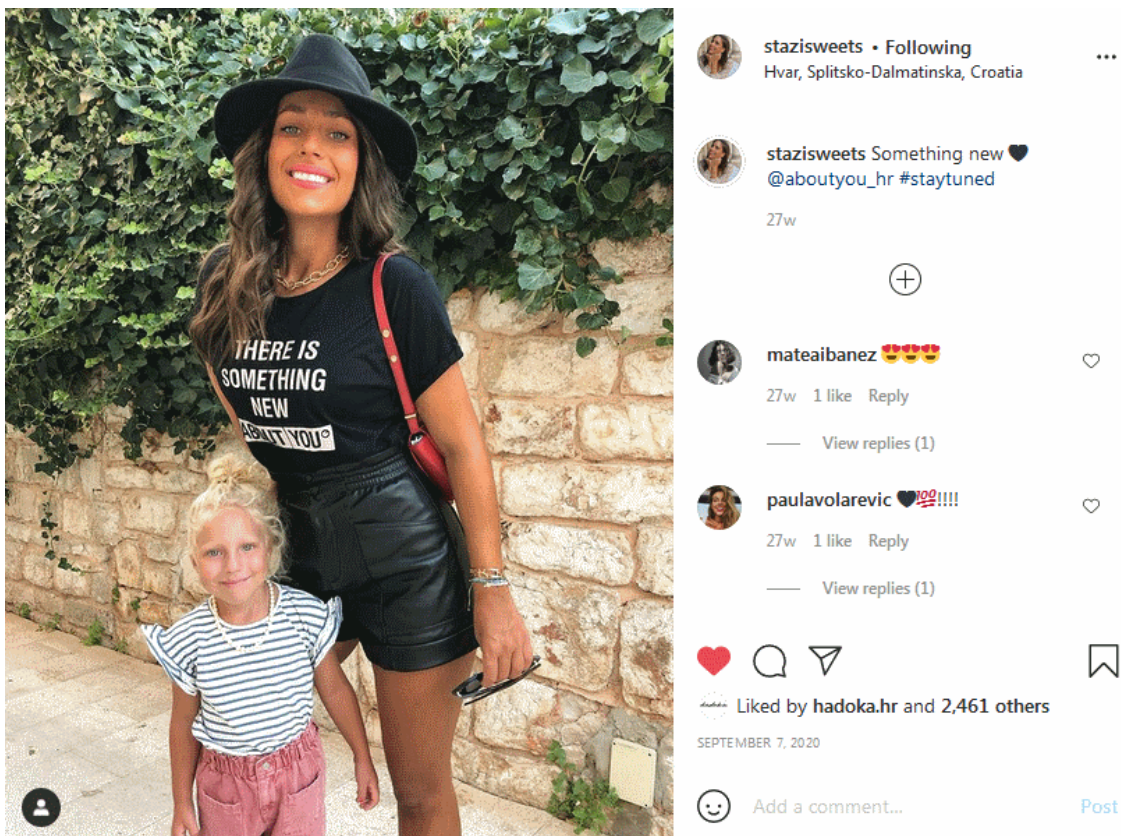
Slika 5.2 Objava vezana za lansiranje modne marke na naše tržište