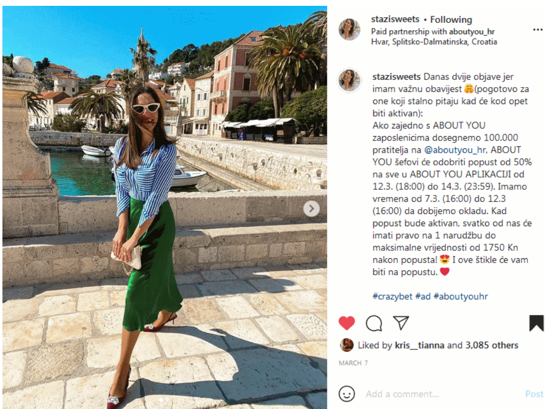
Slika 5.3 Početak kampanje „Oklada svih zaposlenika“

Drugi dio kampanje za razliku od prvog dijela ima drugačije motive, a to je prikupljanje 100 000 pratioca na njihovom službenom Instagram profilu (@aboutyou_hr). Kampanja je najavljena kao velika oklada svih zaposlenika (engl. Crazy Bet ) About You kompanije i influensera sa šefovima same kompanije. O čemu je zapravo bila riječ? Okladili su se ukoliko službeni Instagram profil @aboutyou_hr dosegne 100 000 pratitelja, sve na Kao što je navedeno na slici 5.3, na About You aplikaciji bit će sniženo -50% od 12.03. (18:00) do 14.03. (23:59). Kad popust bude aktivan, svatko će imati pravo na jednu narudžbu do maksimalne vrijednosti od 1750 kn nakon popusta. Kampanja je krenula 7.3.2021. u 16:00 i trajala je do 12.3.2021. do 16:00.