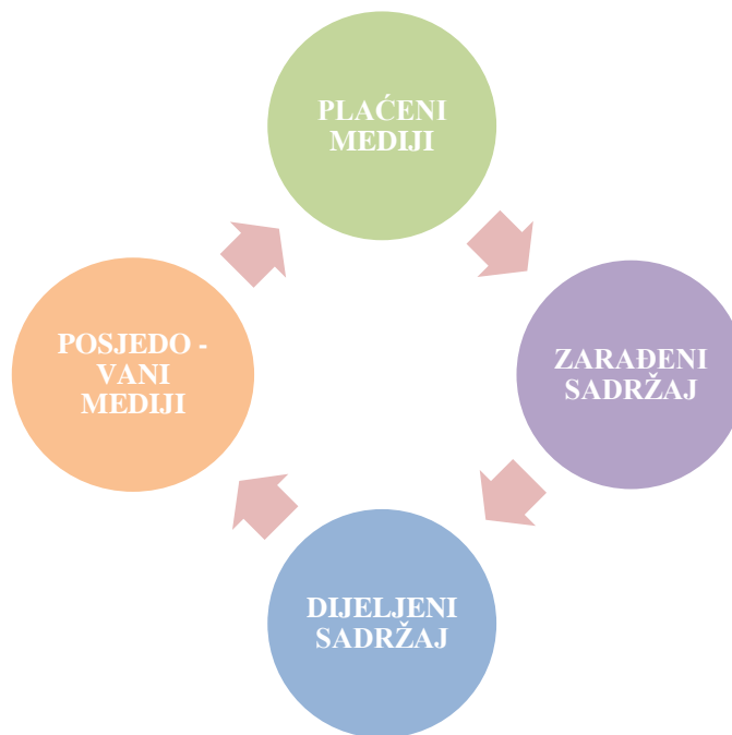
Slika 4.1 PESO model

PESO model definira skup od četiri vrste medija: plaćeni mediji (engl. paid media ), zarađeni sadržaj (engl. earned media ), dijeljeni sadržaj (engl. shared media ) i posjedovani mediji (engl. owned media ) te ih međusobno povezuje kao što je i prikazano slikom 4.1. Ovaj model koristi se isključivo preko društvenih mreža, odnosno Interneta i zbog toga je važno naglasiti ovaj model prije razrade ostatka rada. Svaki kanal ima jednaku važnost i međusobno se nadopunjuju. Plaćeni mediji postaju glavni dio prakse agencije za odnose s javnošću. Zarađene medije možemo svrstati pod tradicionalan način odnosa s javnošću. Dijeljeni sadržaj se definira kao dio gdje korisnici društvenih mreža dijele svoje objave sa ostatkom pratitelja. Posjedovani mediji su oni mediji nad kojima organizacija ima potpunu kontrolu, a u to možemo svrstati aplikacije, elektroničku poštu i slično (Stupar, 2020: 13).