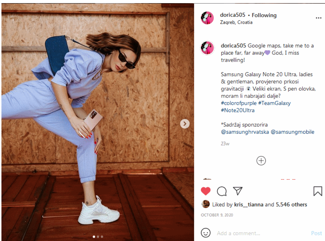
Slika 5.1 Oznake sa suradnju „plaćeno partnerstvo“ ili „sadržaj sponzorira“

Kada influencer objavi sliku sa određenim PR paketom ili sa markom sa kojom ima suradnju važno je da u objavi stoji „plaćeno partnerstvo“ ili „sadržaj sponzorira“ kao što je i prikazano u prilogu slikom 5.1.