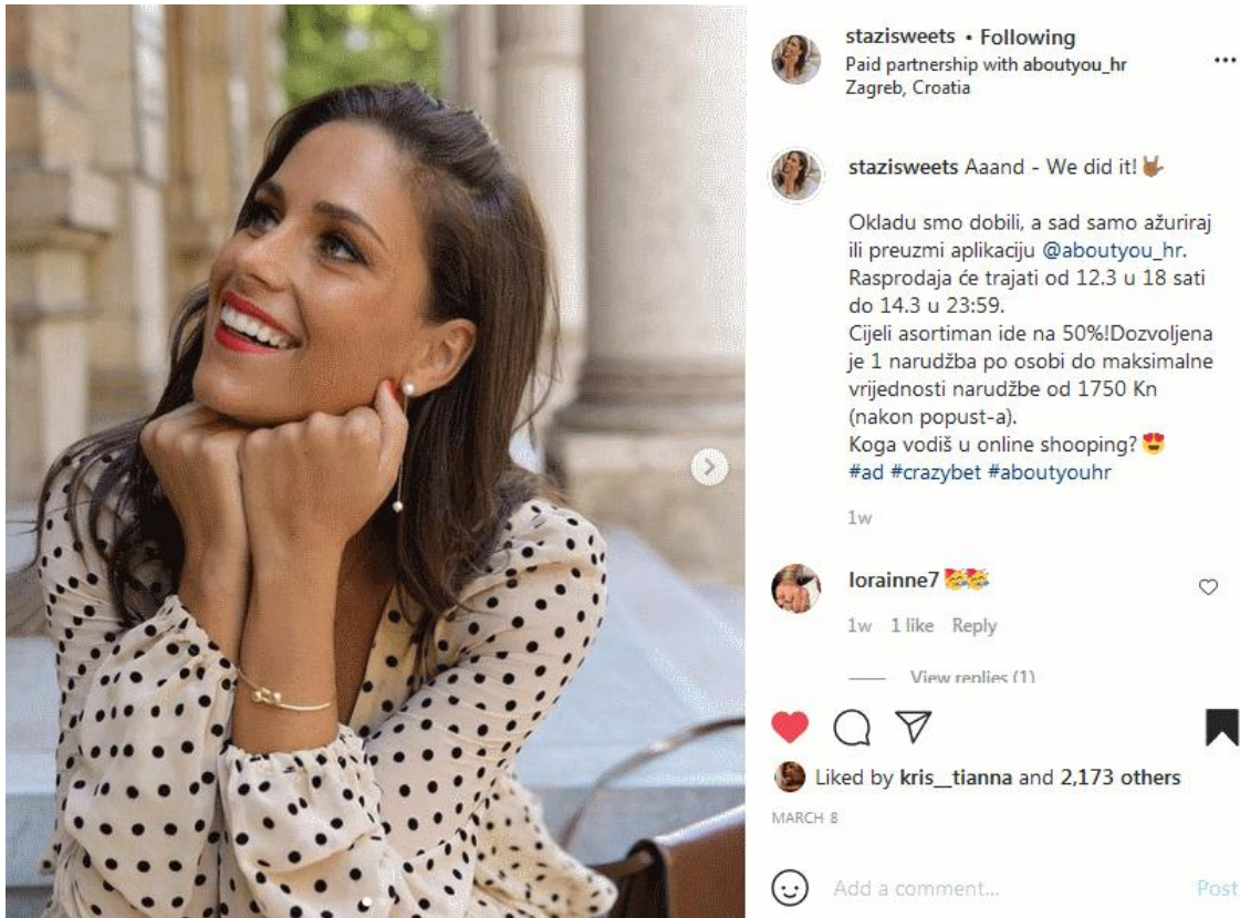
Slika 5.4 Završetak kampanje „Oklada svih zaposlenika“

pratioca kako stoji proces prikupljanja pratioca na @aboutyou_hr kroz Instagram objave kao što je i navedeno na slici 5.4.