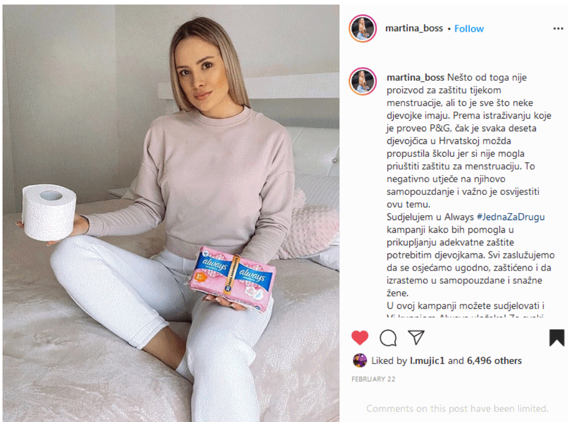
Slika 5.5 Početak kampanje Always #JednaZaDrugu

Kako bi se taj glas još više proširio, unajmljeni su influenceri kako bi pobliže ukazali na problematiku sa kojom se susrećemo. No, nisu svi imali pozitivan pogled na tu temu budući da je donira samo jedan uložak na jedan kupljeni paket tim više što su neke Europske zemlje uvele besplatne uloške, odnosno higijenske potrepštine. Tako je Škotska prva zemlja u Svijetu koja je pružila besplatan i univerzalan pristup higijenskim proizvodima ove namjene. No kako mi nismo bogata država, možemo pomoći ako kao pojedinci radimo na tome (a i podržavanjem ovakvih akcija). Ne bi trebali gledati koliko netko pomaže, koliko je dao ako je pomogao na bilo koji način i dobro je da se od nekud krenulo. Rezime cijele akcije, kako je i navedeno na slici 5.6, bio bi da će Always zajedno sa Hrvatski Crvenim križem donirati 200 000 uložaka djevojkama kojima je to zaista potrebno.