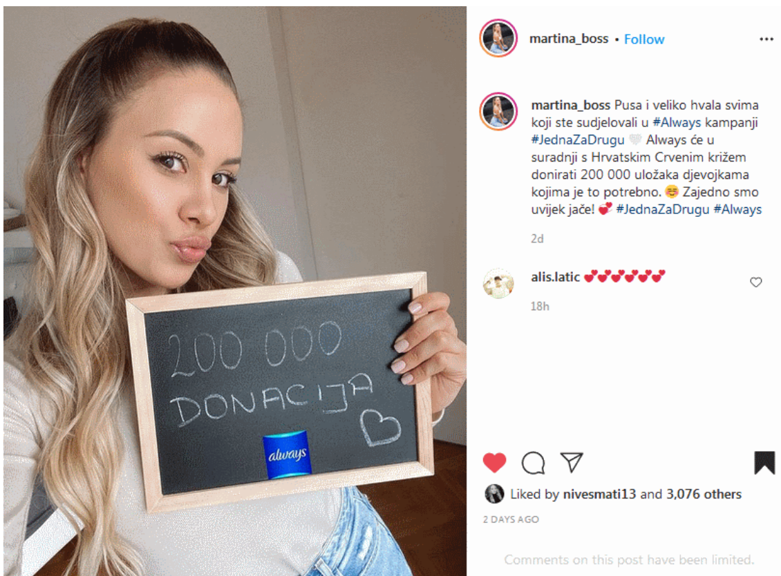
Slika 5.6 Završetak kampanje Always #JednaZaDrugu

Najtužnije u cijeloj situaciji je to što većina tih djevojaka koje ni ne mogu priuštiti higijenske potrepštine za vrijeme menstruacije, koriste toaletni papir umjesto uložaka. Problematika ovog je zaista velika i smatram da je ovo hvale vrijedna akcija i dobro je da su se influenceri uključili u kampanju budući da su oni uzor mladima i dobro je da ponekad promoviraju neke tako bitne stvari, a ne samo modu.