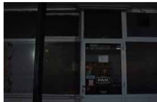
Caffe Bar Ibica ŠETALIŠTE DR. IVŠE KEOVIĆA 51