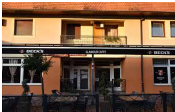
Bistro i caffe Glamur ULICA LJUDEVITA GAJA 3