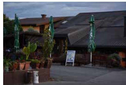
Caffe Bar Tennis ULICA FERDE LIVADIĆA 16