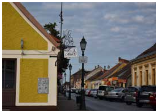
Caffe Bar History ULICA JOSIPA JURJA STROSSMAYERA 2A