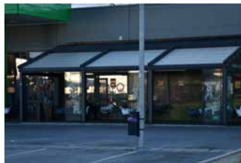
K caffe ULICA ANDRIJE HEBRANGA 2A