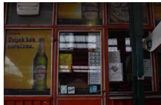
Caffe Bar Grga ŠETALIŠTE DR. IVŠE KEOVIĆA 51