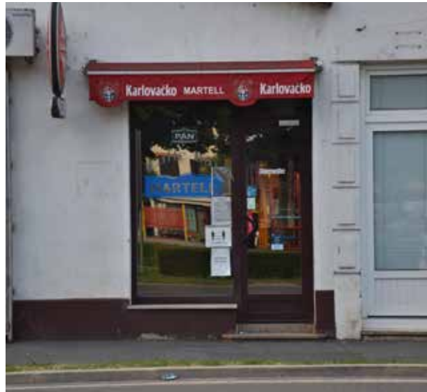
Caffe Bar Mali Spas ULICA VLADIMIRA NADZORA 3