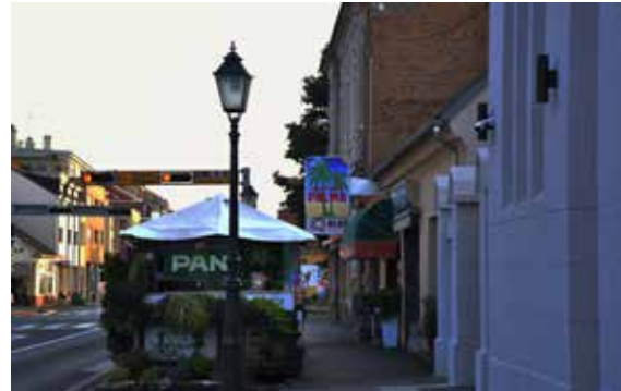
Bakina Kuhinja PRILAZ ANDRIJE HEBRANGA 8