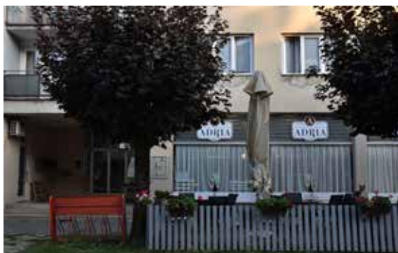
Restoran Zrinski ULICA KRISTE FRANKOPANA 7A