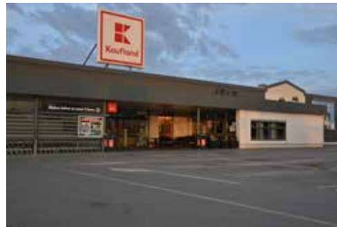
Caffe Bar Predah JUŽNA OBILAZNICA 2A