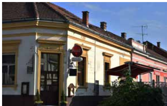
Caffe i bistro Franz TRG EUGENA KVATERNIKA 7