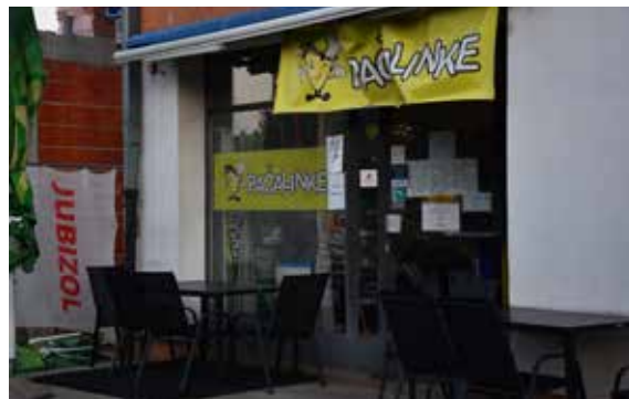
Pačalinke TRG HRVATSKIH BRANITELJA 21