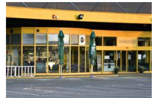
Caffe Bar Fun SLAVONSKA CESTA 2A