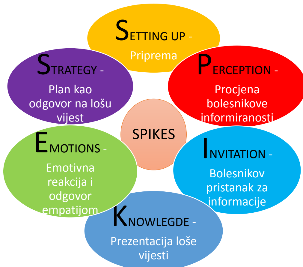
Slika 3.2.1. SPIKES protokol [Autorska slika]

SPIKES protokol koji se primjenjuje prilikom priopćavanja loših vijesti služi kako bi se prikupile informacije, prenijela medicinska saznanja, pružila podrška bolesniku, pridobilo njegovo povjerenje za daljnju suradnju i na kraju izradila strategija za buduće intervencije. Pomoću šest smjernica ovaj protokol pomaže zdravstvenom djelatniku da bi svaki korak odradio upotrebljavajući specifične vještine potrebne kako bi saopćavanje prošlo što bolje [12].