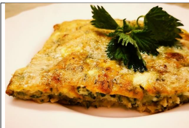
Slika 12. Pita sa koprivom

Zreli listovi koprive koriste se u proizvodnji polutvrdog sira Cornish (Slika 13) koji je napravljen od mlijeka umotan u koprivu. To je ukusan mladi, gipki polutvrđi sir. Sir se lako razlikuje po oblozi od svježih lišća koprive koje se beru u lokalnim živicama i farmama. Listovi privlače sive, bijele i zelene plijesni te oni pomažu da sir sazrije i dodijeli osjetljiv okus siru. Kopriva mijenja kiselost izvan sira. Također je dokumentirano da se listovi koprive mogu koristiti za zgrušnjavanje mlijeka kod proizvodnje sira [24]. U nekim europskim zemljama, prodaje se kruh s listovima koprive (Slika 14). U odnosu na ječmeno i pšenično brašno, brašno od koprive ima puno veći sadržaj bjelančevina, sirovih vlakana, masti, pepela, kalcija, i željeza te ima nizak glikemijski indeks. U usporedbi s ječmom i pšenicom, kopriva ima mnogo veće količine tanina i ukupnih polifenola [34].