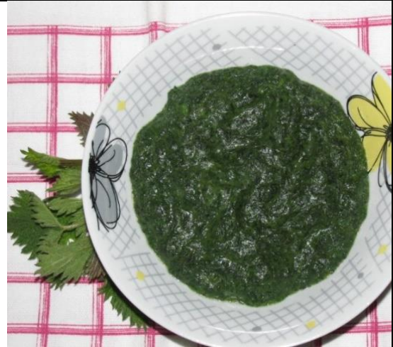
Slika 9. Pire od koprive, izvor: https://superkuvar.com/pire-od-mladih-kopriva/