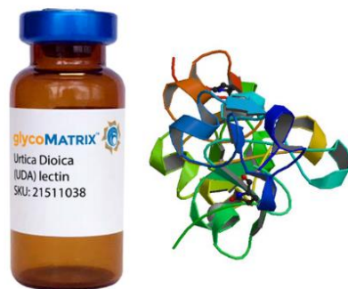
Slika 3. UDA lektin

Kopriva je bogata i fenolnim spojevima ili polifenolima. Oni su jedna od najvećih grupa fitokemikalija široko rasprostranjena u mnogim biljnim vrstama gdje mogu imati različita biološka djelovanja kao što su antioksidacijsko, antimikrobno, imunomodulatorno i sl. Osnovna podjela polifenola je na flavonoide i neflavonoidne spojeve u koje ubrajamo fenolne kiseline, stilbene, tanine i sl.