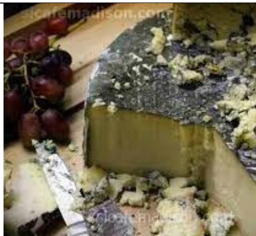
Slika 13. Cornish sir