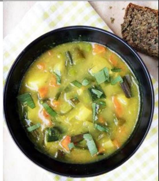
Slika 11. Varivo i kruh s koprivom, izvor: https://alternativa-za-vas.com/index.php/clanak/article/proljetno-varivo-i-kruh-s-koprivom