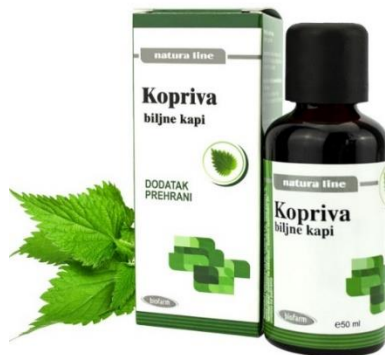
Slika 7. Kapi koprive