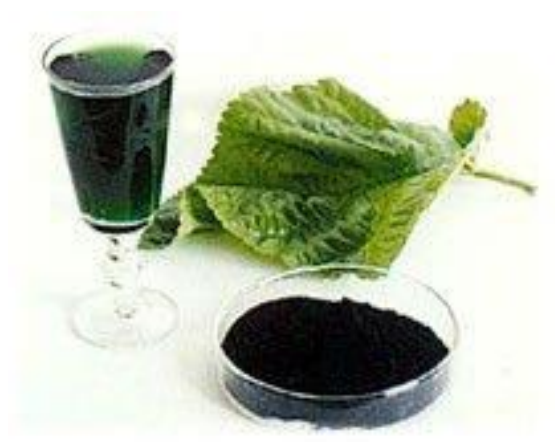
Slika 20. Klorofil

E140 klorofil je dopušten za bojenje engleskog vrsta sira Sage Derby , marmelada, pekmeza, džema i sličnih voćnih pripravaka i proizvoda smanjene energetske vrijednosti. Upotrebljava se u masama za punjenje, topljenom siru, voćnom jogurtu, preljevima, za ukrase kod pekarskih proizvoda, kiselom mlijeku, sladoledu, raznim umacima, preljevima za salate i bombone, prašcima za pudinge, deserte, kreme, bezalkoholnom piću, juhama, koncentratima za umake i juhe, dodacima jelima, senfu, majonezi, grickalicama, začinskim mješavinama te dodacima prehrani [38].