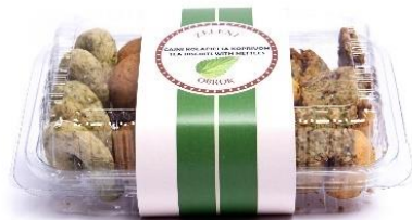
Slika 16. Čajni kolačići s koprivom, izvor: https://ducan- mrkvica.hr/proizvod/koprivini-cajni- kolacici/