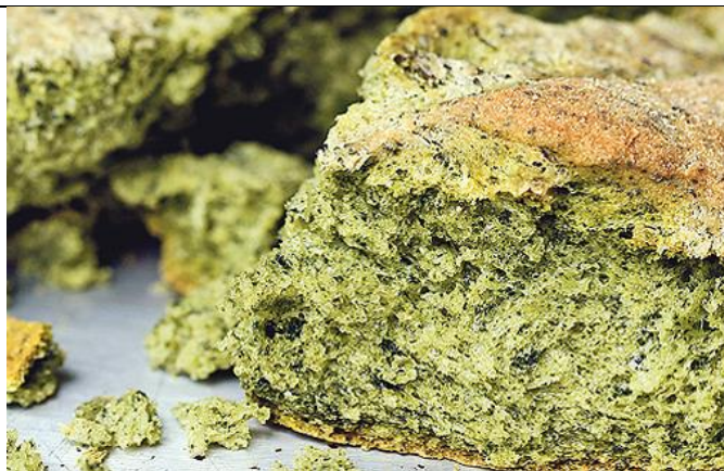
Slika 14. Kruh od koprive