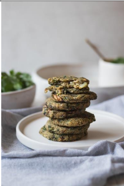
Slika 10. Polpete od koprive, izvor: https://www.journal.hr/blogovi/journal-gastro/polpete-od-koprive-i-shiitaka-recept-kriska-i-po/