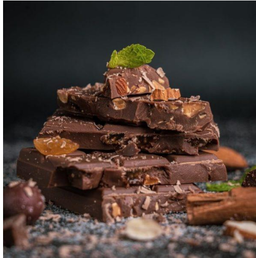
Slika 15. Čokolada s koprivom, izvor: https://soulfood.hr/napravite-sami-svoju-cokoladu/

Tako se i kopriva istražuje kao funkcionalni dodatak - za korištenje u konditorskoj industriji pri čemu je veoma važno optimizirati uvjete ekstrakcije kako bi u konačnom ekstraktu koji se dodaje u proizvod bila očuvana maksimalna količina funkcionalnih sastojaka koji su najčešće iz skupine polifenola [30].