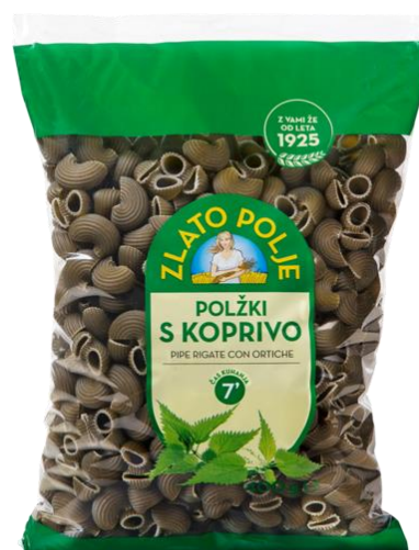
Slika 19. Pužići od koprive

Na našem se tržištu tako mogu naći pužići od koprive (Priprema: U kipuću vodu istrese se tjestenina te se promiješa. Nakon što voda ponovo proključa kuhati onoliko minuta koliko je definirano na samoj ambalaži. Preporučuje se nakon nekog vremena kušati tjesteninu te prema vlastitom ukusu kuhati nekoliko minuta više. Nakon kuhanja tjesteninu treba procijediti, na kratko prelitati hladnom vodom te poslužiti) [37].