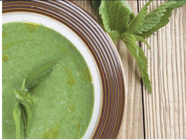
Slika 8. Juha od koprive, izvor: https://www.novolist.hr/life/gastro/brojne-mogucnosti-kopriva-za-bilo-koji-obrok-u-bilo-koje-doba-dana/