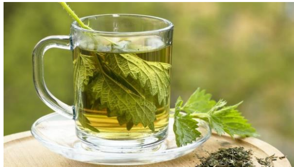
Slika 5. Čaj od koprive

Od koprive se proizvode čajevi i tinkture.