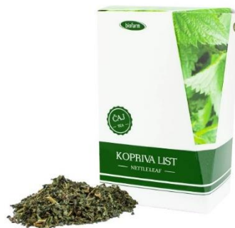
Slika 6. Čaj od lista koprive

Tinktura se vrlo lako može dozirati (u kapljicama). Ekstrahirane tvari netopive su u vodi, talože se u njoj i upravo zbog toga potrebno je takve lijekove prije same upotrebe promućkati. Zbog toga se tinkture pripremaju sa alkoholom, u slučaju da se razrjeđuju s vodom, prije same uporabe ukapaju se u čašu sa malo vode [23].