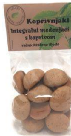
Slika 17. Integralni medenjaci s koprivom, izvor: https://vocarna.hr/trgovina/keksi- kolaci-med-slatko/koprivnjaki-integralni- 150g-zeleni-obrok/