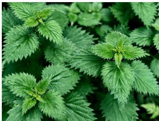
Slika 1. Kopriva, izvor: https://www.ljekovitobiljejerkin.hr/shop/cajevi/kopriva-urtica-dioica-100g/

Zbog povoljnog sadržaja bioaktivnih spojeva poput polifenola, vitamina i minerala, kopriva ima nutritivnu i farmakološku vrijednost. Istraživanja su pokazala njeno antiproliferativno, protuupalno, antioksidativno, analgetsko, antiinfektivno, antiulkusno djelovanje i prevenciju u razvoju kardiovaskularnih bolesti. U novije vrijeme zbog svojih funkcionalnih svojstava dodaje se i u prehrambene proizvode [3].