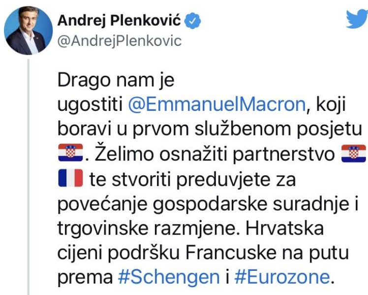
Slika 4. Dobrodošlica premijera Plenkovića francuskom predsjedniku na službenom Twitter profilu