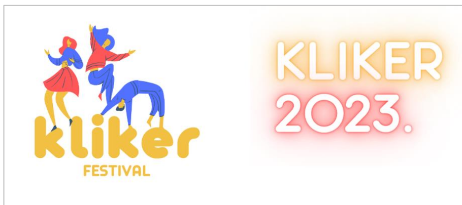
Slika 5-2. Prijedlog logotipa za Kliker festival 2023.