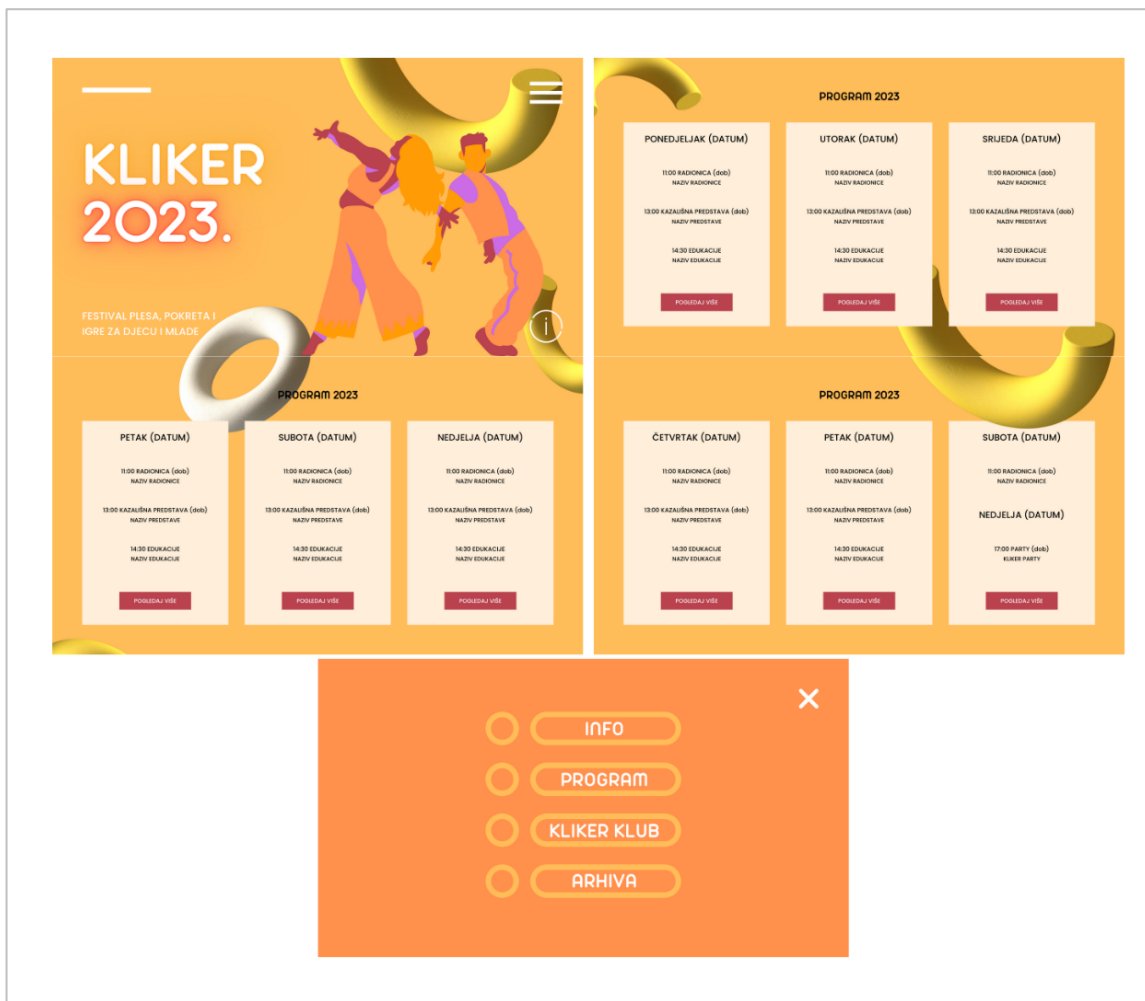
Slika 5-5. Prijedlog vizualnog dijela web stranice Kliker festivala 2023.