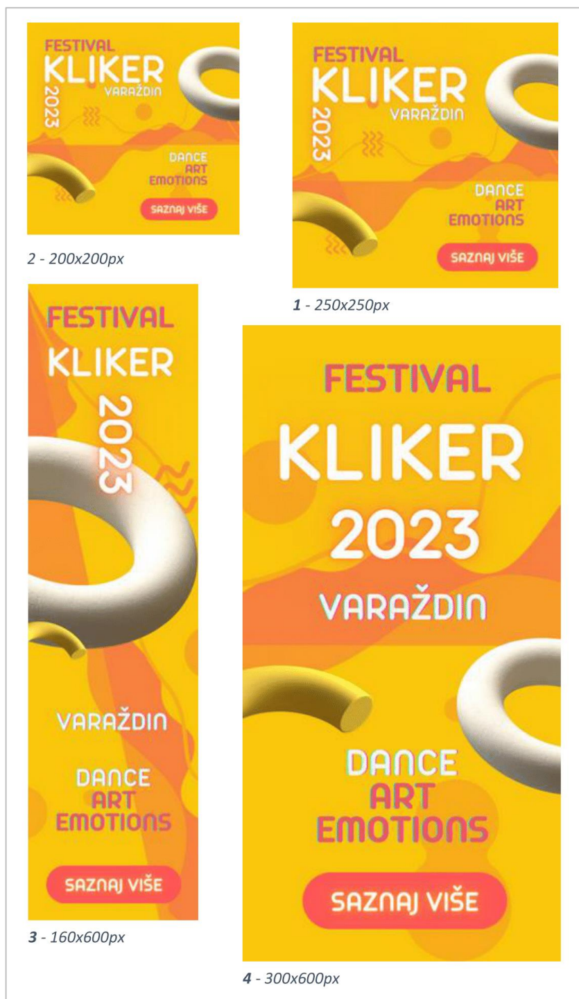
Slika 5-6. Prijedlozi vizuala GoogleAds banneri