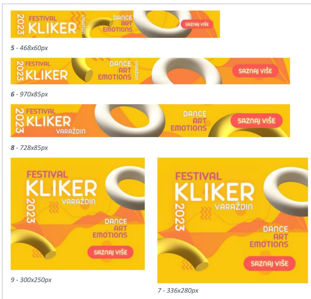
Slika 5-7. Prijedlog vizuala za Google Ads bannere

Drugi dio kreativnih rješenja sastoji se od pet Google kontekstualnih oglasa s pozivom na akciju i link na web stranicu Kliker festivala (do 500 znakova), SEO u obliku pet kreativnih meta tagova (do 50 znakova), pet kratkih (do 25 znakova) i pet dugih meta naslova (do 90 znakova) te pet meta opisa (do 90 znakova).