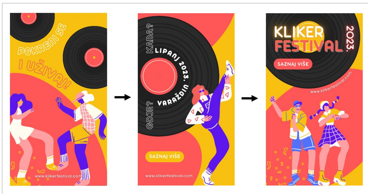
Slika 5-4. Vizuali za sponzorirani Instagram i Facebook story