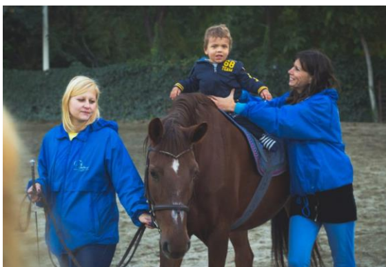
Slika 8.9.1. Terapijsko jahanje