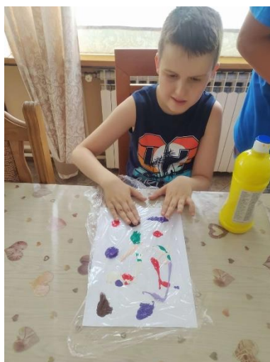
Slika 10.1.2. Likovna radionica