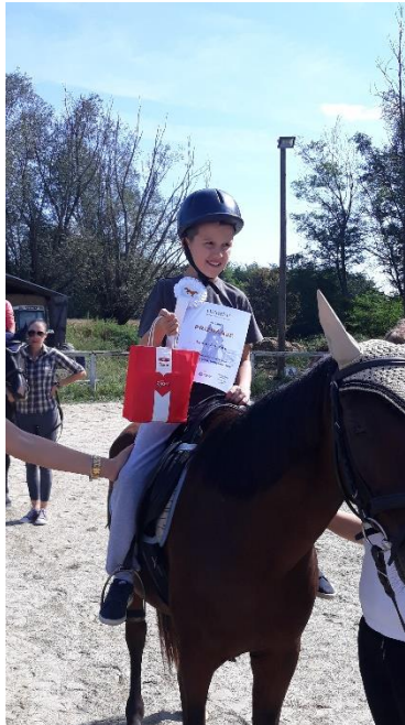
Slika 10.1.1. Terapijsko jahanje

Dječak je uključen u terapijsko jahanje. Od početka je dobro reagirao na konja te je dobro prihvatio taj oblik terapije. Postura mu je bila izrazito loša te mu je za sjedenje na konju bio potreban asistent koji mu je pomagao u održavanju ravnoteže i pravilnog položaja. Koncentracija je također izostajala. Dječak se stalno okretao, puštao je ruke sa uzdi. S vremenom dječak je napredovao. Terapijsko jahanje pomoglo mu je da popravi držanje i koncentraciju. Sada samostalno sjedi na konju (Slika 10.1.1.). Ne pušta ruke sa uzdi i ne okreće se. Isto tako terapija ga veseli i nakon terapije osjeća se sretno. Na terapijsko jahanje dječak odlazi dva puta mjesečno.