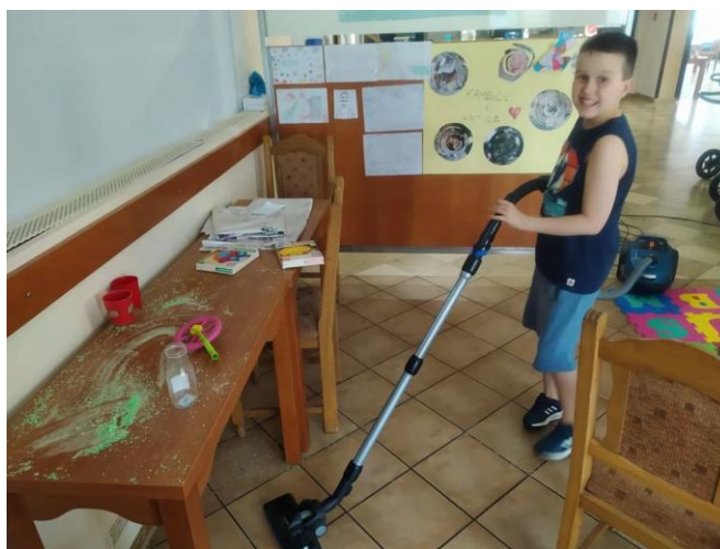
Slika 10.1.3. Radna terapija

Potiče se kreativnost, ali i socijalizacija. Sa radnim terapeutima djeca imaju mogućnost učenja aktivnosti samozbrinjavanja i socijalizacije (Slika 10.1.3. ). Uloga radnih terapeuta je poticati samostalnost i socijalizaciju kod djece. Roditelji dječaka primjećuju kako je dječak veseliji i zadovoljniji te je uz pomoć udruge naučio samostalno izvoditi neke kućanske poslove.