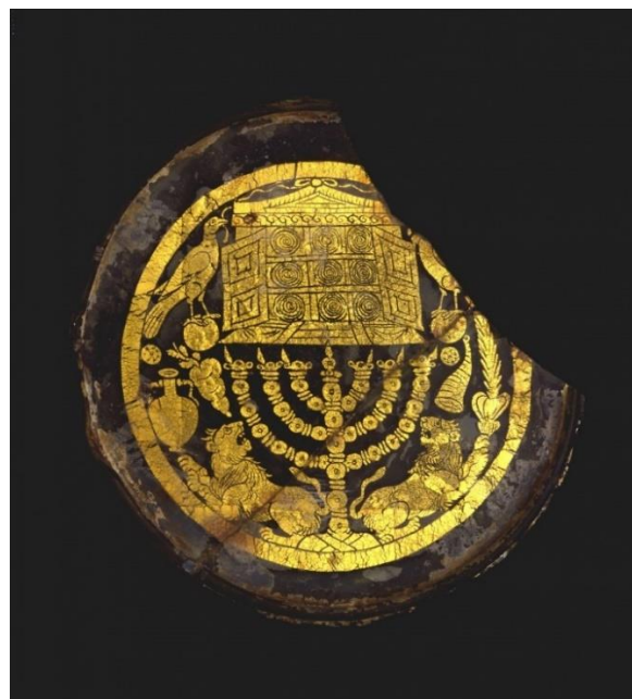
Slika 4 Židovski medaljon

Skupina staklenih posuda koja se je jako isticala zbog svog posebnog stila ukrašavanja je bila ona u Židovskoj tradiciji. Koristili su zlatne listića koje su oblikovali u židovske simbole koje su uvukli između dva sloja staklenih medaljona. Taj se proces često brkao sa pozlatom ali Zlato je pokriveno te to nije pozlata. Takvih medaljona ima još 10 u svijetu možda, prvi je pronađen 1882. Godine u katakombi Svetog Petra, sad se nalazi u Vatikanskom muzeju.