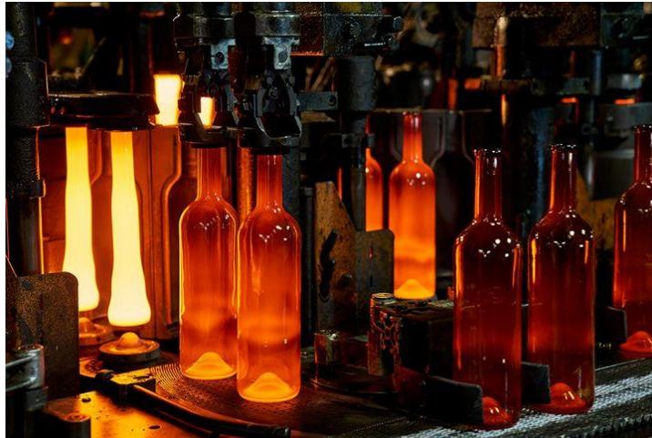
Slika 10 izrada staklenih boca