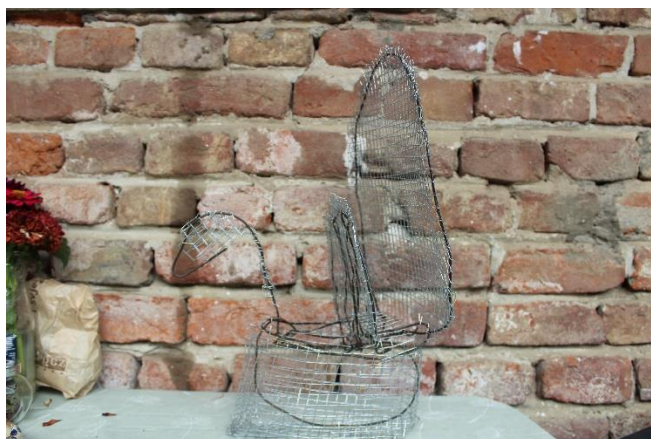
Slika 16 Drugi okvir pauna