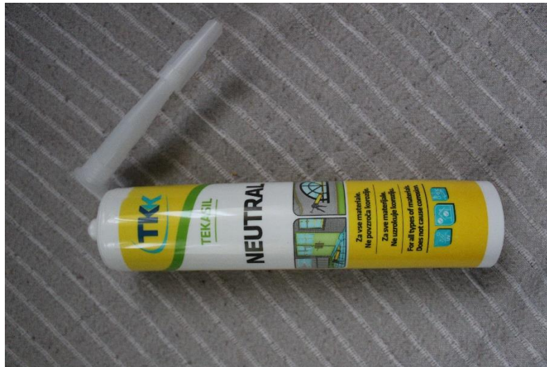
Slika 17 Silikon

Zatim sam koristila stara prozorska stakla te ih razbijala i koristila komadiće za tijelo, vrat, glavu, noge i rep. Također sam razbila pivske boce za dojam zelene boje koje sam dodala na tijelo i rep. Staklo sam ljepila na pletenu žicu sa silikonom.