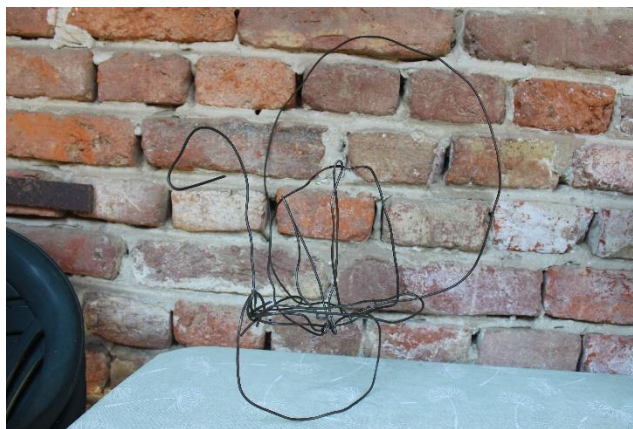
Slika 15 Prvi okvir pauna

Materijal koji sam odabrala kod korištenja za izradu skulpture je bio skoro 80 % reciklirani materijal. Koristila sam žicu koju sam pronašla doma koju nitko nije koristio za prvi dio kostura kod skulpture, te sam zatim kupila pletivu žicu koju sam koristila kao plašt kod prvog dijela postave za podlogu na kojoj će se lakše držati staklo. Izvijala sam žicu u željeni oblik te sam zatim počela rezati komade pletene žice i omatati prvi dio da dobijem čvršću strukturu na kojoj će se držati bolje silikon i staklo.