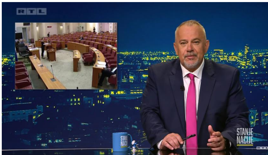
Slika 13. Screenshot „Stanje nacije“ emisija 09

Prije samog završetka, Šprajc je prikazao analizu dosadašnjih emisija „Stanje nacije“. Televizijskih gledatelja u prosjeku svakog petka u terminu emitiranja ima između 350 tisuća i 400 tisuća. Na YouTube kanalu RTL televizije video klipovi emisije imaju 200 tisuća pregleda. Zahvalio se, stoga, gledateljima i dodao: „Odmorite se sljedećih nekoliko petaka od nas, a i mi od vas pa se vidimo krajem kolovoza. Obećavam da ćemo biti još gori nego što smo sada, kao što će i stanje nacije sigurno biti još gore“. Nakon odjave, Šprajc je u gaćama odšetao iz studija.