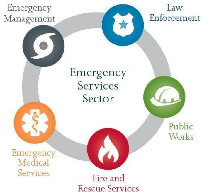
Slika 1. Pet sektora hitnih službi

Ovaj sektor ima pet različitih sektora prikazanih na donjoj slici: