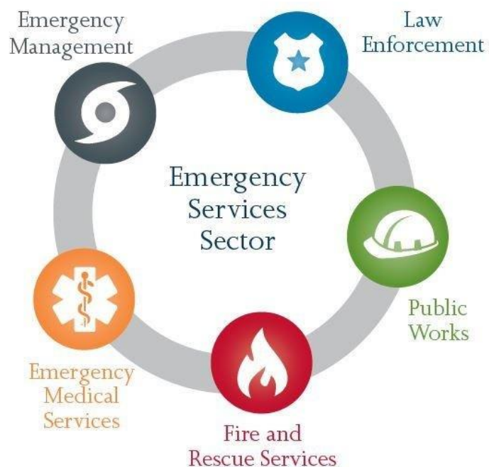
Slika 1. Pet sektora hitnih službi

Ovaj sektor ima pet različitih sektora prikazanih na donjoj slici: