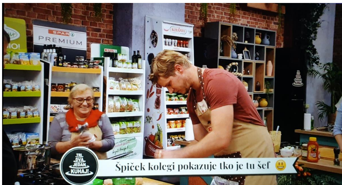
Slika 5 Primjer humorističnog opisa iz šoua Tri, dva, jedan – kuhaj!

Princip analize jednak je onoj prethodnoj s engleskog govornog područja. Kategorije i potkategorije u ovoj analizi sadržaja također su određene na isti način, kako bi se što preciznije analizirali elementi infotainmenta (na temelju zastupljenosti zabavnog sadržaja) u emisijama hrvatskog govornog područja. Prva kategorija u analizi je humor. Iz tablice su vidljiva dva najhumorističnija šoua – „Tri, dva, jedan – kuhaj!“ i „Večera za 5 na selu“. Ove dvije emisije imaju poprilično jednako izražen humor te su vrlo slično koncipirane. Pretpostavka je da sličnosti nisu neobične jer se oba šoua emitiraju na RTL-u, od strane iste produkcije, pa su tako npr. na dnu kadrova izraženi humoristični opisi, često popraćeni emojijima , kojima se opisuje određena situacija na što zanimljiviji način. Slika 5 prikazuje navedeni primjer humorističnog opisa iz šoua „Tri, dva, jedan – kuhaj!“.