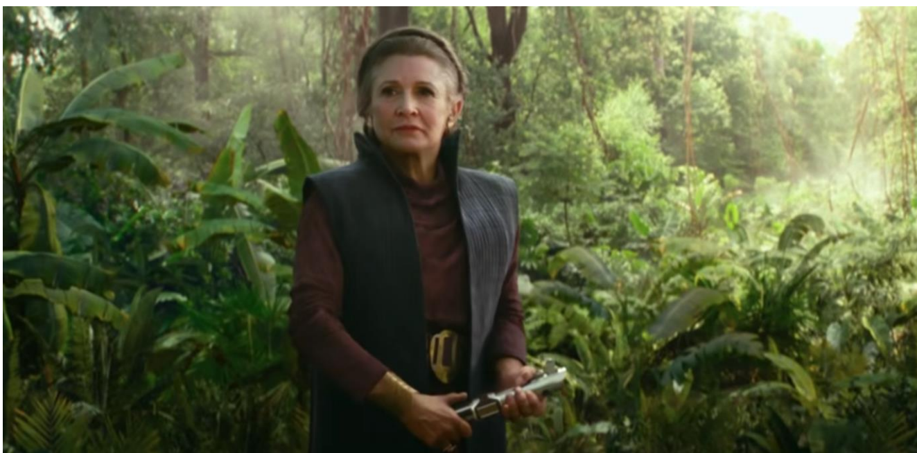
Slika 7: Princeza Leia u zadnjem filmu