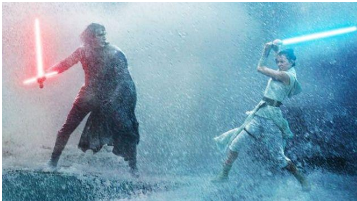
Slika 4.3: Vodena borba