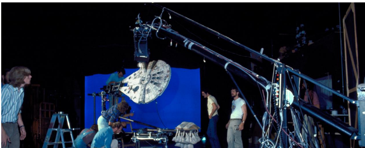
Slika 2.1: Dykstraflex

ILM je napravio revoluciju izgradnjom novog računalno kontroliranog sustava kamera nazvanog Dykstraflex . To je omogućilo ILM-u da doda plavi zaslon iza modela i zadrži model stabilnim, dok pomiče kameru oko objekta kako bi simulirao kretanje. Neke od najpoznatijih scena Ratova zvijezda napravljene su ovom tehnologijom, uključujući početnu scenu filma Nova nada . S ovim efektom, scene svemirskih bitaka djeluju realistično. Dio izazova s korištenjem ove tehnike je da su sve morali napraviti ručno. Na kraju se mukotrpan rad isplatilo jer specijalni efekti u filmu nisu bili ništa što su ljudi prije vidjeli. (Montante, 2018.)[13]