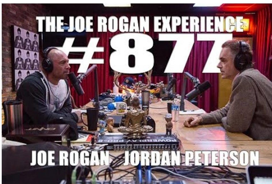
SLIKA 10.1. The Joe Rogan Experience podcast: Jordan Peterson

Razgovorni podcast najčešći je tip podcasta. Čine ga dvoje ljudi koji vode interesantan razgovor, bilo to o određenoj temi ili nekom događaju bitno je da zainteresiraju publiku. Ovakvoj vrsti podcasta najbližnja bi bila radio emisija.