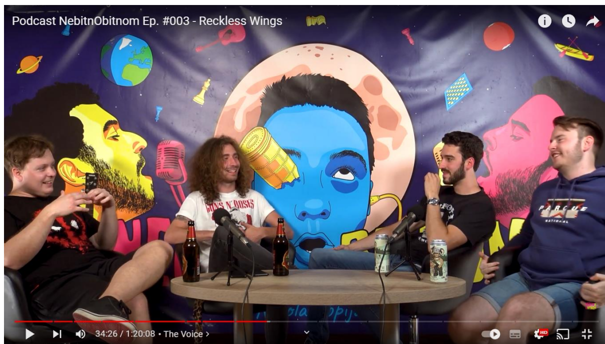
SLIKA 13.1. Podcast NebitnObitnom: Reckless Wings

Podcast NebitnObitnom do sada je snimio 25 epizoda, od kojih su čak 11 bile glazbene. Sa time na umu mogu reći kako najviše iskustva imamo sa glazbenicima, te kako odraditi epizodu na najbolji mogući način. Glazbenu epizodu najbolje je odraditi u što je moguće opuštenijem i ležernijem tonu. Naravno dobra priprema esencijalna je za uspjeh epizode, kao i glazbeno predznanje. Iako se na epizodi nalaze glazbenici, ljudi istih generacija dijele određena sjećanja i vremena, koja mogu biti vrlo zanimljivi segmenti na samoj epizodi, kao što je to bilo u slučaju epizode sa bandom Reckless Wings. Što se tiče vizualne prezentacije poželjno je da su voditelji odjeveni u stilu epizode koju vode.