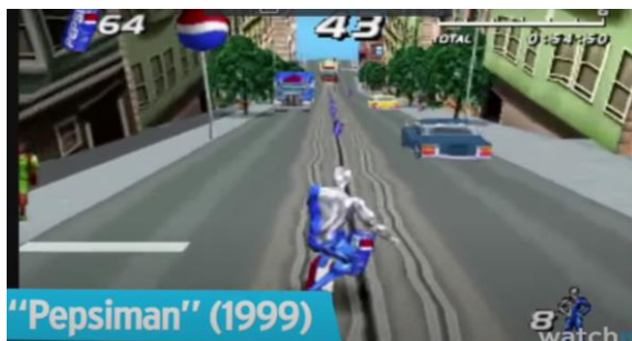
Slika 4: Primjer prikrivenog oglašavanja u videoigrama

„Zadnjih 15 godina marke su se sve intenzivnije počele pojavljivati i u videoigrama, a s napretkom tehnologije utjecaj prikrivenog oglašavanja sve je veći. Videoigre obiluju oglasima koji su namijenjeni najmlađima, češće dječacima nego djevojčicama“ (Ramljak, 2015:4). Iz 1999. godine potječe videoigra „Pepsiman“ gdje čovjek mora sakupljati boce pepsija. Na taj način se jako dobro oglašava američko gazirano piće.