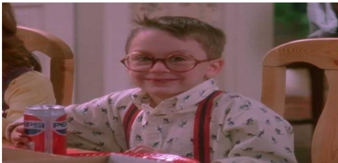
Slika 2: Primjer prikrivenog oglašavanja u filmu Sam u kući

Prikriveno oglašavanje u filmu je jedna od tehnika oglašavanja, a njezina svrha je da informira potencijalne kupce o proizvodima, a specifična je u tome što se npr. proizvod poznatog brenda oglašava u filmu.