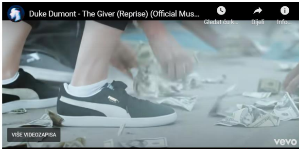
Slika 3: Primjer prikrivenog oglašavanja u glazbi

proizvoda i usluga u ovisnosti o njihovim glazbenim favoritima“ (Stanković 2021:23). „Iako od prikrivenog oglašavanja u glazbenoj industriji obje strane mogu imati koristi, bitno je ne zanemariti kreativnost glazbenika i smisao glazbe uslijed pokušaja promocije određenih proizvoda“ (Stanković 2021:23, Banoža, 2017). U spotu Dukea Dumonta i pjesme The Giver prikriveno se oglašavaju Puma tenisice.