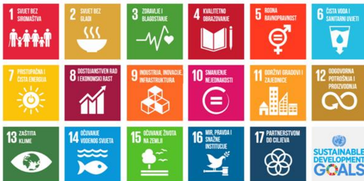
Slika 2. Globalni ciljevi održivog razvoja

(Izvor: Matešić, M. (2021): 17 globalnih ciljeva: poslovni ih lideri ne mogu ostvariti sami, dostupno na https://ideje.hr/17-globalnih-ciljeva-poslovni-ih-lideri-ne-mogu-ostvariti-sami/ , pristupljeno 01.06.2022.)