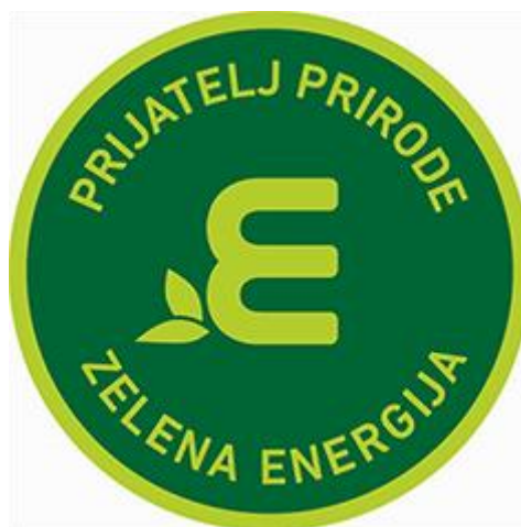
Slika 7. Certifikat Croatia Airlinesa kao nositelja ZelEn ekološkog proizvoda

Kompanija odgovara na zahtjeve svojih kupaca za povećanom mobilnošću, a istovremeno je dugi niz godina uključena u smanjenje buke zrakoplova. Umanjenje buke je Croatia Airlines postigla kao zahtjev u svojoj Izjavi o društvenoj odgovornosti.