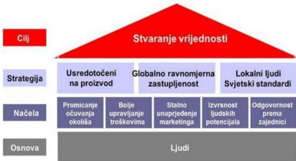
Slika 1. Strategija društveno odgovornog poslovanja

odgovornosti način su da tvrtke pokažu način svoga poslovanja po tom pitanju. Društvena odgovornost poduzeća je vrsta poslovne samoregulacije s ciljem društvene odgovornosti i pozitivnog utjecaja na društvo (Reckman, 2021.). Neki načini na koje tvrtka može prihvatiti DOP uključuju ekološki prihvatljivost i ekološku svijest; promicanje jednakosti, raznolikosti i uključenosti na radnom mjestu; odnos prema zaposlenicima s poštovanjem; vraćanje zajednici; i osiguravanje da su poslovne odluke etičke. DOP je evoluirao od dobrovoljnih izbora pojedinih tvrtki do obveznih propisa na regionalnoj, nacionalnoj i međunarodnoj razini. Međutim, mnoge tvrtke odlučuju ići dalje od zakonskih zahtjeva i ugrađuju ideju “činjenja dobra” u svoje poslovne modele (Reckman, 2021.).