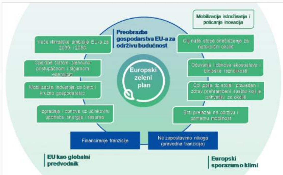
Slika 3. Odrednice Europskog zelenog plana